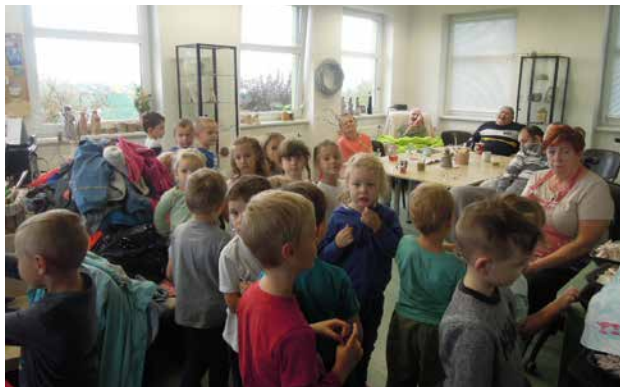
Návštěva v DBZ.

a děti se samy rozpovídaly o svých zájmech a tužbách.