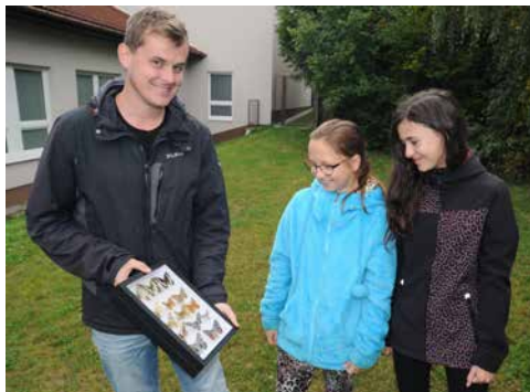
Ukázka hmyzu – motýli.

Letošní jubilejní ročník byl ozvláštněn i razítkem vytvořeným bítešským výtvar-