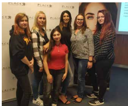
Společné foto ze školení.

Dne 19. 10. 2019 se žákyně 2. ročníku oboru Kadeřník zúčastnily semináře, který byl zaměřen na technologické barvení a zesvětlení vlasů. Žákyně se díky němu naučily novou techniku baleáže a aktuální technologické postupy odbarvování a tónování vlasů. Školení provedla špičková italská kadeřnice Angela Cannito – odbornice, která představila italskou profesionální vlasovou kosmetiku Black Professional Line.