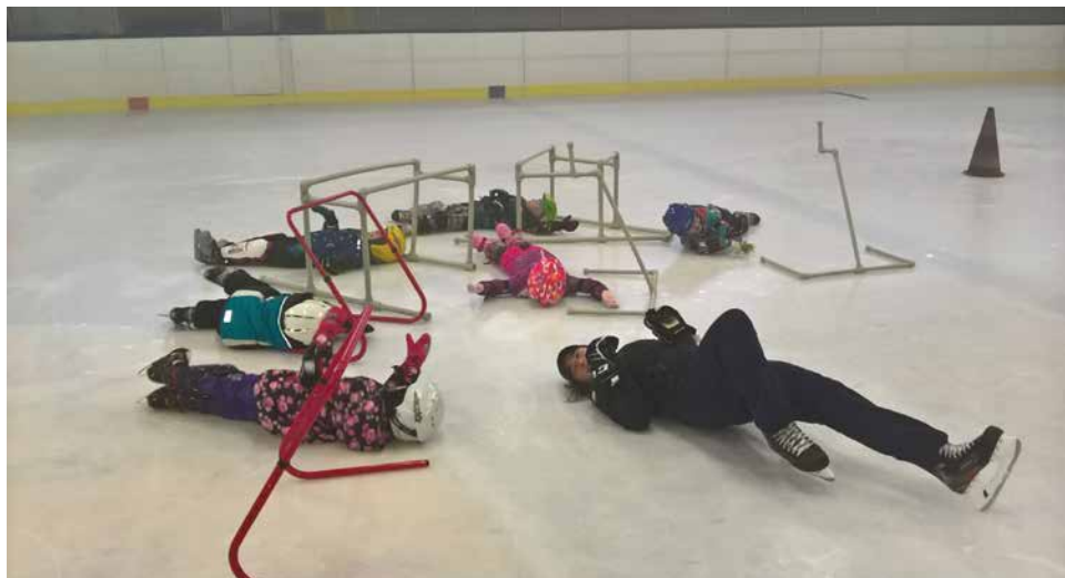
Školka na bruslích.