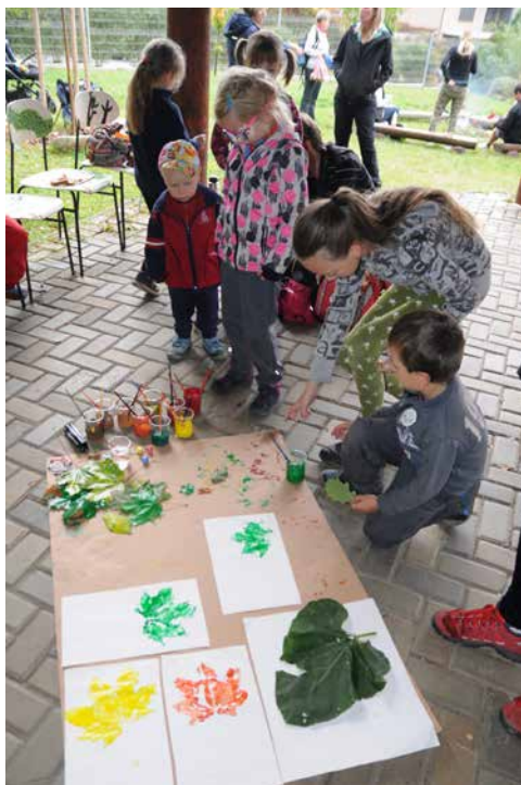
Dílňka – otisky listů. | Foto: Pavel Holánek