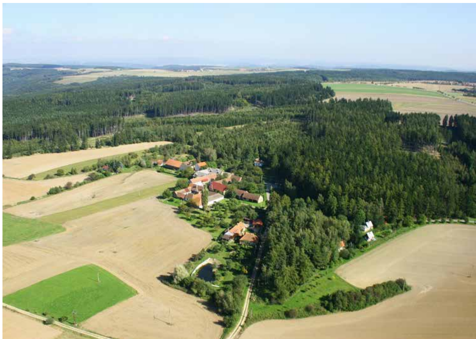
Letecký snímek na Pánov.

Útulná vesnička s 16-ti stálými obyvateli, která je tak trochu vzdálená civilizačnímu shonu, je nejmenší z místních částí města Velké Bíteše. Přesto nás překvapí svou letitou historií, členitým katastrem odděleným od katastru města i několika významnými rodáky, kteří přispěli k rozvoji české kultury, politiky i veřejného života.