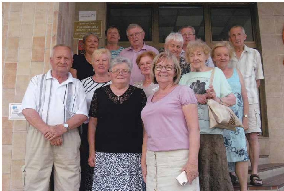
Účastníci rekondičního pobytu v Poděbradech.