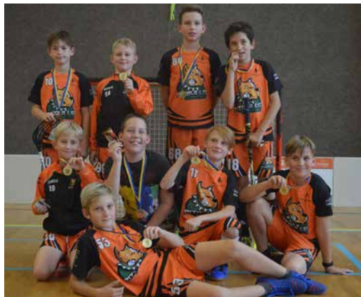
Vítězný tým z Ivančic.

V sobotu 19. října 2019 se v hale TJ Spartak Velká Bíteš uskutečnil turnaj 4.–6. třídy mladších žáků ve florbalu. Zúčastnilo se celkem 8 týmů. Jako každý rok byly zápasy velice vyrovnané. Naštěstí se celý turnaj obešel bez zranění a všechny zápasy proběhly v pořádku a bez větších problémů.