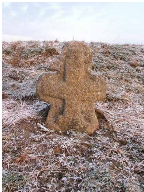
Cyrilek u cesty do Jindřichova.