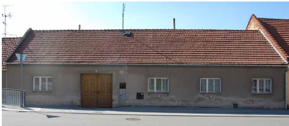
Dům čp. 27 v současnosti.

Seriál o domech a jejich majitelích na náměstí, v ulicích i na předměstích Velké Bíteše zabývající se dobou před polovinou 20. století. Nyní ulice LÁNICE, čp. 27: