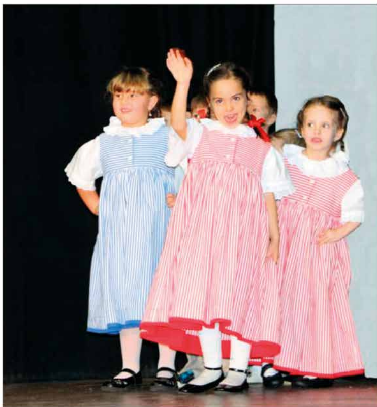
Na бітеšáckém jarmarku 2018 - Sluníčko