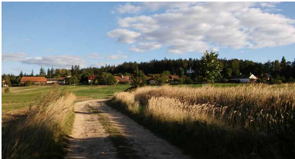
Pohled na Pánov.

a právě její zvládnutí považuji pro další život osady Pánov za nejdůležitější. Pro představu – já sám to mám z rodné chalupy do lesa cirká 50 metrů.