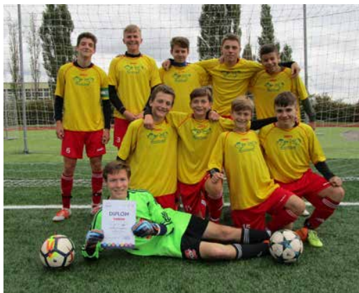
Společné foto z turnaje. | Foto: Naděžda Malcová

Společné foto z turnaje. | Foto: Naděžda Malcová rek, Jiří Hvězda, Petr Karmazín, Martin Požár, Vít Preis.