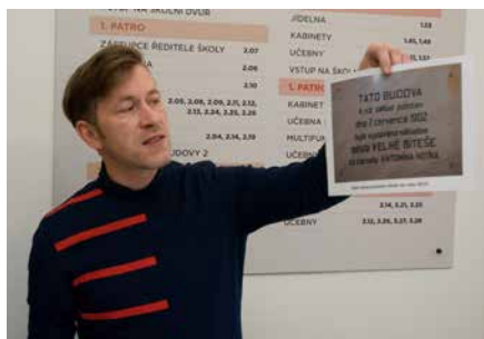
Ředitel muzea vysvětluje přítomným oboustranný text na pamětní desce.

Při příležitosti slavnostního otevření nově zrekonstruované budovy naší školy se uskutečnilo dne 24. října 2019 uložení dvou pamětních schránek do vstupních prostor školy. První schránka byla uložena do stěny vstupního prostoru v budově na ulici Tišnovská, ze které byla 3. ledna 2018 při přípravách na rekonstrukci budovy slavnostně vyjmuta původní pamětní schránka z roku 1904. Historie a obsah původní schránky i průběh jejího vyjmutí byl popsán v únorovém čísle Zpravodaje 2018. Originály dokumentů, které byly v původní schránce uloženy, jsou uschovány v městském muzeu a do nové pamětní schránky byly vloženy jejich kopie. Druhá schránka byla uložena do stěny