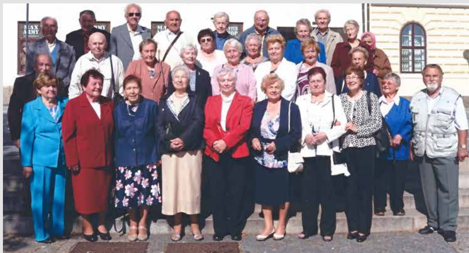
Společná fotografie osmdesátníků.