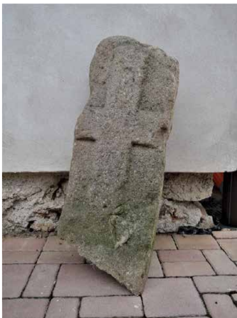
Smírčí kamen ve městě.

katastrů obcí, s popisem a fotografií, jsou jim přidělována evidenční čísla. Na bítešském katastru jsou uvedeny dva smírčí kameny, známý Cyrilek u cesty do Jindřichova a druhý přímo ve městě, jak je opřený o zeď domu. Právě o tomto smírčím kameni je tato reportáž.