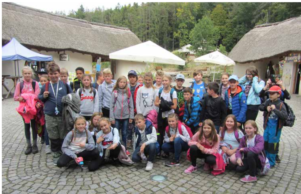
Návštěva v ZOO Jihlava.

Děti z prvních ročníků již mají za sebou „první školní výlet“. Ve čtvrtek 26. září navštívily ZOO Jihlava. Stihly si prohlédnout zvířata ve výběžích a zúčastnily se vzdělávacího programu „Mazlíčci“ v environmentálním centru PodpoVRChem.