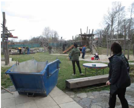
Brigáda na školní zahradě.

Protože jaro již kalendářně nastalo, musela se zahrada na tuto změnu připravit. Rozhodli jsme se poprosit o pomoc rodiče na-