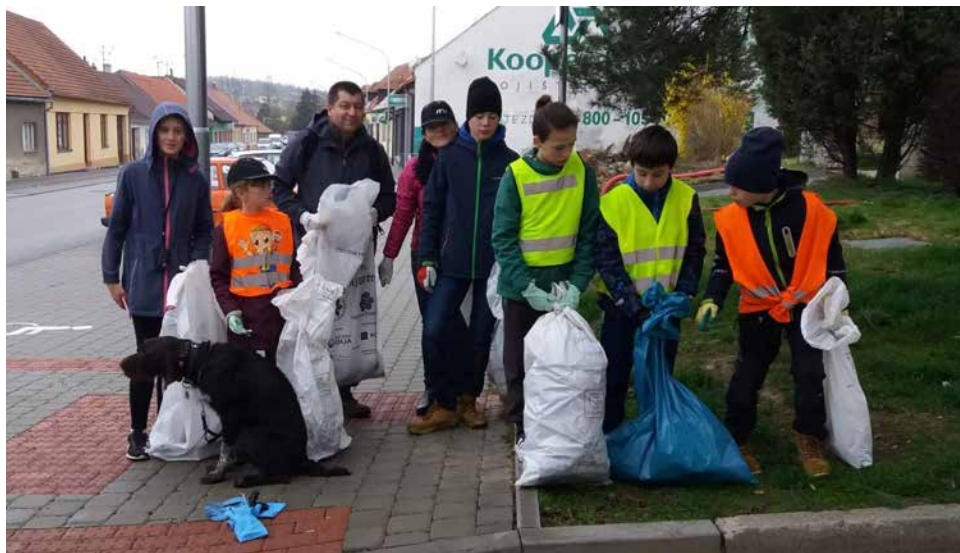
Akce poprvé i ve Velké Bíteši.

Sraz byl v sobotu 6. 4. 2019 v 9.00 hodin před kulturním domem, kde se dobrovolníci zapřeli a obdrželi pytle, stahovací pásky, popřípadě rukavice a reflexní vesty. U dalšího stolečku jim byly po domluvě sděleny trasy úklidu. Poté promluvil starosta a slíbil, že příště se úklidu také aktivně zúčastní. Dále se pak dobrovolníci dozvěděli organizační věci a byli poučeni o bezpečnosti. Kolem půl desáté se všichni rozešli uklízet svoje zvolené trasy.