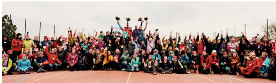
Společné foto závodnic. | Foto: Archiv NMR

Běželo se v náročných podmínkách zimního trailu s teplotami kolem nuly . „Už jsme během těch pěti let uspokojily závodnice, kterým vyhovuje téměř letní ve-