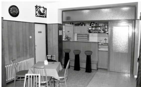
Sauna – vstupní hala s barem.