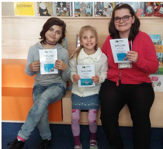
Žákyně se svými diplomy.

Tak jako loňský rok i tentokrát se naše škola zapojila do recitační soutěže konané v Městské knihovně ve Velkém Meziříčí. Nejdříve samozřejmě proběhlo školní kolo, kdy výkony žáků hodnotily paní učitelky i paní asistentky. Porota rozhodně neměla lehký úkol, neboť hodnotila nejenom zapamatování textu, jeho přednes – tempo, výslovnost, hlasitost, ale i celkovou náročnost textů a kontakt přednášejícího s publikem. Školního kola se zúčastnilo 21 žáků