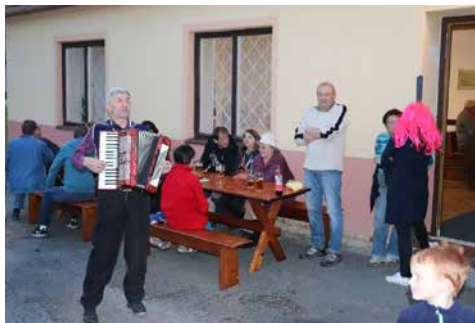
Sousedské posezení před KD.