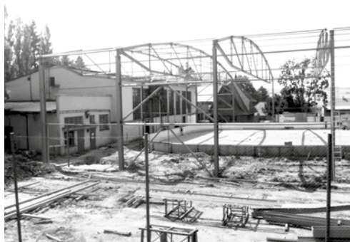
Přimrazovací ledová plocha při zastřešování (vlevo strojovna a sportovní hala).