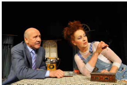
Z představení.