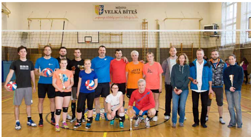
Společné foto.

Tým ze Znojma svou skupinu s přehledem vyhrál a neztratil ani bod. Ostatní utkání se rozhodovala v koncovkách a pořadí na dalších místech ve skupině určil až předposlední zápas Prosatína s družstvem Frantíkovci. Po boji vyhráli Frantíkovci 2:0 (25:19 a 25:23), získali tak do konečné tabulky 3 body a s celkovým počtem 4 bodů obsadili ve skupině 2. místo. To znamenalo postup ze skupiny a boj o celkové 3. místo. Prohra Prosatínu náladu nezkažila, hráči odvedli pěkný výkon a v publiku měli nejvíce fanoušků. Mohutně je povzbuzovali táborníci, ale i děvčata z družstva žákyň.