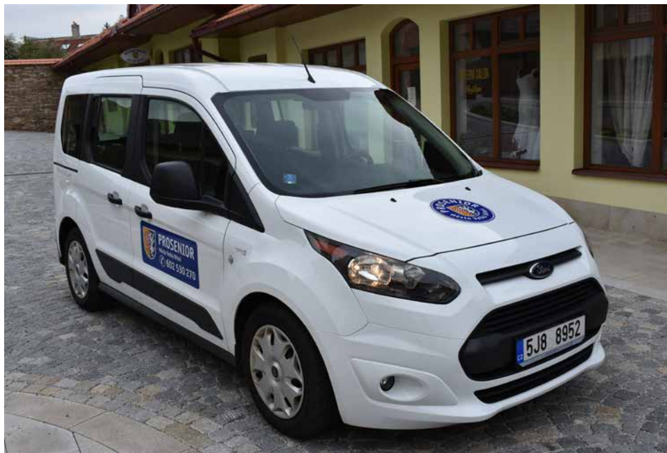
Auto Senior taxi.

K uvedenému slouží ŽÁDOST o poskytnutí služby PRO SENIOR, kterou s Vámi vyplníme v kontaktním místě: kancelář Technických služeb Velká Bíteš, Masarykovo náměstí 88, 595 01 Velká Bíteš. Vaše žádost bude obratem posouzena. Pokud splňujete podmínky pro zavedení služby, je Vám k podpisu připravena SMLOUVA O POSKYTOVÁNÍ SLUŽBY PRO SENIOR . Současně Vám vydáme i PRŮKAZKU , která Vás opravňuje k objednávání a využívání přepravy a Vy si předplatíte podle svého uvážení 5 či 10 jízd.