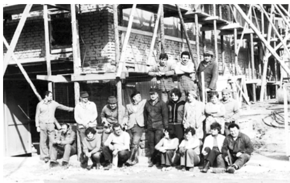
Pracovníci technologického oddělení na stavbě KD.