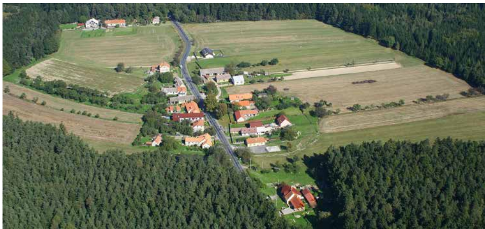
Letecký snímek Ludvíkova.

Ludvíkov je od města Velké Bíteše vzdálený 4,5 km směrem jihovýchodním a svým katastrem se dotýká hranice Jihomoravského kraje. Leží na vyvýšené rovině v nadmořské výšce 530 m n. m., při okraji rozsáhlého lesního celku, rozprostírajícího se od Jindřichova až do údolí Bílého potoka. Vesnicí prochází významná a frekventovaná silnice č. 395, vedoucí z Velké Bíteše do Rosic, kolem níž jsou domy rozloženy téměř pravidelně. Význam-