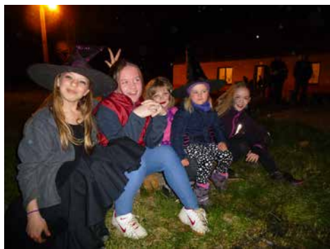
Děti při pálení čarodějnic.