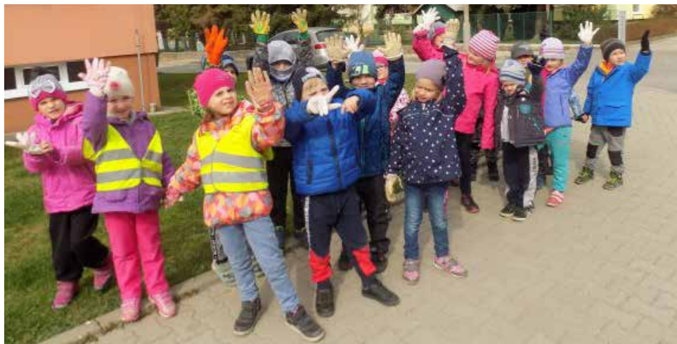
Společné foto. | Foto: Archiv MŠ

Každým rokem chodily děti z Veselé školky v rámci Dne Země do ulic, aby očistily aspoň kousek naší Země od odpadu. V letošním roce jsme se pustili do úklidu o něco dříve, protože probíhal pod záštitou akce Čistá Vysočina. Záměr byl stejný, zkulturnit a zbavit přilehlé ulice školky odpadků. Děti se na očistění prostředí kolem školky těšily. Zapojili se i rodiče, kteří dětem dali pracovní rukavice. Úlovek byl bohužel veliký, ale s dětmi věříme, že za rok najdeme odpadu méně (na zemi a více ho bude v koši).