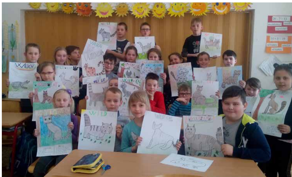
Projekt eTwinningu.

perníková vajíčka. Vyhledávali informace a tvořili prezentace na zadaná témata, která souvisela s jarní probouzející se přírodou. Dozvěděli se více o jarních a velikonočních tradicích a naučili se jarní písničky. Zabrousili i za hranice a vyzkoušeli si obdobu oblíbené velikonoční hry dětí ve Velké Británii Easter Egg Hunt. Ale především se ve skupinkách učili spolupracovat na splnění daného úkolu. Výsledky své práce si vzájemně prezentovali na společném setkání, které tento jarní projekt završilo.