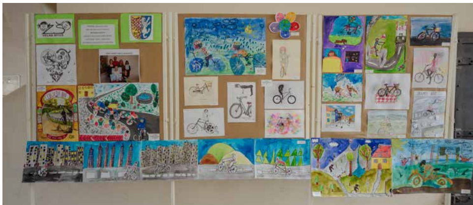
Výstava z výtvarné soutěže „Na dvou kolech“.

Po loňské premiéře byla na náměstí v prostoru startu a cíle opět umístěna velká LED obrazovka, na kterou bylo promítáno LIVE vysílání celého závodu. Diváci, kteří zavítali v krásném jarním odpoledni na Masarykovo náměstí, tak byli po celou dobu informováni o průběhu a vývoji závodu. Projekce vznikla za přispění města Velká Bíteš, pořadající TJ