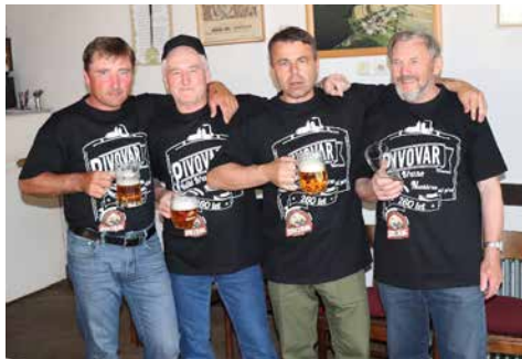
Zdravé jádro v KD.