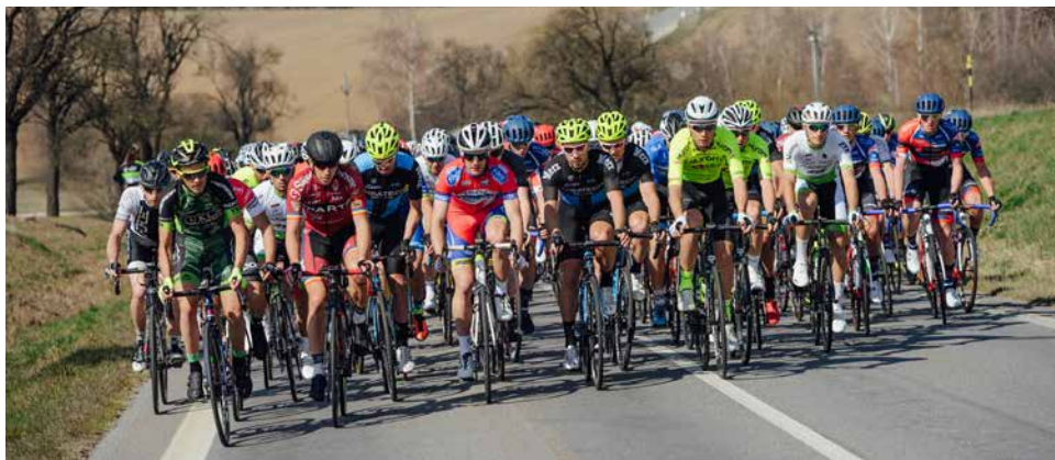
Peleton za Velkou Bíteší.

Favorit Brno, společnosti Techniserv IT, která měla na starost samotnou výrobu přenosu a specializovaným cyklistickým serverem Roadcycling.cz.