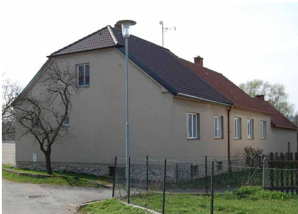
Dům čp. 23 v současnosti.

Mezi domy čp. 169 a 24 na spodní straně ulice Pod Hradbami se nacházely dva domy, které zpustly v 17. století a nebyly již obnoveny. Zatímco doba jejich zpustnutí je známa poměrně přesvědčivě přesně (1671 a 1662), jejich počátek lze pouze odhad-