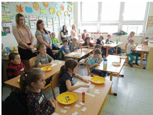
Zápis nanečisto.

Setkání pedagogů 1. stupně s rodiči a předškoláky se uskutečnilo hned čtyřikrát. Součástí odpoledního programu bylo předání základních informací o průběhu zápisu. Následovalo představení pracovních sešitů a učebnic pro děti z prvních tříd a tou hlavní částí se stala praktická ukázka zápisu. Závěr společného setkání patřil diskusi, ve které se učitelky snažily poradit rodičům, jak pomoci budoucím prvňáčkům, aby úspěšně prošli začátkem svého prvního školního roku.