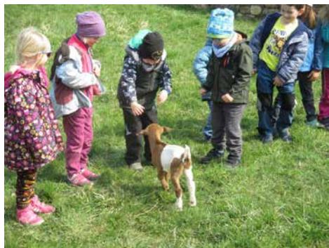
Výlet na Balinách.

A co byl pro děti největší zážitek? Malé kůzlátko, které se nejprve napilo mlíčka z láhve a potom veesele poskakovalo mezi dětmi. Dětem se výlet líbil a už teď se těší na další.