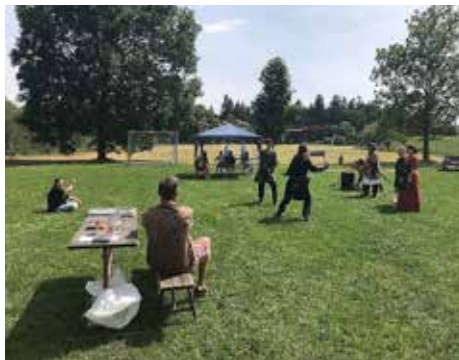
Dětský den.

Za správné odpovědi jsou připraveny sladké odměny. Nakonec dostanou všechny děti špekáček, který si ve sportovním areálu nad ohněm opečou.