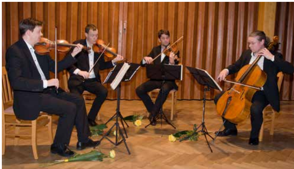
Benewitzovo kvarteto v KD.