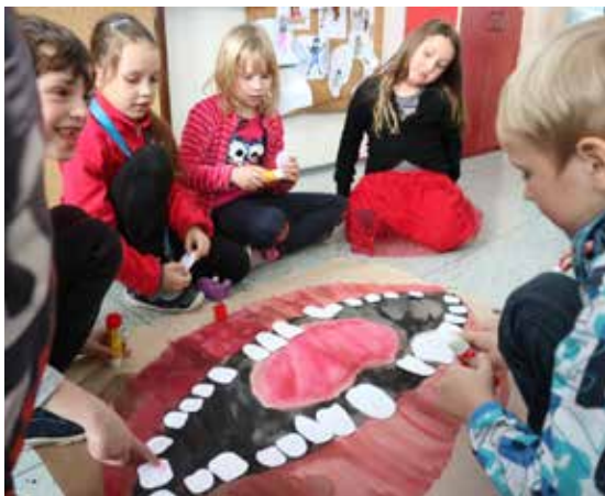
„Veselé zoubky“. | Foto: Tatána Filipová

Zoubky se čistily, malovaly, vystříhovaly, poznávaly a fotografovaly. Děti navrhovaly design kartáčků a zubních past, ale to není to nejdůležitější. Slíbily si, že se o své zoubky budou správně starat, protože nikdo jiný to za ně neudělá. Odměnou jim budou zuby bez kazů a veselý a zdravý úsměv.