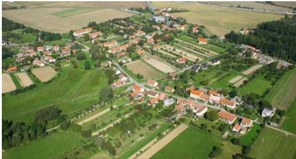
Letecký snímek Košíkova.

Původní středověký název Košíkov – psaný kolem roku 1420 jako Kossykw a v 17. století jako Koschikow – se v roce 1850 změnil na Koškov (Koschkow), tvar dodnes používaný v hovorovém jazyce. Avšak od roku 1924 je opět používán lépe znějící tvar – Košíkov. První písemnou zmínku o vesnici najdeme v latinské listině oslavanského kláštera z roku 1318. Obci dominuje románský kostelík sv. Bartoloměje, dnes částečně zastíněný průmyslovou halou.