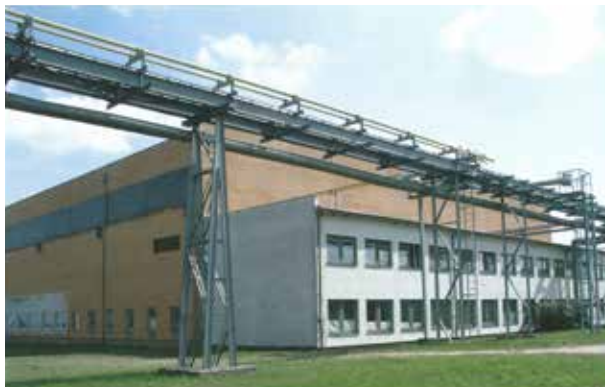
Hala turbín.

byly dány hodnotou výroby zboží 54 milionů Kčs a počtem 70 pracovníků, což krajský národní výbor odsouhlasil.