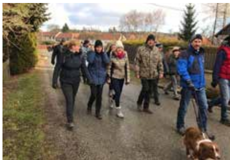
Silvestrovská vycházka.