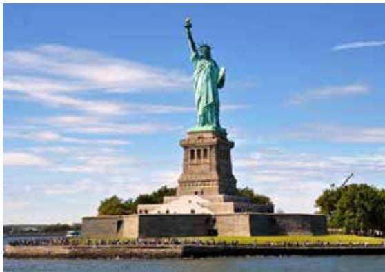
Socha Svobody.