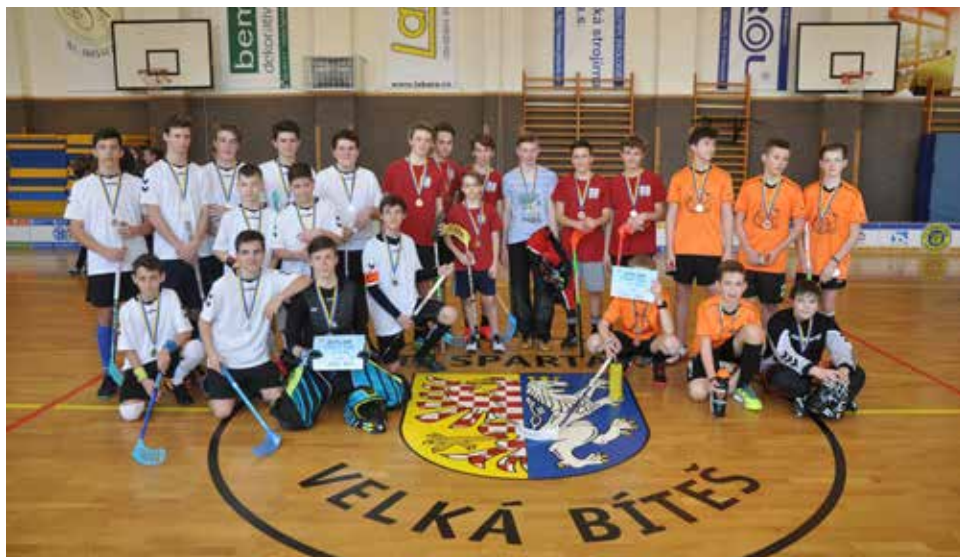
Společné foto.

Chtěli bychom poděkovat organizátorům TJ Spartak Velká Bíteš a všem zúčastněným týmům za skvělý turnaj a budeme se těšit zase příští rok.