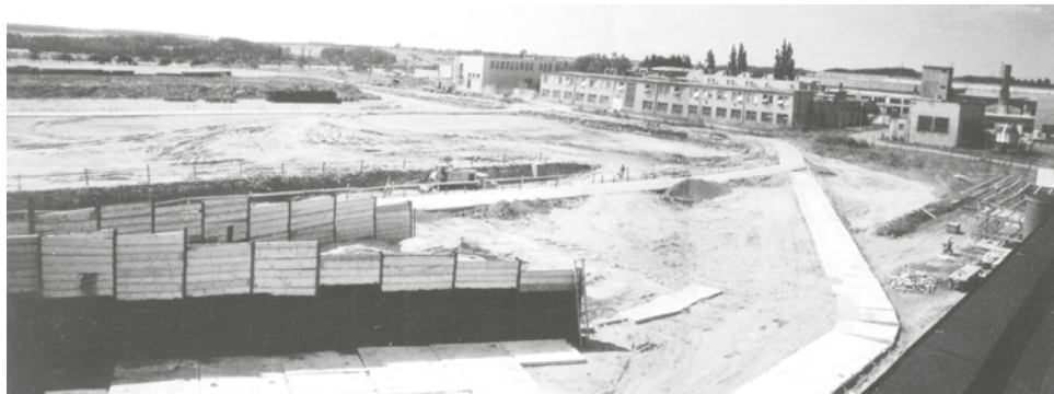
Pohled ze střechy slévárny na pozemky, na kterých nyní stojí hala speciální techniky a hala turbín.

Do nové haly byly přemístěny některé obráběcí stroje z našeho stávajícího provozu turbín a také z brněnského ZTU. V nových prostorách byl také zkušební stav pro již zmíněné parní turbíny, pro nízkoteplotní expanzní turbíny i pro dekantální odstředivky. Pro konečné úpravy výrobků byl určen moderní sříkací box s odsáváním.