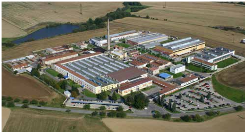
Letecký snímek závodu – v pravém horním rohu je hala speciální techniky a hala turbín (zprava).

V souvislosti s dlouhodobým plánem zajištění speciální výroby byl v roce 1981 vypracován investiční záměr na další rozšíření speciální výroby o kapacitu 70 milionů Kčs ve výrobě zboží, s předpokládaným nárůstem 70 pracovníků. Rozpočtové náklady byly stanoveny na 55,2 milionů Kčs, z čehož 24,2 milionů Kčs činily stavební práce. Akce byla určena jako závazný úkol státního plánu. Úvodní projekt byl schválen v červnu roku 1984 a stavební firma Pozemní stavby Brno, závod Jihlava ji dokončila v roce 1986 .