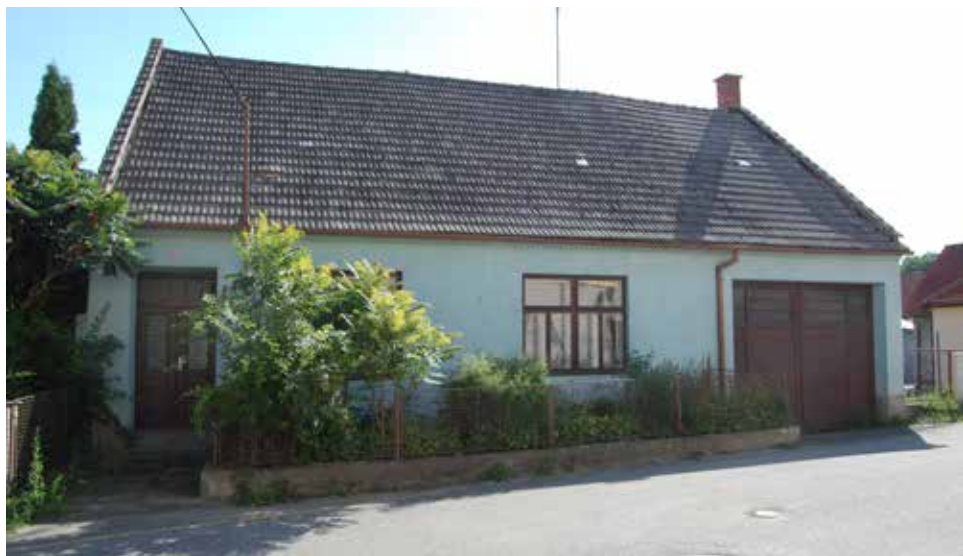
Dům čp. 202 nedlouho před zbouráním v roce 2012. | Foto: Archiv autora

Seriál o domech a jejich majitelích na náměstí, v ulicích i na předměstích Velké Bíteše zabývající se dobou (již) před polovinou 20. století. Nyní ulice POD HRADBAMI , zaniklé čp. 202: