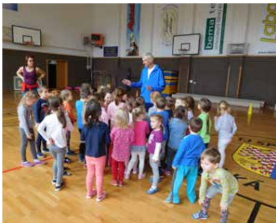
Děti ve sportovní hale TJ.