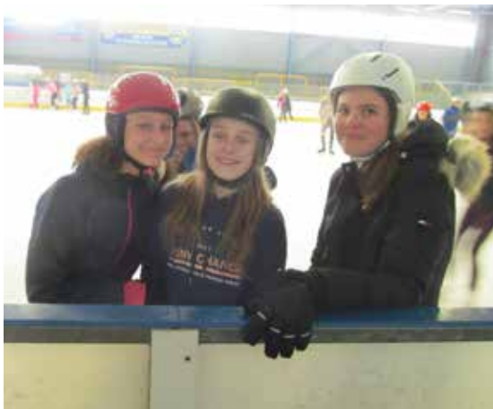
Bruslení v rámci TV.

Žáci 1. i 2. stupně v rámci hodin tělesné výchovy aktivně využívají po celou zimu ledovou plochu Zimního stadionu ve Velké Bíteši. Tento druh pohybové aktivity je u žáků velmi oblíbený. Proti nebezpečí úrazu jsou bruslaři povinně vybaveni ochrannými prvky – helmou a rukavicemi. Děti se učí bruslit, ale také rozvíjí svou manuální zručnost a ochotu vzájemné pomoci při zavazování bruslí. Zdatnější bruslaři na ledové ploše trénují i hokejistické dovednosti.