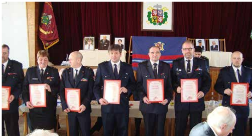
Sestra a bratři hasiči ocenění čestným uznáním.