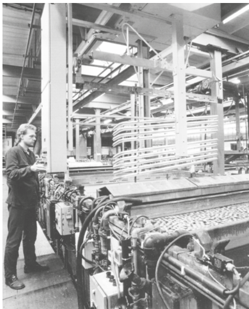
Eloxovací linka.

U řady součástí plnicích turbodmychadel a zejména u přístrojů klimatizace pro letoun L 39 byly předepsány náročné povrchové úpravy, jako chromování, eloxování, cínování aj. Zajišťování těchto úprav formou kooperace přinášelo značné problémy s dodržováním termínů. Proto bylo rozhodnuto postavit si vlastní dílnu povrchových úprav.