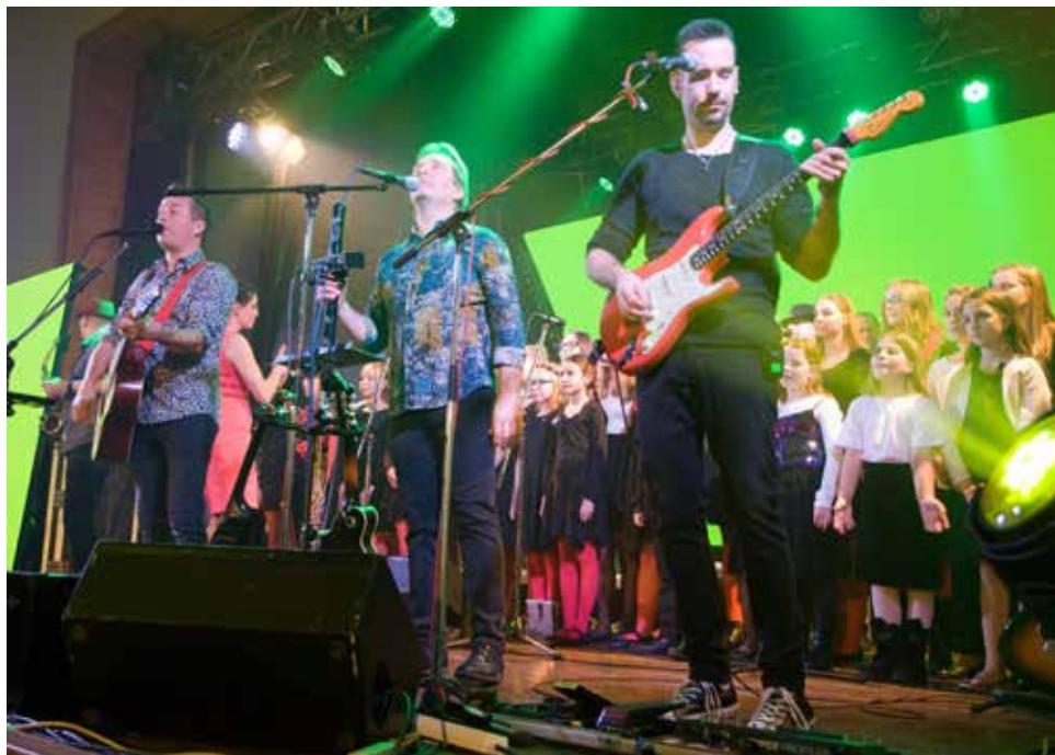
Z koncertu.

V nezměněné sestavě se představil Petrův „band“ a nechyběla ani Cimbálová muzika Gromba, která program obohatila o lidovou složku. CM Gromba si připravila pro diváky také malé překvapení v podobě tanečnice Terezky.