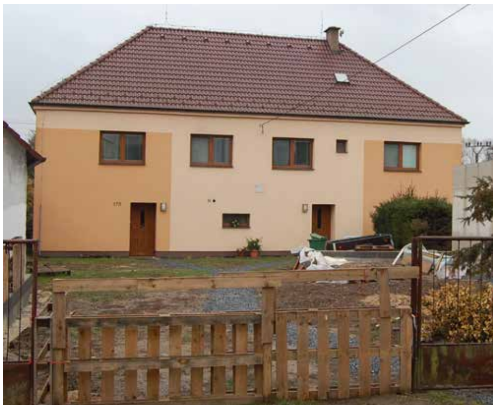
Dům čp. 170 v současnosti.

Seiál o domech a jejich majitelích na náměstí, v ulicích i na předměstích Velké Bíteše zabývající se dobou (již) před polovinou 20. století. Nyní ulice POD HRADBAMI , čp. 170: