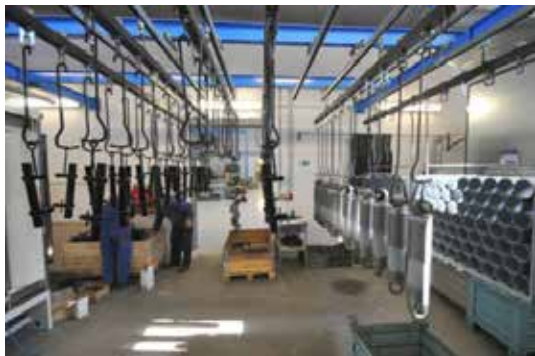
Výroba hydraulických tlumičů.

Výroba v oslavanském závodě se postupně stabilizovala a jeho pracovníci, jak v technickém úseku, tak zejména ve výrobě, byli schopni plnit stále náročnější úkoly. Proto byla do Oslavan v roce 1983 převedena sériová výroba hydraulických tlumičů pro drážní lokomotivy z plzeňské Škodovky. Později byla výroba tlumičů rozšířena také pro lokomotivy z ČKD Praha, z Tatry Studénka a pro sklad náhradních dílů Československých státních drah. Výroba se postupně zvyšovala až na 15 000 ks za rok. V roce 1984 činil objem výroby dmychadel v závodě Oslavany v peněžním vyjádření 27 milionů Kčs a objem výroby tlumičů 21 milionů Kčs.