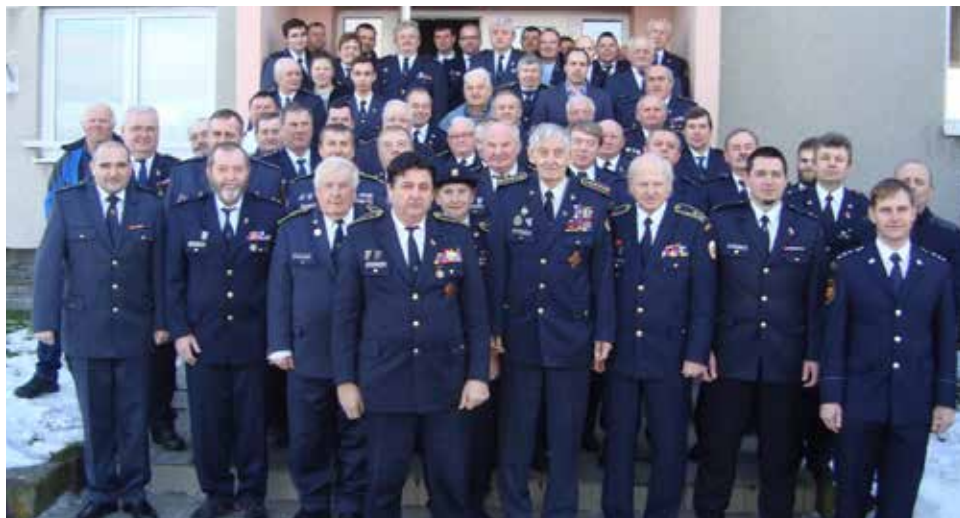
Účastníci valné hromady před KD v Katově.