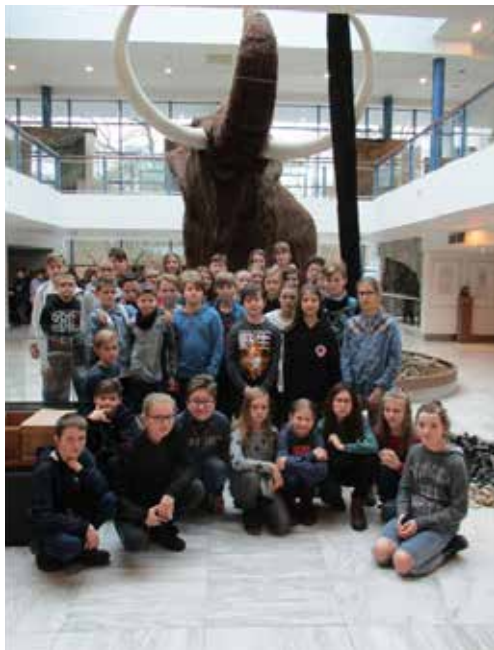
Návštěva v Anthroposu.

Brna. První zastávkou bylo planetárium. Povídání o zimní obloze a hvězdách bylo velmi zajímavé a názorné. Uměle vytvořená noční obloha plná souhvězdí byla okouzlující.