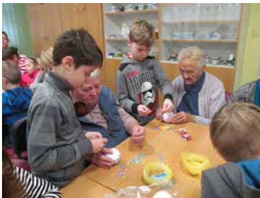
Setkání se seniory.

12. prosince 2018 se žáci ze 2. A vydali potěšit seniory v Domě s pečovatelskou službou ve Velké Bíteši. Obě generace si příjemně užily společně strávený čas při tvoření ozdob na vánoční stromeček. Také dárečky, které si děti vyrobily ve školní družině, putovaly do Domova důchodců, aby jeho obyvatelům zkrášlily jejich dny v čase vánočním.