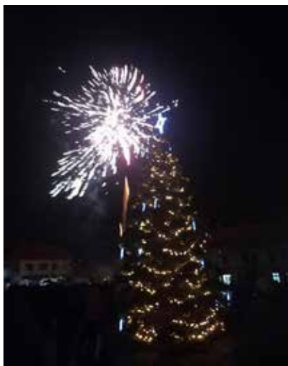
„Ohňostroj“.