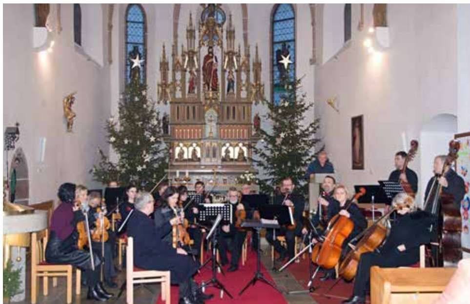
Z koncertu.