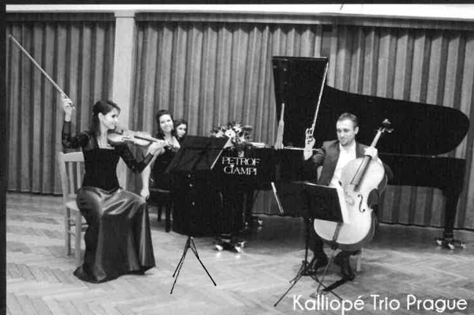
Kalliópé Trio Prague