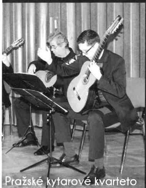
Pražské kytarové kvarteto