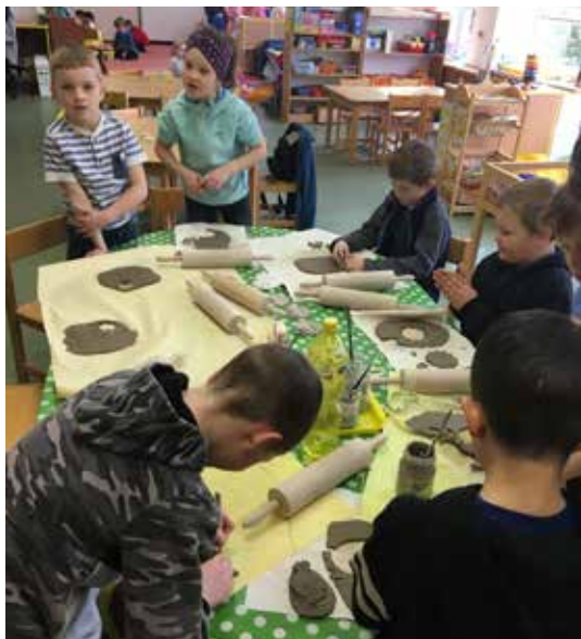
Tvořivá práce.

Spolupráce mezi Veselou školkou a Základní školou ve Velké Bíteši probíhá dlouhodobě. Děti ze školy chodí do školky ukázat svoje aktovky a školní vybavení. Předškolní děti navštěvují školu, aby se adaptovaly na nové prostředí a přechod v září byl plynulejší. V měsíci březnu jsme spolupráci spojili se zábavou a tvořením. Děti ze školy se do školky přišly podívat na nové hračky, ale hlavně si přišly vyrobit keramiku s jarní tematikou. Pod rukama školáků vznikly překrásné výtvořky. Po společném zazpívání lidových písní se děti vrátily zpět do školy.