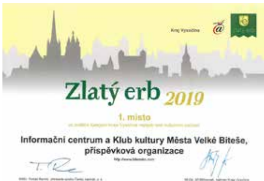
Ocenění „Zlatý erb 2019“.