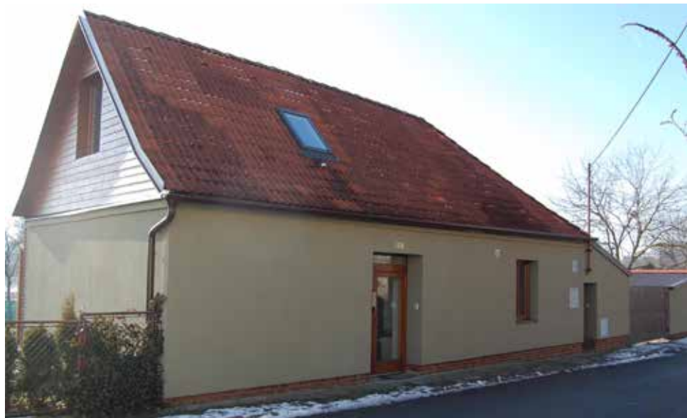
Dům čp. 169 v současnosti.

Další z „chalup na bahně pod městem“ (1776) v roce 1594 držela Otcovská. Roku 1611 Václav Otcovský prodal dům „ pode zdí [pod hradbami] podle gruntu Havla Špalka [již zaniklý dům] z jedné strany Pavlovi Tesařovi Němci “ za cenu 50 zlatých. Přitom bylo vymíněno, aby „ Pavel Novoměstskéj k vodě choditi mohl jako kdy předešle “. Toto věcné břemeno vzniklo tak, že roku 1598 Václav Otcovský prodal ševci Pavlu Novoměstskému (Lánice 57) za 9 zlatých „ dílny, kteráž jest při gruntu jeho “. Roku 1616 Václav Otcovský prodal Pavlovi Tesařovi svou pohledávku na domě 10 zlatých za 3,5 zlatého. Později roku 1670 Jan Rovenský na místě své manželky prodal Martinu Porupkovi pohledávku na domě, kterou zdědila po svém otci, 20 moravských zlatých za 3 rýnské zlaté. A roku 1677 bylo dopsáno, že „ cožkoliv tu na zvrchu jmenovaném krunť Václavovi Porupkovi po nebožtíkovi Václavovi Otcovským jakožto otčímovi jeho patřilo, to vše Martinovi Porupkovi a budoucím jeho k vlastnímu užívání odevzdává “. V roce 1690 byl dům zmíněn jako poustka po Ondřeji Tesařovi a držel ji již zmíněný Martin Porupka (náměstí 82).