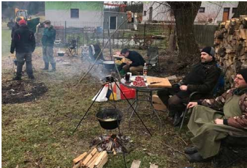
Soutěžní družstva u ohýnky.

Členové SDH pořádají také zabíjačkové hody , které jsou však jejich soukromou akcí a odměnou za celoroční dobrovolnou práci.