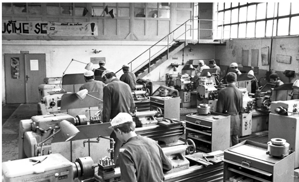
Učňovská dílna soustružníků v 70-tých letech.

Bíteši, praktická výuka probíhla ve vlastních, nově zřízených učňovských dílnách. V každém ročníku se učilo nejdříve 40 učňů, později 50 až 60 učňů. Do roku 1990 prošlo našim učňovským střediskem 1280 vyučenců. O výuku se staralo 7 mistrů a učitelů pod vedením Ludvíka Tučka. V našem učňovském zařízení jsme později zaškolovali také pracovníky pro závod Oslavany a závod Mikulov.