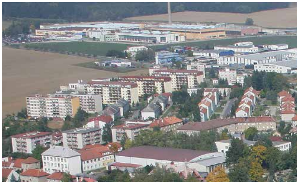
Podniková výstavba.

byty byl předán do užívání v roce 1971 . Další tři obytné domy s 18-ti podnikovými byty byly postaveny v letech 1972 až 1976 . Pro vytápění byla postavena kotelna na hnědé uhlí. Technologické zařízení kotelny a rozvodů tepla zajišťoval náš závod.