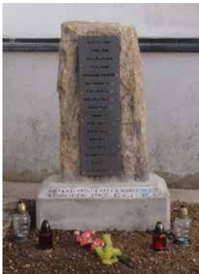
Pomník padlých ve Březí.

z nejstarších usedlostí v Březí – dříve dvůr – dnes č.p. 40.