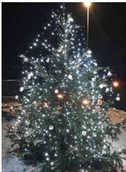
Rozsvícený vánoční stromek.