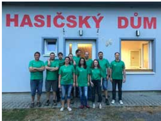
Realizační pouťový tým.

Tato událost, pravidelně se opakující již po mnoho generací, je největší a nejdůležitější společenskou akcí ve vesnici, známou v širokém okolí. Pout' se koná vždy v neděli blízké svátku sv. Bartoloměje, který připadá na 24. srpna. Tomu světcí je také zasvěcen místní kostelík spadající pod správu bítešské farnosti, ve kterém bývá sloužena slavnostní mše svatá. Pout' provázejí tři taneční zábavy. Páteční – „pro mladé“, sobotní – pro všechny