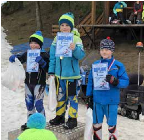
Reprezentace školy na lyžařském přeboru.

Od 13.–20. února 2019 probíhal lyžařský výcvikový kurz pro žáky ze 7. a 5. ročníků na Fajtově kopci ve Velkém Meziříčí pod vedením instruktorů – pedagogů. Žáci byli rozděleni do čtyř skupin podle svých lyžařských schopností. Podle pokynů instruktorů pak zlepšovali své dovednosti (jízdu v pluhu, zastavení, otáčení, výstupy, carvingové oblouky, slalom, jízdu ve dvojici, na vleku, ale taky volné tréninkové jízdy). Sněhové podmínky i počasí lyžařům přály.