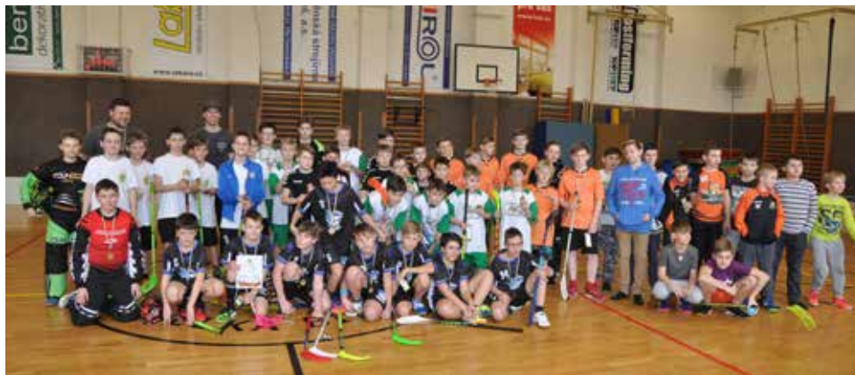
Společné foto. | Foto: Otto Hasoň

Jak již bývá zvykem, čím více bylo odehráno zápasů, tím více se hráči snažili co nejlépe vyhrát a získat vytouženou trofej. Turnaj přinesl mnoho vyrovnaných zápasů a o konečném pořadí nebylo rozhodnuto do posledního zápasu. Nejblíže k zisku prvního místa měli florbalisté Rosic, kteří celý turnaj předváděli vyrovnané výkony a až na jednu remízu všechny své zápasy vyhráli. To jim stačilo k zisku vytouženého 1. místa. Druhé místo obsadili po výhře v posledním zápase florbalisté Zbraslavi, kteří porazili celkově 3. mužstvo z Říčana. Pořadí na dalších místech bylo následující: 4. Ivančice, 5. Velká Bíteš, 6. Dolní Kounice, 7. Vysoké Popovice.