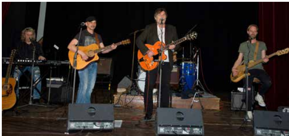
Kamelot na bítešském pódium.