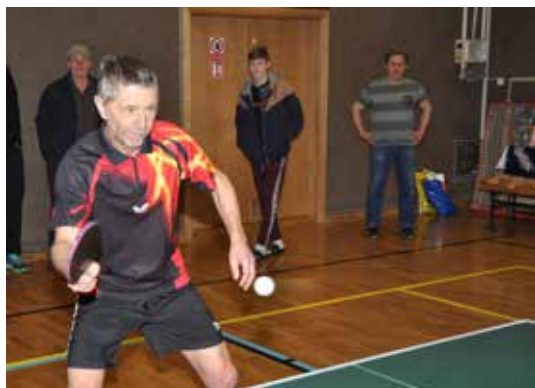
Z loňského turnaje.