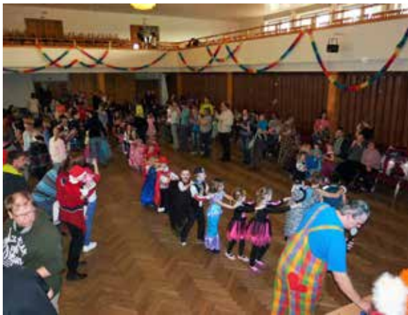
Z karnevalu. | Foto: Silvie Kotačková

rytíře, indiány, čaroděje, Spidermana, Kašpárka a nespočet princezen. Pro malé návštěvníky byla připravena také bohatá tombola. Děti v ní mohly vyhrát nejen různé sladkosti, ale i hračky.