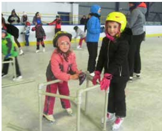
Prvňáčci na bruslení.

Ve čtvrtek 14. 3. a v pondělí 18. 3. 2019 se v MŠ Lánice uskutečnilo v odpoledních hodinách setkání rodičů a předškolních dětí s pedagogy z 1. stupně ZŠ. Rodiče byli seznámeni se základními informacemi o průběhu zápisu do základní školy. Děti si během „zápisu nanečisto“ vyzkoušely nejrůznější grafomotorická cvičení, správný úchop psacího náčiní, orientaci v ploše, rozlišování geometrických tvarů, barev, počítání prvků do deseti a kresbu postavy. Rodičům byly představeny učebnice a pracovní listy pro děti prvních tříd, které budou využívat během předslabikářového období. Byly zodpovězeny četné dotazy rodičů a paní učitelky se snažily během diskuze poradit rodičům, jak pomoci budoucím prvňáčkům, aby úspěšně prošli začátkem svého prvního školního roku.