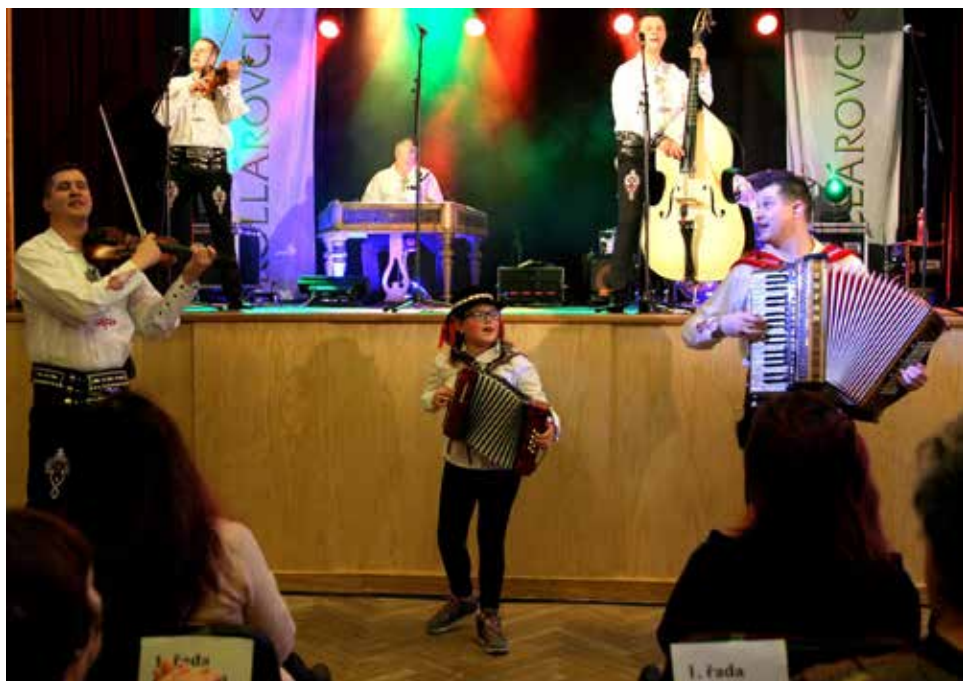
Kollárovci v sále KD.

Pro české publikum si připravili a diváci si mohli v jejich podání poslechnout také známé české polky nebo hudbu písně „Lady Carneval“. Pestré bylo také nástrojové obsazení