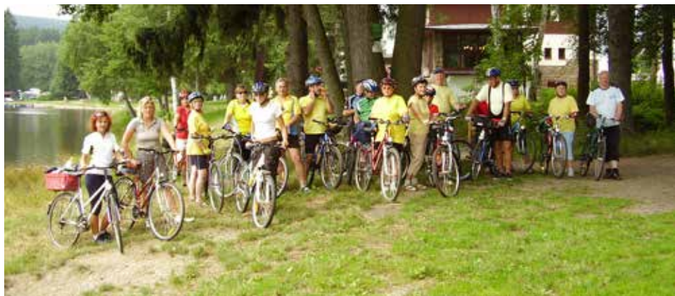
Společné foto z výletu.

Kdo to povede? Zkušených vůdců jsme vychovali více. Tak na střídačku, ale trochu kázně být musí. Já se občas přijdu na sraz podívat, s hůlkou. Ale budu rád, když se někdo po výletu staví a povykládá, abych z toho také něco měl. Přeji hodně hezkých prožitků na vašich výletech.