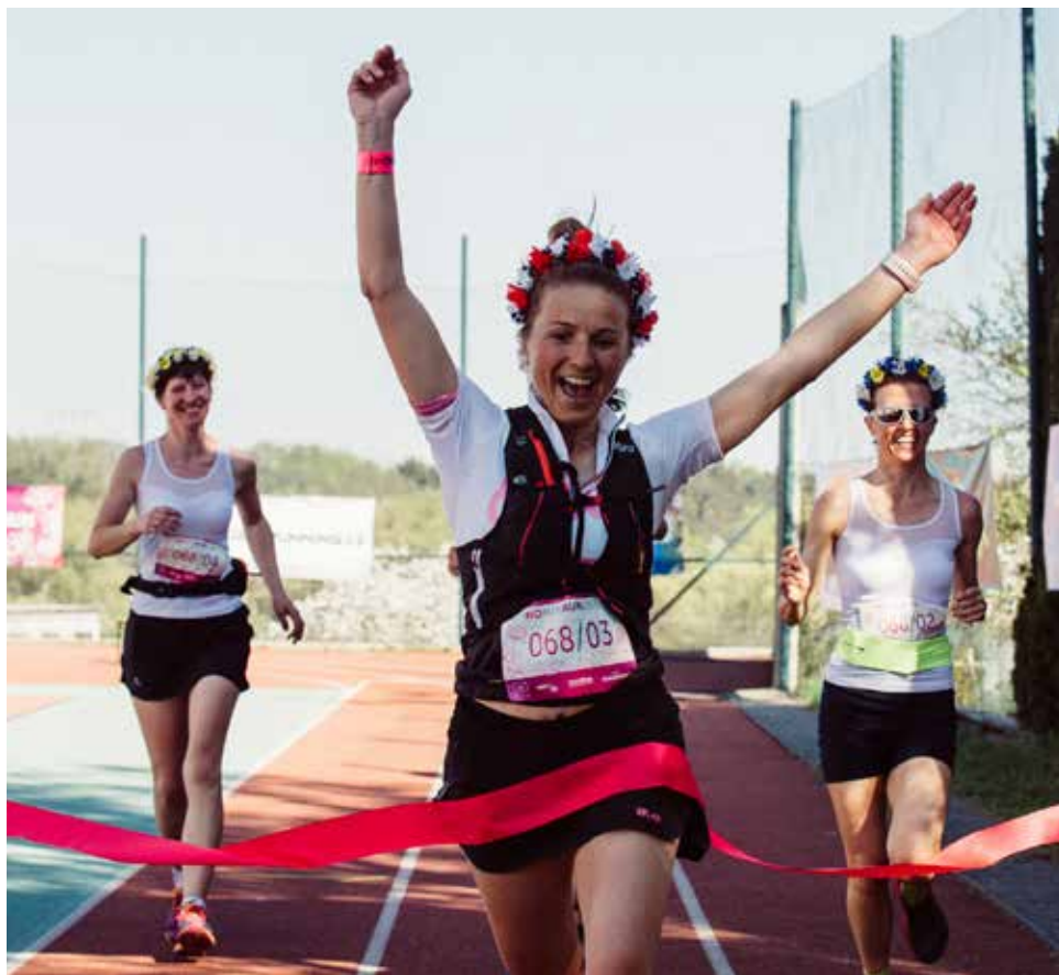
V cíli.

jeden tým může mít až čtyři členky. „Ale každoročně máme na startu i holky, co těch 88 kilometrů běží sólo nebo ve dvou“, upřesňuje Květa.