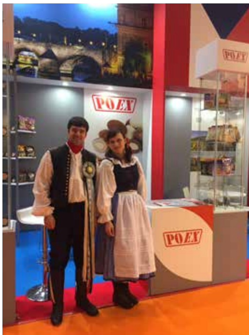
Prezentace v Tokiu.