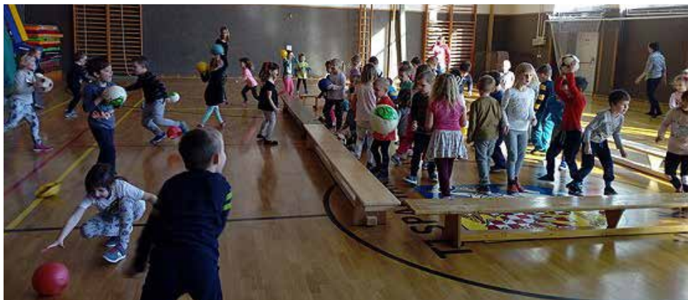
Sportovní den.

Organizátorům bychom chtěli touto cestou poděkovat za příjemná dopoledne. Vládla zde skvělá soutěžní atmosféra, což dosvědčovaly úžasné sportovní výkony a zářící oči dětí! Za sportovními dny můžeme už jen 3x zvolat SPORTU ZDAR a těšit se na příští setkání!