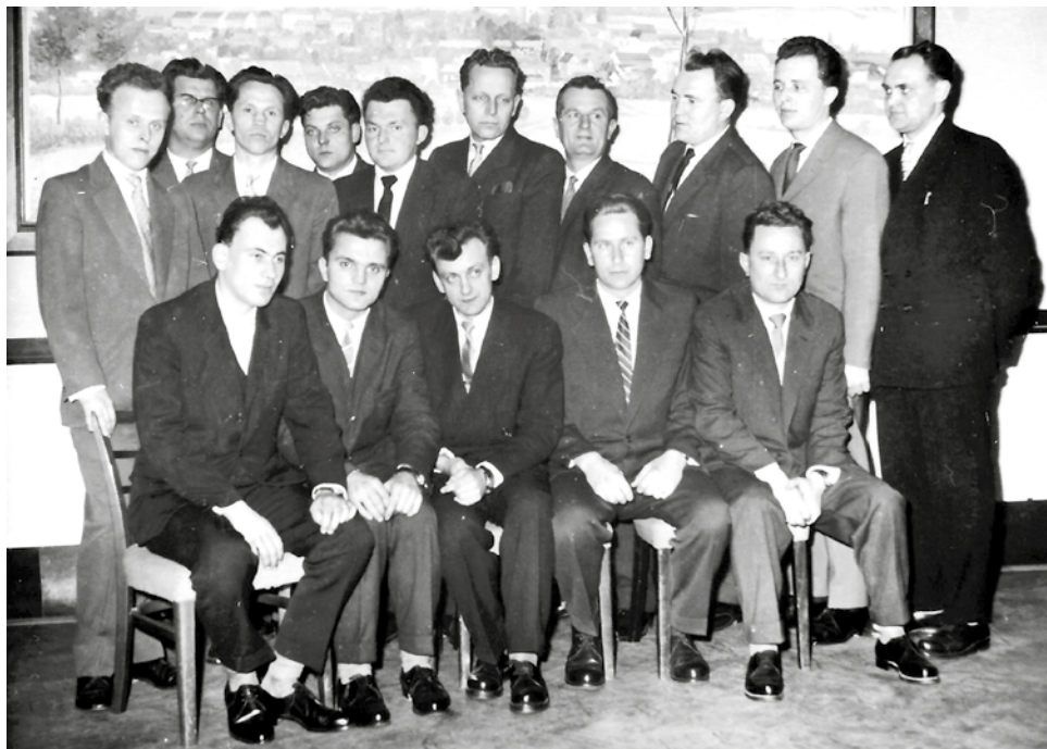
První maturanti z roku z r. 1964.

Ti nejzdatnější také na Vysokém učení technickém v Brně, kde však při náročném, 6 let trvajícím studiu, byla „úmrtnost“ neúměrně vysoká. Umožněno bylo také studium vědecké aspirantury (titul CSc.) většinou na VUT v Brně. Všechny tyto typy studia závod podporoval udílením studijního volna.