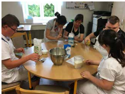
Z praktické výuky.

Základní škola Velká Bíteš, Tišnovská 116 má od začátku září tohoto roku nový název – Základní škola a Praktická škola Velká Bíteš, příspěvková organizace . Důvodem této změny bylo otevření nového oboru střední školy Praktická škola jednoletá 78-62-C/01. Tento obor mohou navštěvovat žáci s těžkým zdravotním postižením, zejména s těžkým stupněm mentálního postižení, žáci s více vadami a žáci s poruchami autistického spektra, kteří ukončili docházku na základní škole speciální nebo základní škole.