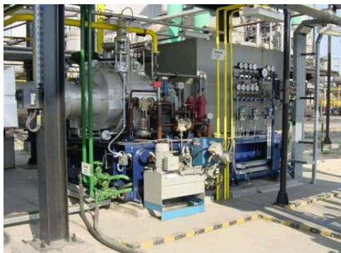
Expanzní turbína ETG pro Maďarsko.

a radiálního kompresoru jsou uložena na společném hřídeli. Kompresor bývá zařazen do výrobního procesu nebo může pracovat v samostatném okruhu. Regulace průtočného množství se provádí buď výměnou rozváděcích lopatek turbíny nebo jejich natáčením.