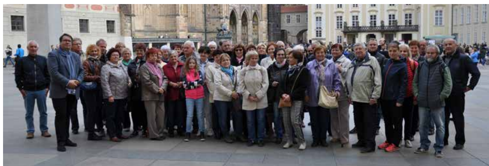
Společné foto na 3. nádvoří Pražského hradu.

Pracovníci Informačního centra a Klubu kultury ve spolupráci s Městským muzeem ve Velké Bíteši uspořádali v sobotu 20. října při příležitosti 100. výročí vzniku Československé republiky zájezd do našeho hlavního města, úzce zaměřený na prohlídku Pražského hradu.