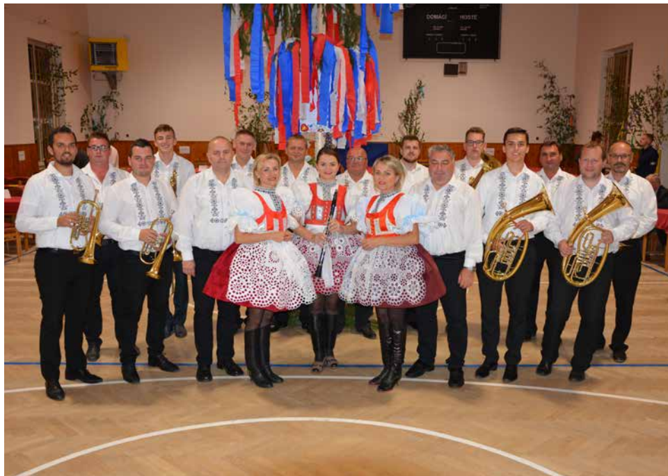
DH Miločanka.

V pátek 7. prosince v 19.00 hodin se v sále kulturního domu uskuteční Vánoční koncert dechové hudby „Miločanka“. Dechová hudba z Milotic u Kyjova v roce 2016 „znovuoobnovila“ své působení mezi slováckými dechovými hudbami působícími na kyjovském