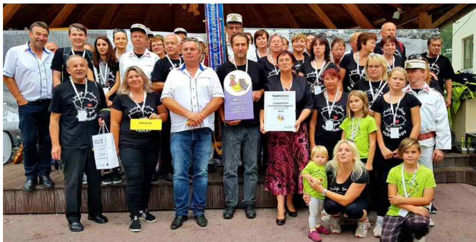
Společné foto výpravy z Heřmanova.