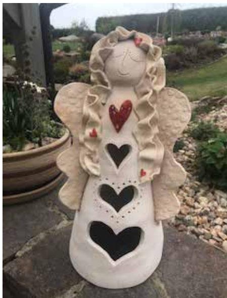
Keramický anděl.