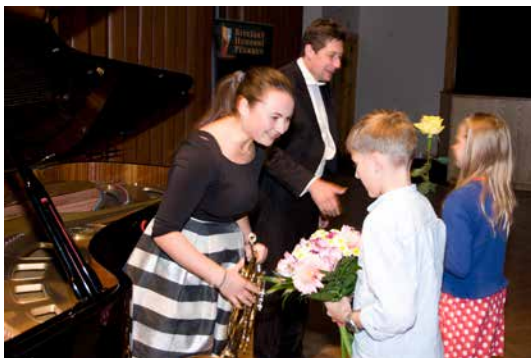
„Děkovačka.“