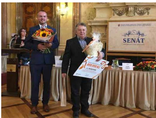
Slavnostní předání ceny.

Děkuji všem občanům, kteří se podíleli na přípravě a průběhu prezentace obce v soutěži. Vše dělali ve svém volném čase a mají velký podíl na získaném ocenění.