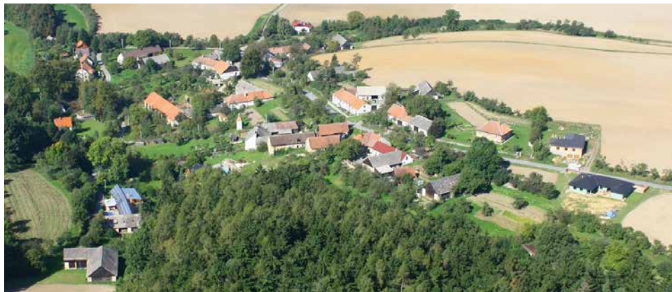
Letecký snímek Jestřabí.

Jestřabí je druhou nejbližší „místní částí“ města Velké Bíteše, od kterého je vzdálená 3 km směrem jihozápadním. Nachází se v těsném sousedství Jindřichova, na svahu pahorku v kotlině mezi lesy, v nadmořské výšce cca 470 m n.m. Původní selská stavení jsou nepravidelně rozmístěná na svahu obráceném k jihu, který přechází do mělkého údolí s potokem a rybníkem. Ze severu a západu jsou domy chráněny lesem. S Jindřichovem pojí Jestřabí také dřívější společné začlenění v sousedních obcích Jasenici (2,2 km jihozápadně) a později v Březce (2,6 km severozápadně). S Jasenicí spojuje vesnici Jestřabský potok, vlévající se pod Jestřabím do Jasinky .