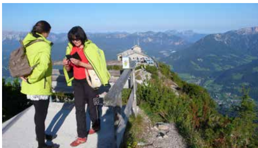
Na Hitlerově orlím hnízdu.

vážní řidiči nás vyvezli krkolomnou, v horských svazích vylámanou, cestou nahoru. Prošli jsme vlhkým tunelem a vyjeli proslulým „zlatým“ (ve skutečnosti mosazným) hitlerovým výtahem nahoru. Nádherné počasí nám umožnilo překrásný výhled na celý národní park. Po nekonečném fotografování a „kochání se“ jsme sjeli dolů na parkoviště. Ještě jsme se prošli kolem půvabného jezera Königsee, prohlédli si městečko Berchtesgaden a unaveni, avšak spokojeni jsme odjeli zpět do rakouského Tyrolska.