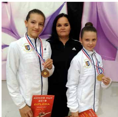
Společné foto s trenérkou.