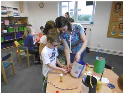
Tvořivé dílny.