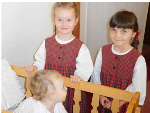
Z vítání občánek.

V sobotu 13. října 2018 bylo v obřadní síni města Velká Bíteš přivítáno do života téměř 40 malých dětí. Tuto krásnou slavnost připravila matrikářka města spolu s panem starostou a Sborem pro občanské záležitosti. Přivítat malé děti přišly i dvě holčičky z národopisného kroužku Bítešánek. Po úvodních slovech paní Janštové se obřadní síní nesl zpěv ukolébavky Spi děťátko, spi a po ní následovala líbivá básnička pro rodiče a jejich malé děti. Holčičky byly za své vystoupení odměněny velkou pochvalou od pana starosty a paní matrikářky, sladká odměna a kytka samozřejmě nemohla chybět.