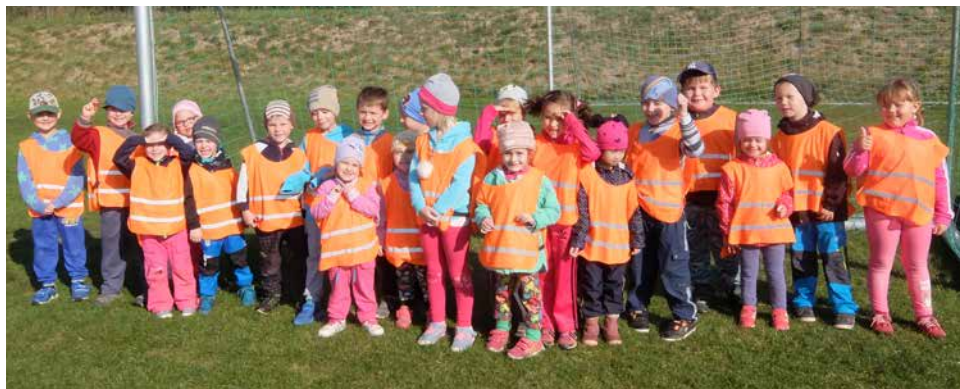
Třída Motýlci na Sportovním dni. | Foto: Tesařová Milada

Ve čtvrtek 11. října 2018 se třídy Motýlci, Sluníčka, Sovičky a Včeličky vydaly na fotbalový stadion, kde na ně čekaly sportovní aktivity pod vedením trenéra Vítězslava Kratochvíle.