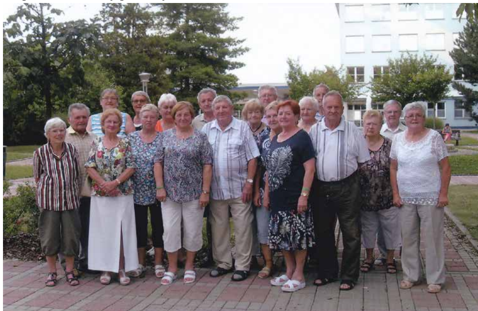
Společné foto z rekondičního pobytu.

Květen bývá vyhrazen pro přednášku a besedu s MUDr. Svatoplukem Horkem, který nás tentokrát seznámil s nebezpečím zdravotního rizika o dovolených. Informoval nás o riziku cestování, úrazů, přehřátí organismu, infekcí, chorobách srdce, alergie, nezdravého stravování a cukrovky. Zmínil se také o možnosti očkování proti chřipce. Na závěr zodpovídal na otázky přítomných.