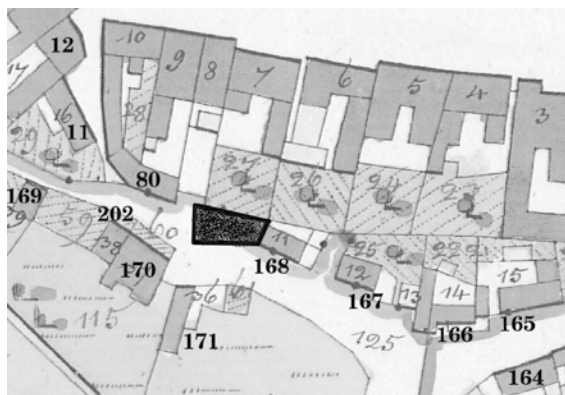
Předpokládaný rozsah domovní parcely zaniklého domu pod hradbami. Zakresleno černě do mapy stabilního katastru z roku 1825.

Seriál o domech a jejich majitelích na náměstí, v ulicích i na předměstích Velké Bíteše zabývající se dobou (již) před polovinou 20. století. Nyní ulice POD HRADBAMI , zaniklý dům pod čp. 7: