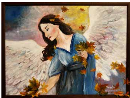
Obraz „Anděl“ R. Wimmerové.

Své organizační schopnosti zúročila v realizaci více než dvaceti výstav, převážně na Vysočině. Témata jejich obrazů jsou různého žánru – maluje krajiny, zátiší, kytice, ale také velkoformátové obrazy k modelovým kolejištům. Největší dílo můžeme spatřit ve Žďáře nad Sázavou v Modelovém království, kde namalovala 40 metrové pozadí podle věrné skutečnosti. V současné době žije svůj splněný sen. Vlastní Ateliér