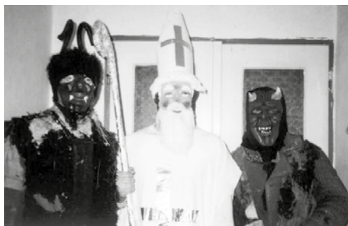
Čerti s Mikulášem.

Letos si děti připravily mnoho pěkných básniček, a proto, jako každoročně, čerti do pekla nikoho neodnesli a naopak Mikuláš rozdál mnoho dárků.