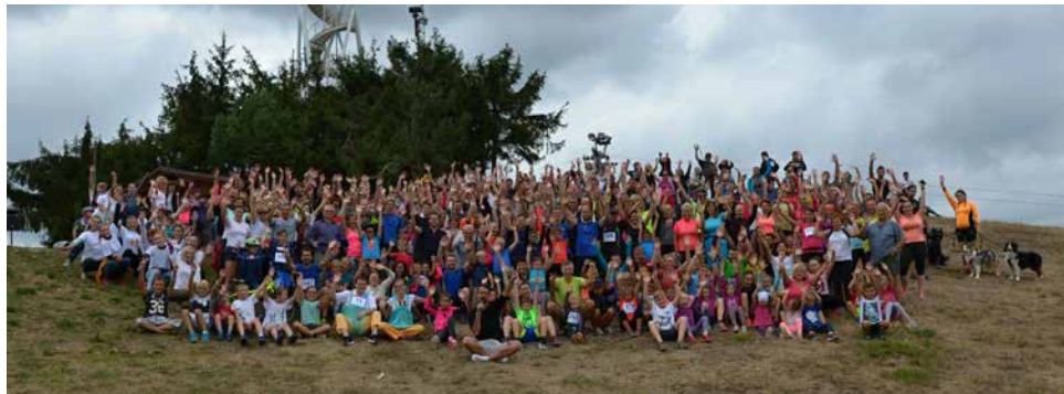
Společné foto účastníků.

Před třetí hodinou rozpohybovala všechny zúčastněné Veronika Čamková, patronka běhu a mistryně v alpském lyžování. Po rozsvícení proběhlo skupinové focení běžců