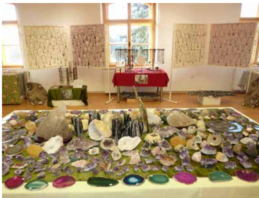
Z výstavy v roce 2016.