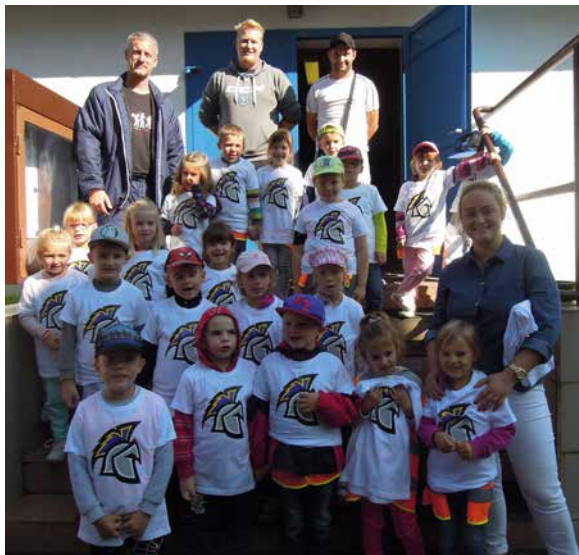
Společné foto z návštěvy. | Foto: Archiv MŠ

chvilku, ale za ten zážitek to rozhodně stálo.