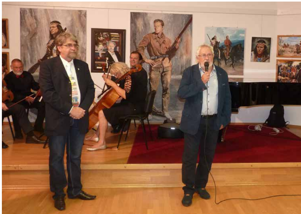
Z vernisáže.