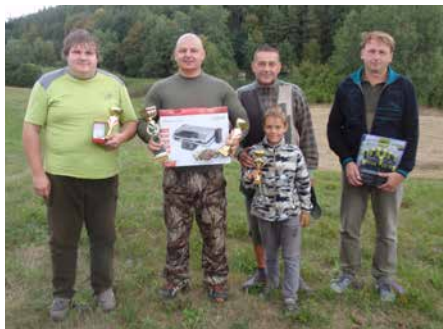
Společné foto oceněných.