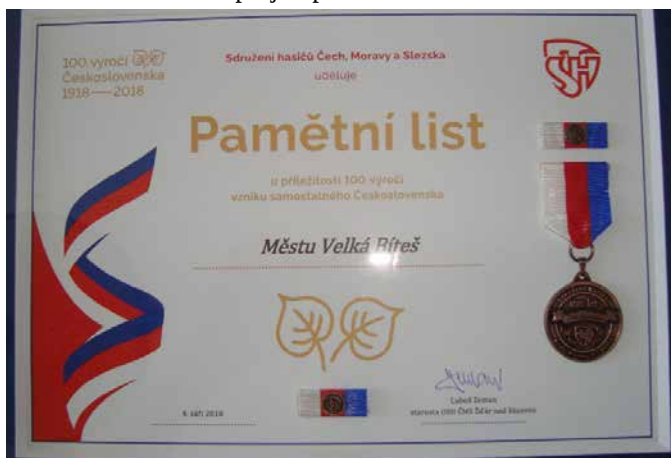
Pamětní stuha na prapuru města a pamětní list městu Velká Bíteš.