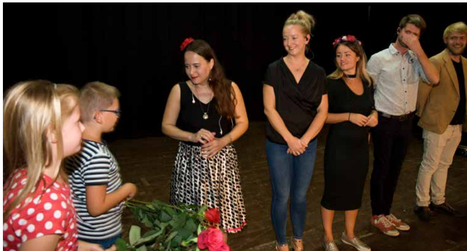
„Děkovačka“ po koncertu.

Naprosto bezchybná intonace, často velmi obtížné rytmické změny a celková kompaktnost tělesa působí tak lehce a samozřejmě, že člověk bez problémů podlehne klamnému dojmu o snadnosti jejich počínání. Avšak právě toto je známkou nejvyšší kvality.