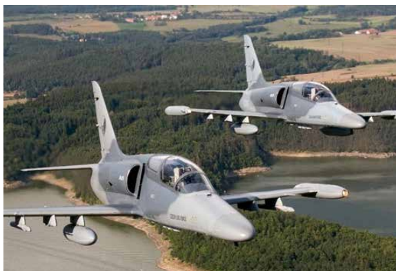
Letouny L 159, modernější verze původních L 59.

austenitickou chromniklovou ocelí. Pro zkoušky přístrojů byly zhotoveny nové zkušební stavy s kvalitnějším potrubím z chromniklové oceli.