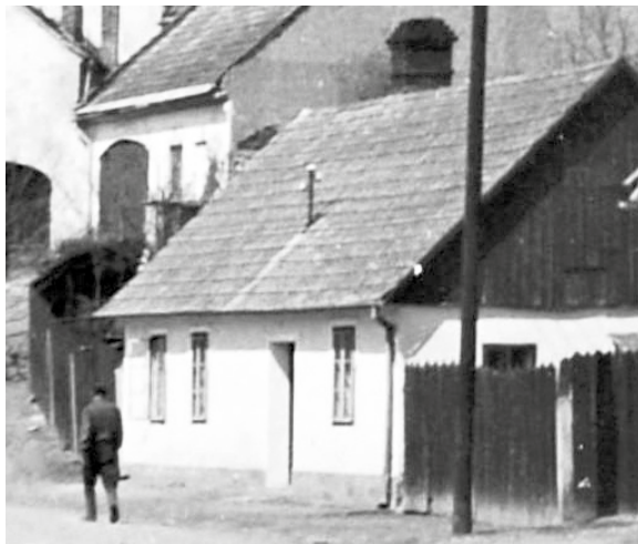
Již zaniklý dům čp. 168 Pod Hradbami v roce 1969.

Až roku 1788, tedy po více než půldruhém století zpuštění domu, Josef Bartošek „na uctívou žádost od počestný obci zakoupil v Růžové ulici obecní plac k vystavení domu sousedskýho i s pustým pastviskem ležící u Hadrů, níž ale zahrada, za sumu trhovou 10 zlatých do obecní kasy patříci [...] Pročež se jemu Josefovi Bartoškovi tento zpustlý plac a ta zahrada k jeho domu patříci jakožto sousedský grunt právně a jeho dědicové právně za vlastní přepisuje, a to sice 5 sáhů zdýli a 3 sáhy šířky [tj. 9,5 x 5,7 m]“.