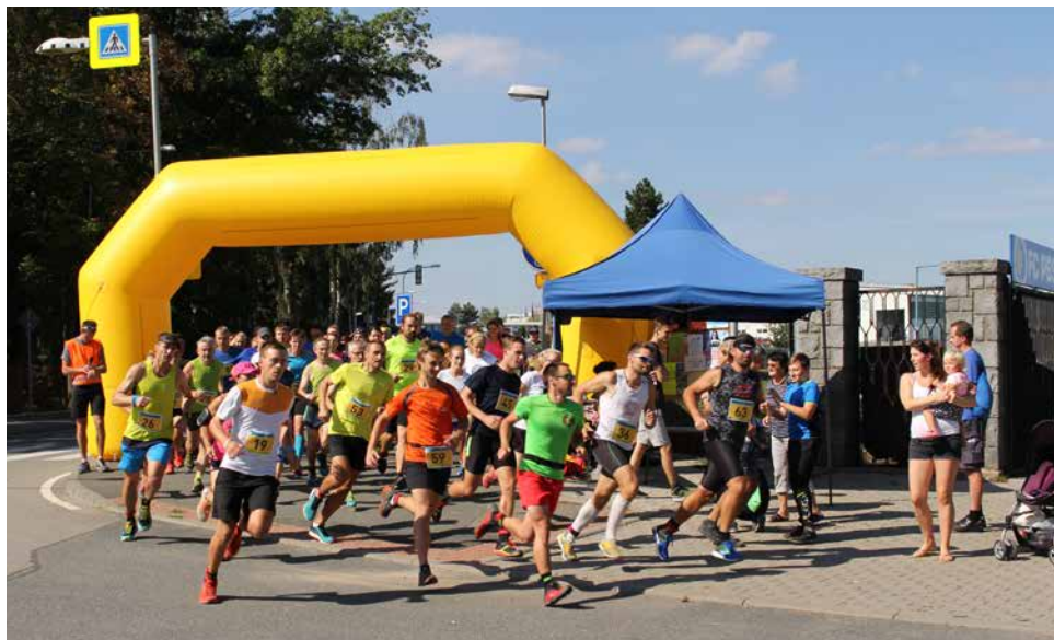
„Na startu“.

Slunečný, novátorský, rekordní. Takový byl letošní již 5. ročník PoHodové devítky. Počasí běžcům přálo a jistě i proto se tradičně první pohodovou neděli sešlo na startu hlavního závodu na 9 kilometrů 69 běžců a běžkyň nejen z Bíteše a okolí, ale také z Brna a dalších odlehlejších míst. Závodníky čekala nová téměř výhradně krosová trasa závodu, kde přibýlo kopečků a technických pasáží. S vedením trasy v lesních pasážích s řadou odboček souvisela obtížnost jednoznačného značení trasy, které jsme si vědomi, nebylo ide-