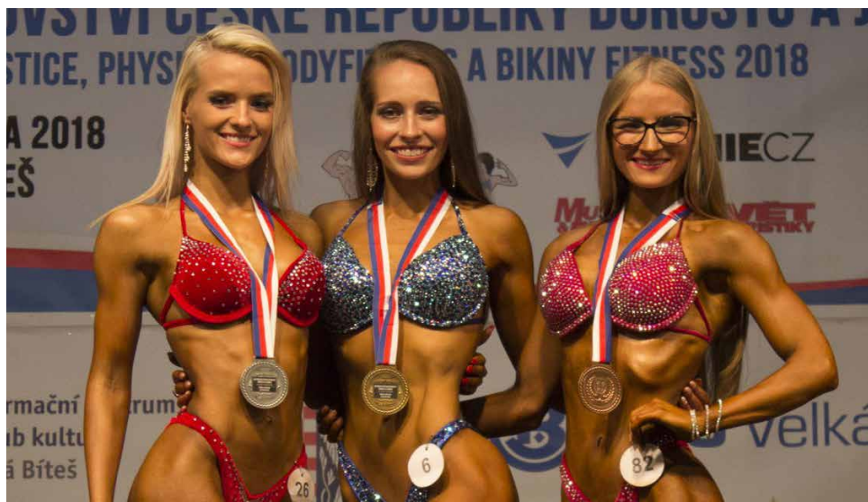
Vítězky v kategorii „Bikiny fitness juniorek do 164 cm“.

V sobotu 19. května poprvé v historii hostila Velká Bíteš Mistrovství České republiky dorostu a juniorů v kulturistice a fitness. 136 závodníků, kteří prošli sítím mistrovství Čech i Moravy, se utkalo v klasické a váhové kulturistice, physique, bodyfitness a bikiny fitness. Celá akce byla živě přenášena na internetovém portálu a zhlédlo ji přes 3600 diváků. Návštěvníci, kteří se na tuto akci přišli podívat, a bylo jich na šest stovek, měli možnost zhlédnout nejenom vypracovaná svalnatá těla mladých mužů, ale i krásné a půvabné mladé sportovkyně. Osmnáct sad pohárů a medailí, na kterých se podílelo sponzorsky i Město Velká Bíteš a První brněnská strojárna a.s., Velká Bíteš, bylo rozvezeno díky soutěžícím do všech koutů České republiky. Informační centrum a Klub kultury se omlouvá všem občanům, kteří se o akci nedozvěděli, za malou propagaci, ale s pořadateli se celá akce řešila na poslední chvíli a například plakáty jsme obdrželi až v podvečer závodu. Pokud pořadatelé budou mít zájem v příštím roce uspořádat obdobný podnik v našem městě, už dnes slibujeme, že se občané včas dozvědí termíny a přesný program.