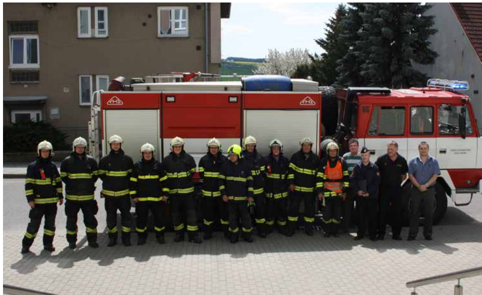
Společné foto.