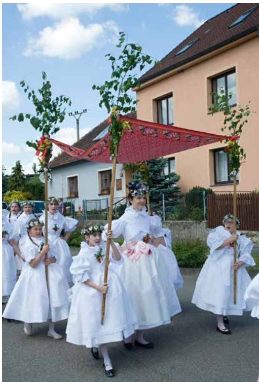
„Královničky“.