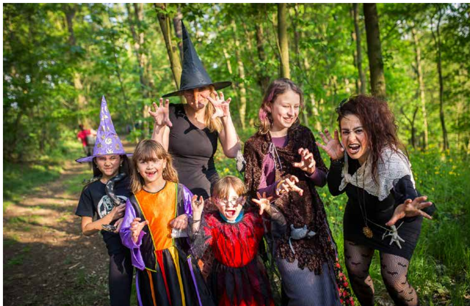
„Čarodějnice“ na Letné.

30. dubna připravili pracovníci Informačního centra a Klubu kultury ve spolupráci s místními spolky pálení čarodějnic v areálu městské chaty na Letné. Od půl páté děti a rodiče postupně zaplňovali prostranství před objektem a odtud se vypravovali na plnění úkolů, které pro ně na jednotlivých stanovištích připravili členové Sboru dobrovolných hasičů Velká Bíteš, dále pak přestrojené půvabně vypadající čarodějné maminky z Materského centra Bítešáček a ty doplnil Mírek Ivančík z fotbalového klubu. Děti procházely lesní přírodní stezkou a po splnění zadaných úkolů byly materiálně sladce odměňovány od pořadatelů. Poté se všichni vraceli zpět do areálu chaty, kde bylo připraveno občerstvení a hudební program s country skupinou „Starý fóry“. Každý si mohl zakoupit špekáček a na ohništi si ho opéct. Rodiče měli možnost nejenom zakoupit svým dětem trdelníky a sladkosti, ale i odnést si domů na památku fotografie.