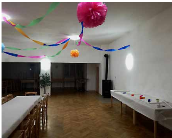
Nové vnitřní prostory kulturního domu.