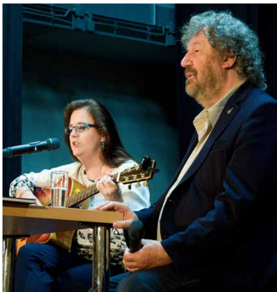
Z představení.

Po skončení pořadu byla autogramiáda s umělci a své zakoupené knihy si mohli přítomní nechat podepsat nebo se vyfotografovat a mít tak milou vzpomínku na úžasný a skvělý pořad.