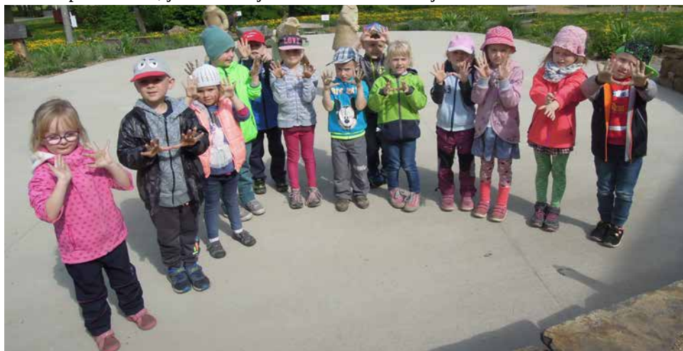
Děti ze třídy Včelíček na výletě v Balinách.

Prázdniny se blíží a děti mají za sebou další školní rok. Některé se chystají po prázdninách do prvních tříd, jiné zůstávají ve školce a budou si ještě užívat bezstarostné dětství.