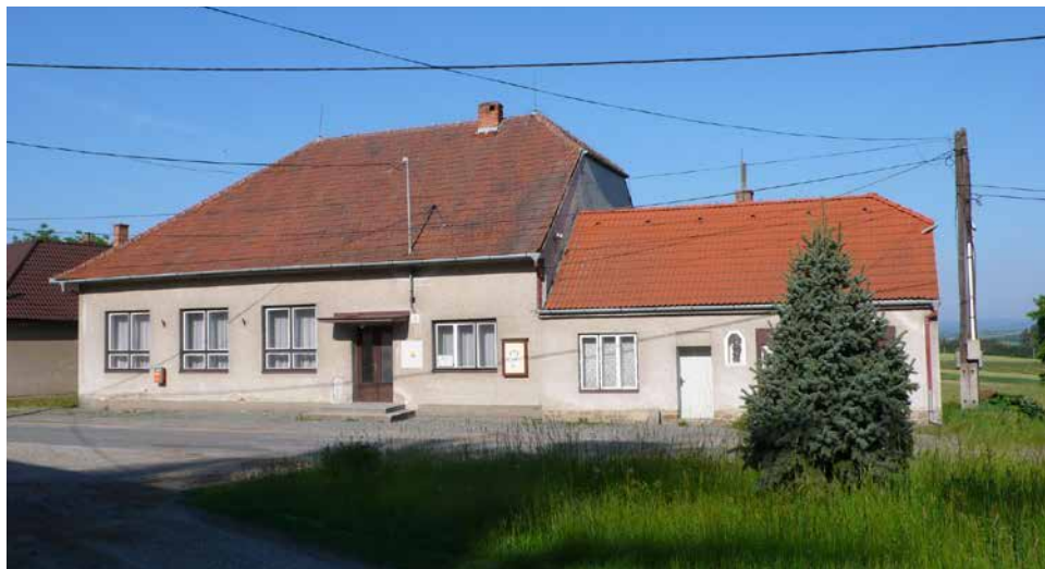
Kulturní dům s hasičskou zbrojnicí a stříbrným smrkem.

Byl zasazen na obecním pozemku proti KD. Až doroste, stane se jistě dalším vi-