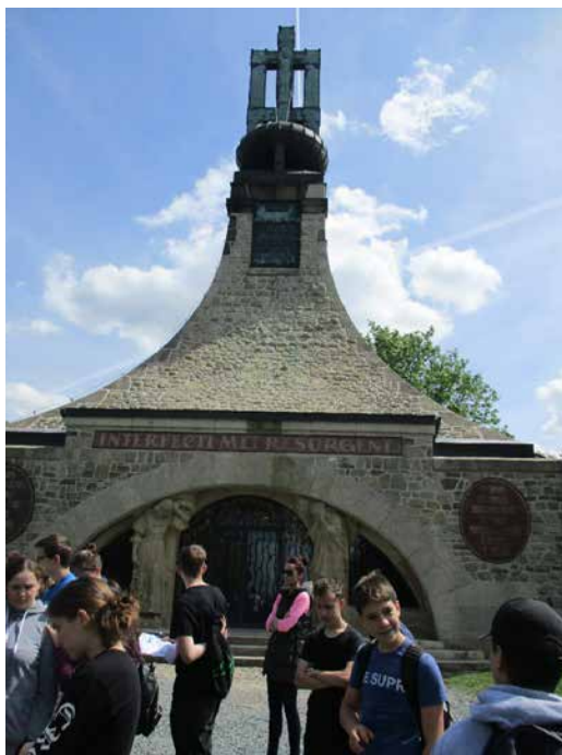
Mohyla míru.