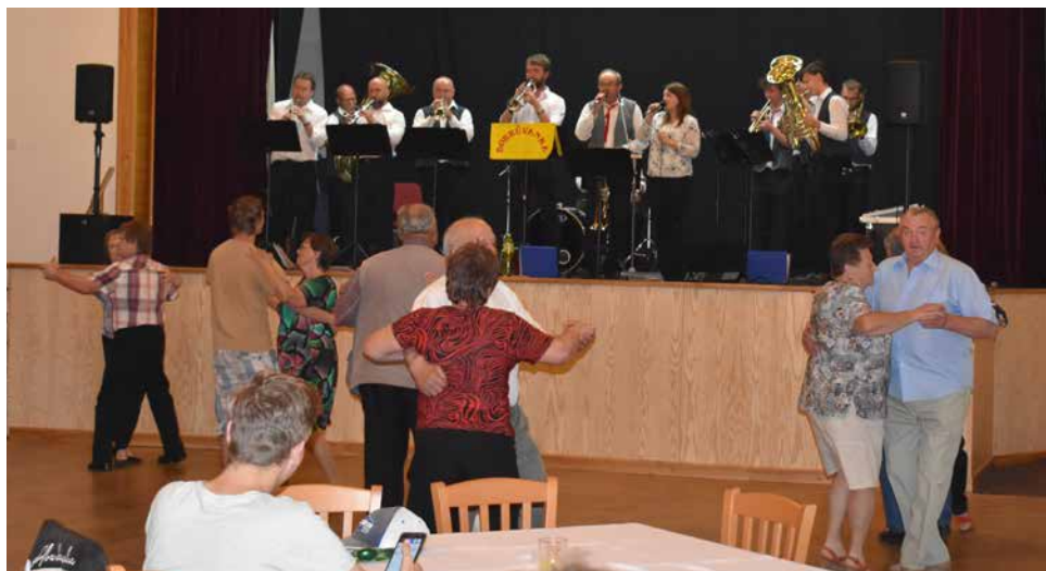
DH Bobrůvanka v KD.