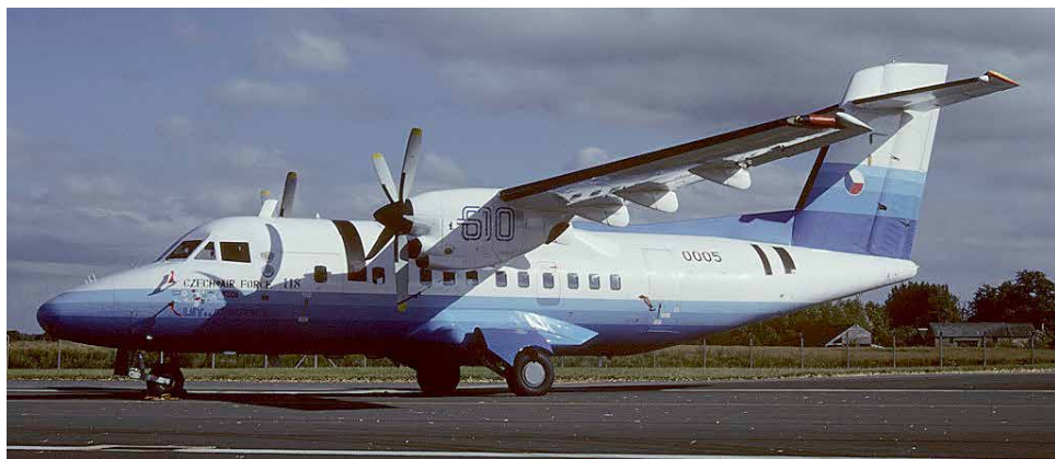
Prototyp letadla L 610 na Kunovickém letišti.

Úkolem pomocné energetické jednotky je kromě dodávky stlačeného vzduchu pro nastartování hlavního motoru také nouzové zabezpečení funkcí elektrických a hydraulických okruhů v letounu. Její vývoj si vyžádalo zavedení sériové výroby letadel L-39 v podniku