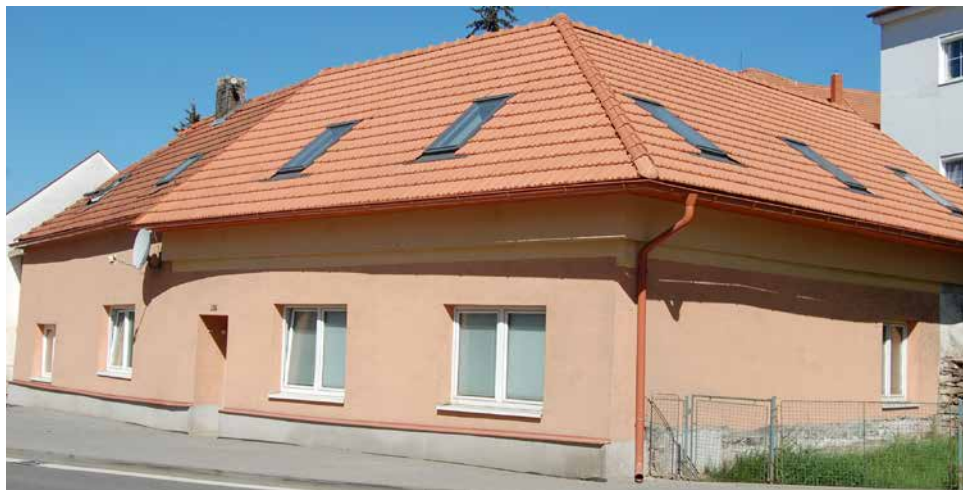
Dům čp. 165 v současnosti.

Seriál o domech a jejich majitelích na náměstí, v ulicích i na předměstích Velké Bíteše zabývající se dobou (již) před polovinou 20. století. Nyní ulice POD HRADBAMI , čp. 165: