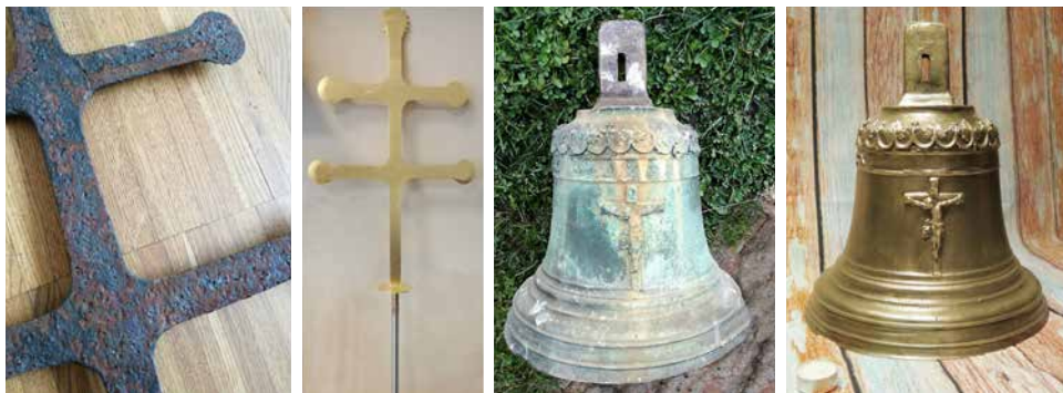
Renovovaný kříž a zvon kapličky.

nových dveří. Svým čistým, zařívě bílým nátěrem se stala kaplička nepřehlédnutelnou dominantou obce.