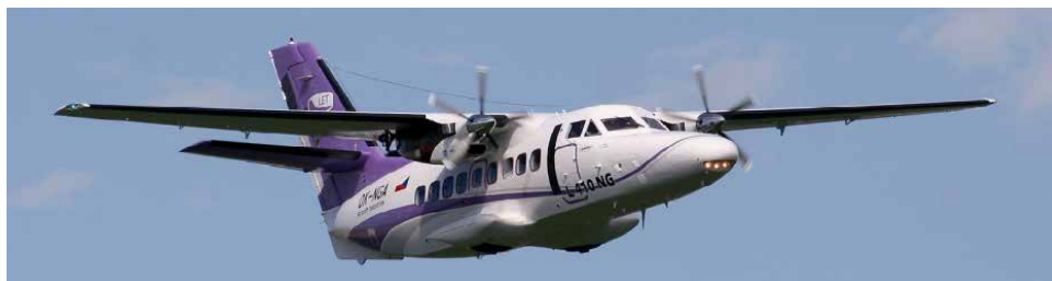
Současně vyráběný typ kunovického turbovrtulového letounu – L 410 NG.

Proti verzi Safír 5M byla tato nově vyvíjená pomocná energetická jednotka s ozna-