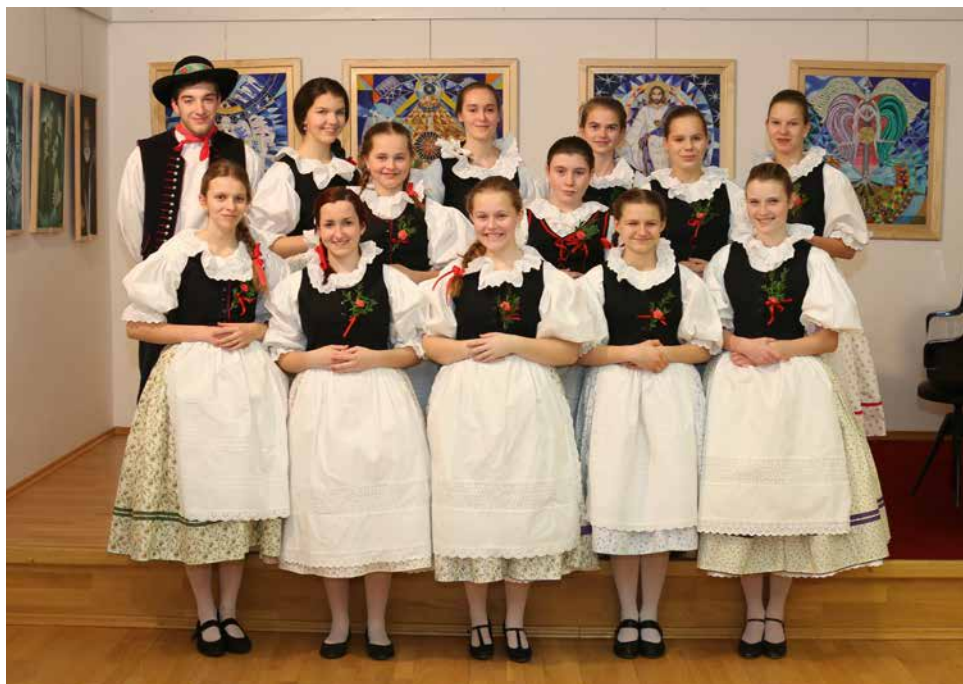
Skupina mládeže Národopisného souboru Bítešan.

litní filmový záznam tance zhotovil Josef Prodělal z Muzea Vysočiny Třebíč. Celkovou přípravu a realizaci akce podpořilo Regionální pracoviště tradiční lidové kultury v Kraji Vysočina. Prostory výstavní síně poskytl Klub kultury města Velké Bíteše a také Městské muzeum ve Velké Bíteši. Spolupráci v projektu zaštitila Základní škola ve Velké Bíteši. Každý z tanečníků obdržel vytištěný certifikát s poděkováním z Belgie. Goethe-Institut Brüssel film uvedl při příležitosti Dne Evropy 9. května 2018 a dále v externí prezentaci ve veřejných institucích např. ve velvyslanectvích, ministerstvech a školách. Videodokument je dostupný na domovské stránce institutu - zde: