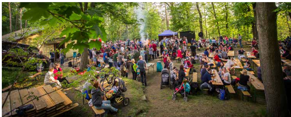
Čarodějnice na Letné.