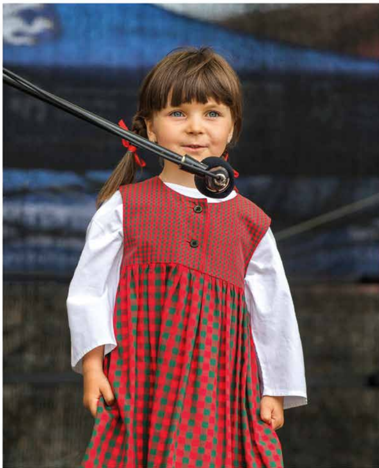
Snímek z loňské přehlídky