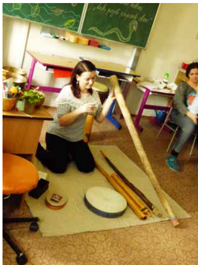
Výuka muzikoterapie.