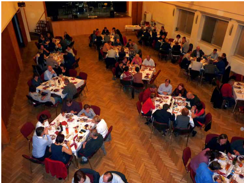
Svatomartinské hraní v KD.