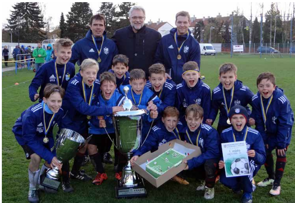
Vítěz mezinárodního fotbalového turnaje mladších žáků - německý tým - Chemnitzer FC.