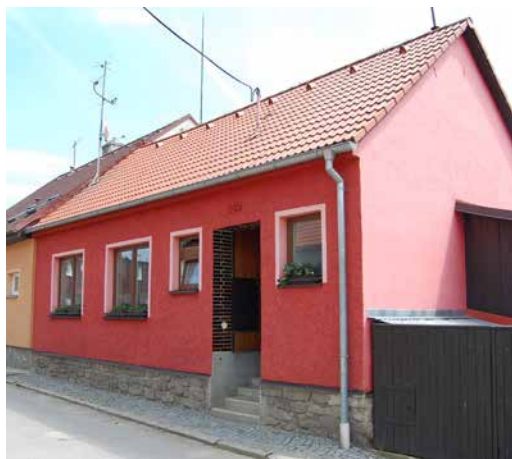
Dům čp. 159 v současnosti.

Seriál o domech a jejich majitelích na náměstí, v ulicích i na předměstích Velké Bíteše zabývající se dobou (již) před polovinou 20. století. Nyní ulice KOZÍ, čp. 159: