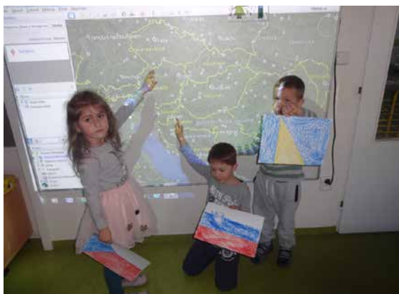
Projekt E-Twinning.

ných škol a více než 518 tisíc učitelů z celé Evropy.