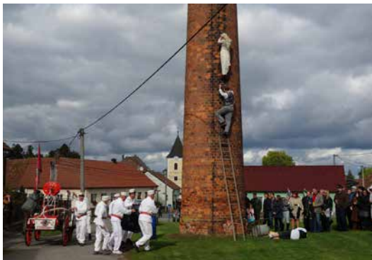
Soutěžní scénka z Postržínin v podání místních „ochotníků“.