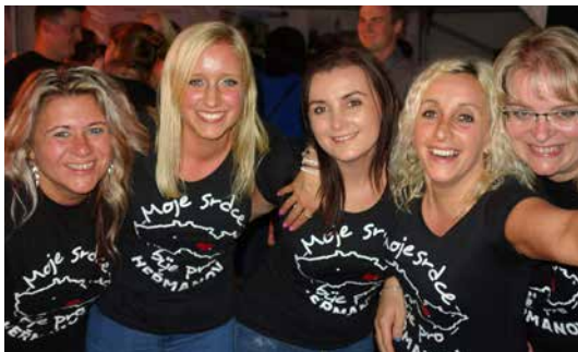
Rozesmátá heřmanovská děvčata slaví vítězství.

neujede a že si to tady s námi užijete. Máme tady spoustu jídla a pití, před kulturákem nějaký ten trakař na odvoz a na faře jsou místa k přespaní. V Heřmanově je to tradicí, tady se oslavuje až do rána a zítra je neděle...“.