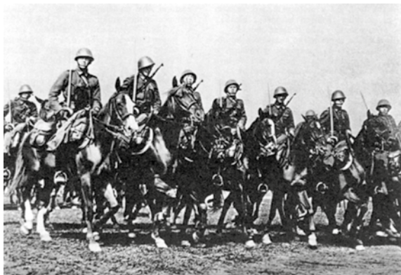
Příslušníci jízdní pěchoty ČSA.

Venku v terénu jsem už nepadal, na to jsem si dával velký pozor. Prvním mým koněm byla kobyla zvaná Veverka. Jednou zakopla na překážce, shodila mě, ale jinak byla docela klidná, až trochu líná. Proto jsem požádal, aby mně dali nějakého rychlejšího koně. Dostal jsem hřebce s nezvyklým jménem Údaj. Toho cvičili podkoňáci proti důstojníkům tak,