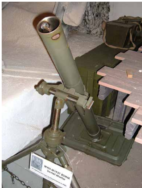
Minomet vzor 1937.

Horší časy nás čekaly od listopadu v poddůstojnické škole v Topoľčanech. Vojna jak řemen, jídla málo, k večeri často jen brambory s kysaným zelím, někdy i nějaký ten škvarek. Kromě výcviku se zbraní jsme opět jezdili na koních v jízdárně, já s těmi stejnými jako v Bratislavě. Poněvadž v poddůstojnické škole byli vojáci z různých útvarů, začínal jezdecký výcvik od úplného začátku. V první hodině nám přidělili koně a jeli jsme do jízdárny. V čele na tribuně už čekali naši velitelé se svými rodinnými příslušníky, a jako každoročně očekávali „zábavné“ představení nováčků. O to se úspěšně postarali ti z nich, kteří seděli na koni poprvé. Po seřazení a povelu ke klusu následovaly rady velitelů jak koně ovládat: „Povol mu uzdu, přitáhni mu uzdu...“ a podobně. Pádů bylo hodně, avšak do měkkého, do drtin. Rad bylo