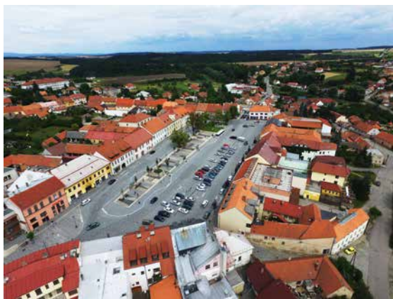
Letecký snímek Masarykova náměstí.

Opevněný kostel svatého Jana Křtitele , právě ten, který je vidět z dálnice, je skutečně obehnan silnou pevnostní kamennou zdí. Proč? Už kolem roku 1240 stával na tomto místě dřevěný kostel, později přestavěný do románského slohu. Polovina 15. století bezpochyby nepatřila k dobám klidným, proto dostal chrám pevnostní hradby s menší věží s jedinou bránou a s pěti baštami. Chrátová loď je zakončena druhou, vyšší věží. Malá i Velká věž jsou „korunovány“ báními maurské konstrukce. Velká věž nese tři zvony – Poledník, Maria a Kříž. Z Malé věže lze zase slyšet zvony dva. Větší, vážící 1950 kilogramů, je pojmenován Velký a menší se nazývá Umíráček. K Velkému zvonu se váže zajímavá legenda