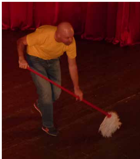
„Caveman“ v KD.