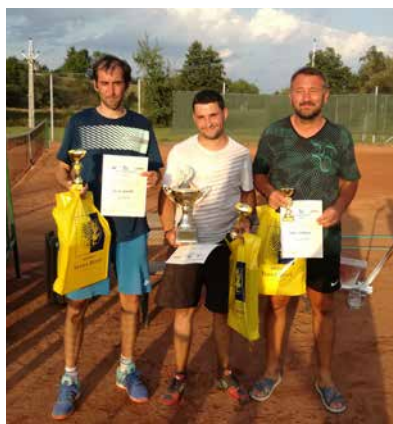
Nejlepší hráči v MP 2017.