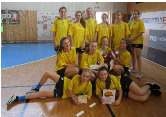
„Novoveselský míč“.

Druhý stupeň započal jako každý podzim s návštěvami brněnských divadel. A protože žáci si nejvíce oblíbili obě scény Měst-