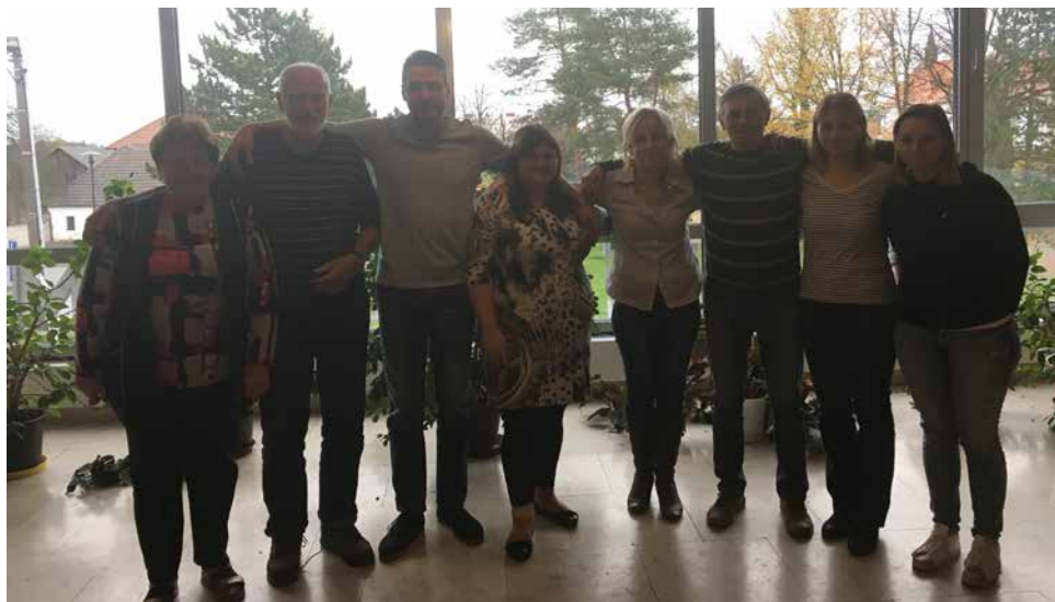
Společné foto.

KD byl uveden do provozu v r. 1980, a pokud od té doby v prostorách, které využívá ICaKK, v rámci stavebního řízení neproběhly žádné další stavební úpravy, je „de jure,