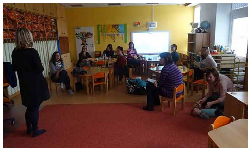
Přednáška logopedie.

Paňi magistra Jančiková je odbornice na logopedii a odpověděla rodičům na všechny dotazy, které zazněly. Každý, kdo na tuto přednášku přišel, jistě nelitoval takto stráveného odpoledne.