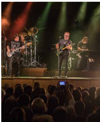
„Olympic“ v sále KD.

„na sezení“, ke konci se už i tancovalo přímo pod pódiem.