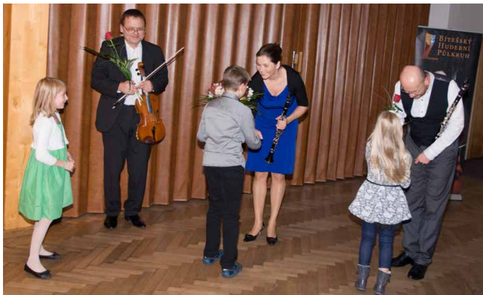
Trio Claret v KD.