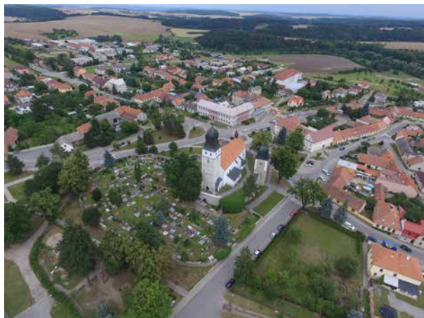
Letecký snímek Kostela sv. Jana Křtitele.

Cesta z Velké Bíteše k Tišnovu popsaná výše vás dovede nejdříve do Předklášteří , do obce, která se proslavila přenádherným areálem kláštera cisterciacek Porta Coeli – Brána nebes . Používá statut národní kulturní památky, což jen zvyšuje jeho turistickou atraktivnost. Vstupte do jeho dvou kostelů a nechte se zavést až k počátkům kláštera, o jehož založení se zasloužila Konstancie Uherská, vdova po Přemyslu Otakarovi I., a její synové, český král Václav I. a moravský markrabě Přemysl. Stalo se tak v letech 1230–1233. Postůjte před bohatě zdobeným figurálním portálem, projděte dlouhou a velebně působící Křížovou chodbou a zastavte se u zeleného trávníku Rajského dvora . Nechejte na sebe