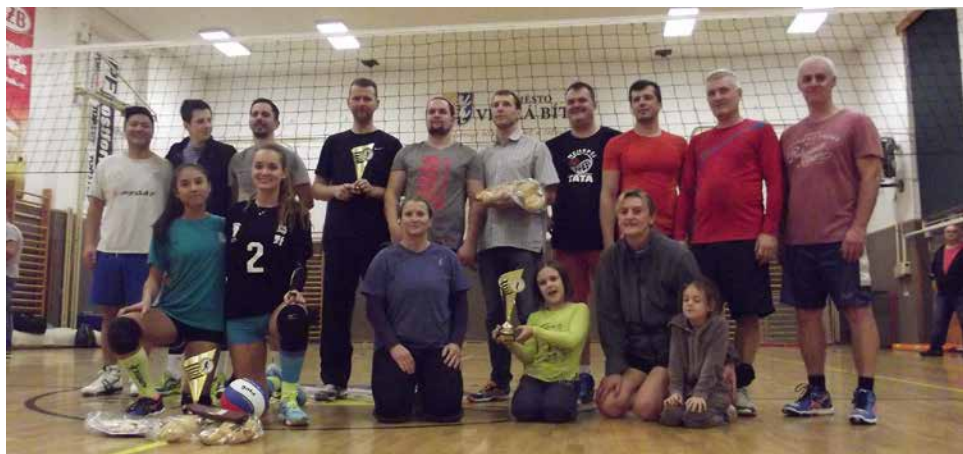
Společné foto vítězů.

Všechna družstva dostala ceny, nejlepší tři byla odměněna poháry. Turnaj jsme tradičně zhodnotili v restauraci „Na 103“. Myslím, že turnaj se vydařil a strávili jsme den plný sportu s bezvadnou partou lidí.