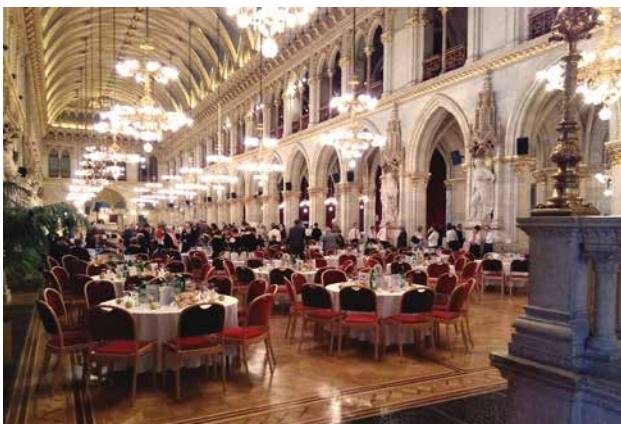
Organizátoři slavnosti a sál radnice ve Vídni.

Spolupráce mládeže Národopisného souboru Bítešan s dudáckou muzikou ZUŠ Hrotovice přinesla další zahraniční pěvecké vystoupení. Tentokrát 20. října v rakouském hlavním městě Vídni. Ve slavnostním sále novogotické radnice se konala výroční slavnost Flame of Peace , při níž byla předána ocenění rakouské neziskové organizace Vereins zur Förderung des Friedens (asociace pro podporu míru), významným osobnostem, mírovým aktivistům a organizacím za svou činnost při prosazování míru. Slavnosti se zúčastnilo 35 národů. Po ceremoniální části následoval kulturní program, v němž vystoupila řada skupin představujících kultury různých zemí. Za Českou republiku to byla dudácká muzika ZUŠ Hrotovice se zpěvačkami z Velké Bíteše. Pod vysokou klenbou impozantního sálu zaznělo několik lidových písní z našeho regionu. Účinkující obdrželi od hlavních organizátorů paní Herty Margarete Habsburg-Lothringen a pana Sandora Habsburg-Lothringen pamětní listy s poděkováním.