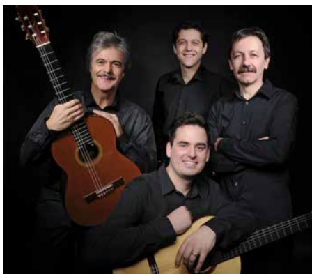
Kytarové kvarteto.

Bítešský hudební půlkruh uvítal za svou dvacetiletou existenci velké množství kvartet – ať už klasických smyčcových, nebo netradičních – saxofonové, houslové, violoncellové, kontrabasové. O Pražském kytarovém kvartetu víme dlouho, až v letošní sezóně jej však v Bíteši uslyšíme. Rozhodně máme důvod se těšit – letos má kvarteto „Kristova léta“ a stejně tak dlouho získává superlativní hodnocení odborné kritiky. Kvarteto je zváno na významné hudební festivaly (Pražské jaro, Paříž, Tel Aviv, Kuwait, Miami atd.), koncertovalo ve většině zemí Evropy, v USA či Izraeli a absolvovalo stovky koncertů v České republice.