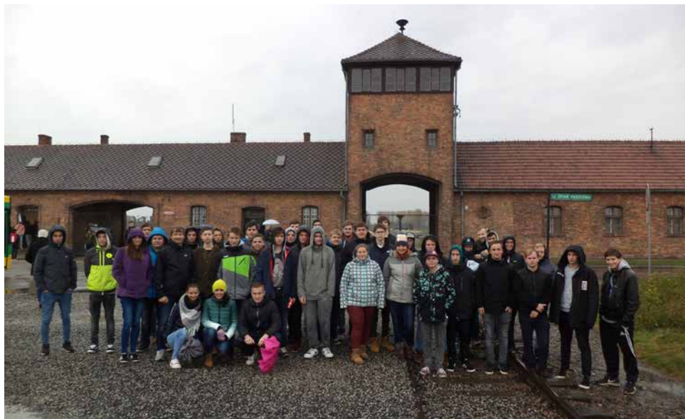
Žáci - Osvětim - Auschwitz II - Birkenau.

V rámci dalšího vzdělávání jsme se rozhodli nabídnout našim studentům exkurzi do Osvětimi. Protože o ni měli velký zájem, byla realizována a 2. listopadu v ranních hodinách na ni odjelo celkem 45 studentů. Po cestě autobusem se žáci od našeho průvodce dozvěděli základní historické události z českých dějin od konce Rakousko-uherské monarchie až do 2. světové války. Na to navázala asi 4hodinová prohlídka v největším nacistickém concen-