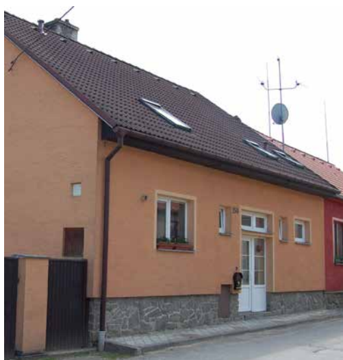
Dům čp. 158 v současnosti.