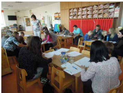
Grafomotorika v MŠ.