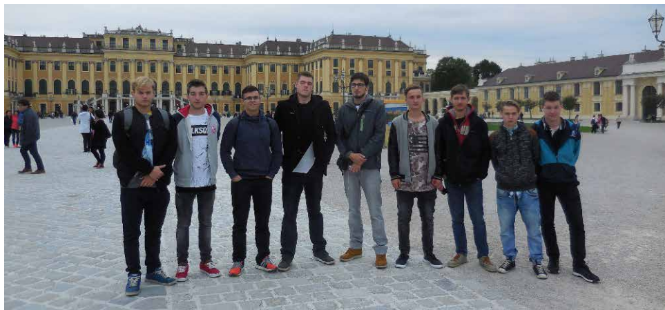
Ze zámku Schönbrunn.

a Národní agentury (pro ČR je to Dům zahraniční spolupráce) a financován Evropskou unií. Podporuje spolupráci a mobilitu ve všech oblastech vzdělávání: mládeže, neformálního vzdělávání, v odborné přípravě a sportu. ETEN Network, síť spojující několik zemí Evropy a podílející se na organizování odborných praxí, stáží a seminářů pro žáky středních škol a jejich pedagogy, vznikla v roce 2012 (v ČR v roce 2014). Cílem programu Erasmus+ je zlepšit odborné činnosti, jazykové znalosti v AJ a NJ, odstranit bariéry při komunikaci v neznámém prostředí a také umožnit žákům poznat odlišnou kulturu a pracovní život v dané zemi. V neposlední řadě přispívá k rozvoji osobních kompetencí (samostatnosti, sebevědomí atd.).