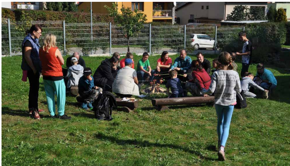
Svatováclavský pochod.

V přírodě se samozřejmě uskutečnil též Svatováclavský pochod, ten letošní byl již osmý a zúčastnilo se ho 118 dětí a dospělých. Naše základní škola ho organizovala ve spolupráci