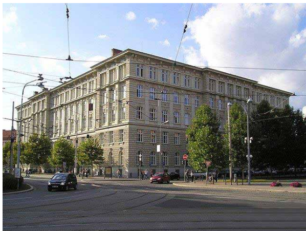
Bývalá „Vysoká škola technická v Brně“ na Věveří.

po 17. listopadu 1939 Němci všechny vysoké školy uzavřeli, byl nyní o studium obrovský zájem jak nových, tak i starších posluchačů, který převyšoval prostorové možnosti. Přednášky nejdůležitějších předmětů, jako je matematika, fyzika a deskriptivní geometrie, se konaly ve velké aule. Těm, kteří nepřišli alespoň půl hodiny před začátkem, nezbylo nic jiného, než si sednout na podlahu. V zadní části auly bylo velmi špatně vidět i slyšet. Nebyly žádné učebnice ani skripta. Teprve v roce 1947 vydal profesor Čupr třídílná skripta z matematiky a profesor Klapka napsal obsáhlou šestisetstránkovou učebnici Deskriptivní geometrie, která však nebyla pro výuku vhodná. Za takových podmínek bylo lepší studium přerušit nebo odstoupit.