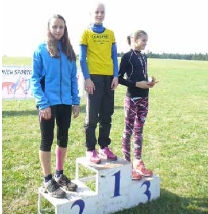
Přespolní běh.

Střední odborná škola Jana Tiraye Velká Bíteš se rozhodla k účasti na projektu Erasmus+. Jedná se o vzdělávací program, který je realizován prostřednictvím Evropské komise