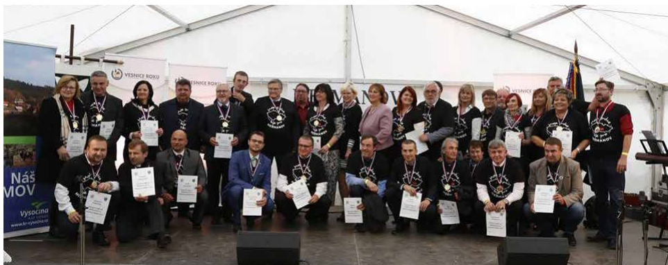
Účastníci soutěže, organizátoři a další významní hosté v tričkách „Moje srdce bije pro Heřmanov“.

Následovalo, další nekonečné předávání cen, další body programu, ale zmíním pouze ty nejzajímavější: