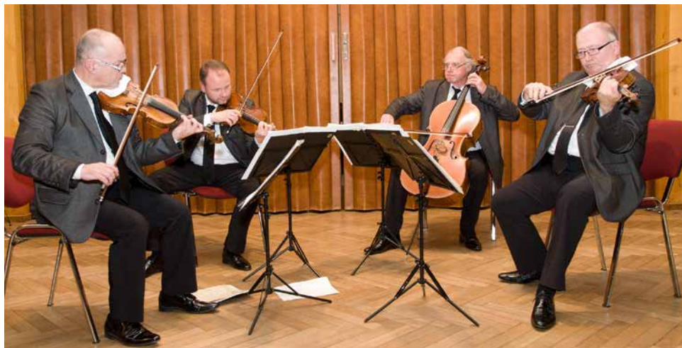
Janáčkovovo kvarteto v KD.

v každém z nich. V první polovině večera jsme si vyslechli Smyčcový kvartet D dur – Skřivánčí J. Haydna. Náleží do skupiny šesti ruských kvartetů op. 33, které byly věnovány velkoknížeti Pavlovi. Tato čtyřvětá skladba je typickou ukázkou vídeňského klasicismu s inovativní třetí větou, kde je menuet zaměněn za rychlejší scherzo. Společně s hráči jsme se přenesli do prostředí zámecké a salonní hudby 18. století, kde vládla noblesa a elegance.