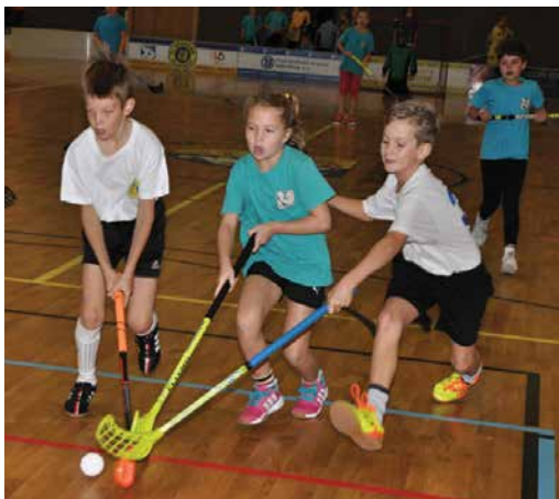
Z turnaje.