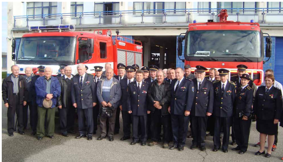
Společné foto zasloužilých hasičů a funkcionářů.