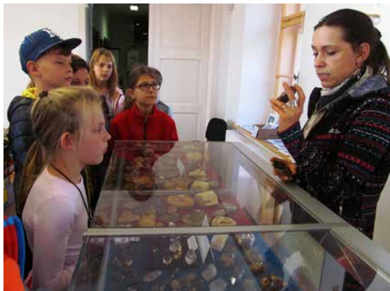
Ukázka minerálů pro dětské návštěvníky.

kou byl letos značný. Právě z řad dětí se za těch šest let vytvořila početná skupina malých sběratelů, kteří s rodiči pravidelně využívají příležitosti doplnit své sbírečky zase o nějaký ten zajímavý kamínek.