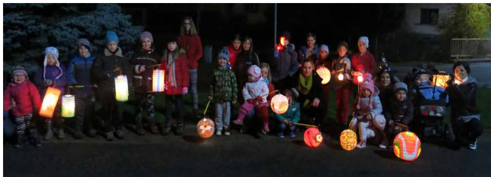
Lampionový průvod.