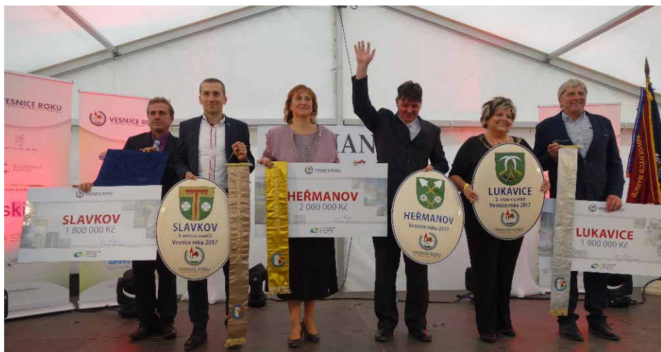
Vítězné obce soutěže „Vesnice roku 2017“.