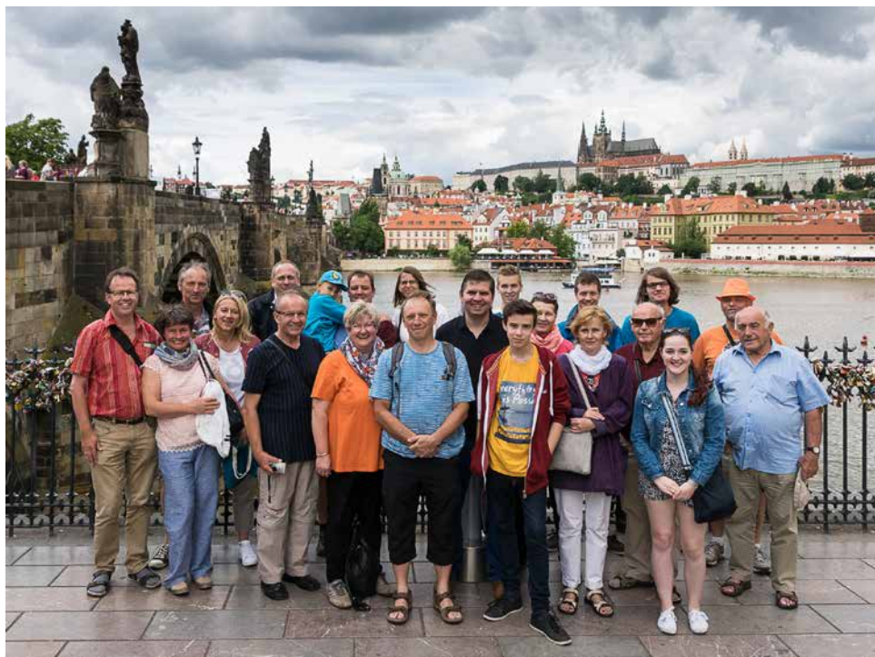
Členové obou KR rodin v Praze u Karlova mostu.