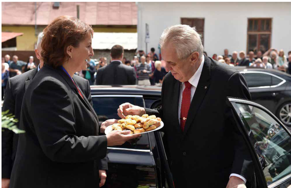
Starostka Heřmanova Pavla Chadimová vítá prezidenta České republiky.