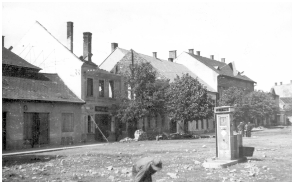
Stopy po bombardování 8.5.1945 na spodní straně náměstí. (Dům bez střechy je č.p. 5, dnešní muzeum a ICaKK).

Velkou Bíteší sovětský dvouplošník, z kterého pilot vyhazoval ručně menší tříštivé nebo zápalné bomby a střílel po lidech, které náhodně zahlédl. Málem „trefil“ moji sestru Květu. Já se sestřinou kamarádkou Věrou Kopečkovou jsme se na poslední chvíli schovali do malého krytu na Pelánově zahradě. Byl zakryt pouze silnými dřevěnými fošnami, na kterých bylo nasypano asi 10 cm hlíny. V těchto dnech zahynuli první občané našeho města. Pan Balák byl zabit tříštivou bombou na dvoře budovy č. 5. (dnešní muzeum a ICaKK) a podobnou bombou byl zabit i pan Caha. Takové nálety, spíše průzkumné lety, se konaly téměř denně. U kapličky na Psí hoře byla umístěna baterie čtyř protiletadlových děl. Můj otec, který bojoval v první světové válce a měl velké zkušenosti, chtěl, abychom vyklidili z půdy všechny hořlavé předměty a důkladně všechno vymetli.