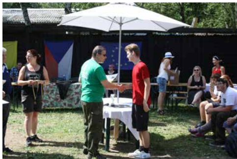
Předávání diplomů.