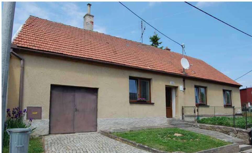
Dům čp. 156 v současnosti.

pozůstalý dům zakoupil za 100 moravských zlatých Václav Brodský a „ k tomu puštěna jemu kráva, aby ji užíval rok bez platu a tele od ní Matějovi dal. Co pak dáleji užívati bude, to podle smlouvy mezi sebou učiněné platiti bude “. Zmíněným Matějem mohl být Matěj Chlumecký , který zakoupil dům (stále) po Janu Novoměstském za stejnou cenu v roce 1637. Někdy poté dům zpusťl a byl veden jako poustka Novoměstského.