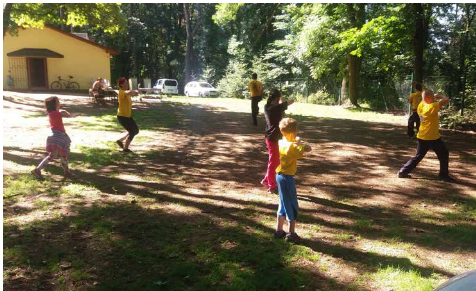
Z nedělního tréninku již s prořídilými řady účastníků.