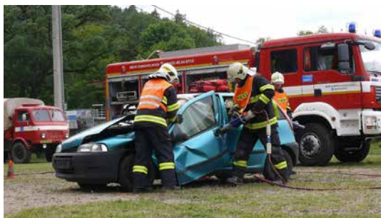
Ukázka vyproštění zraněné osoby z havarovaného vozidla.

V sobotu 15. 7. 2017 proběhla slavnostní valná hromada sboru. Neděle 16. 7. 2017 byla dnem určeným pro veřejnost. SDH Velká Bíteš se zúčastnil slavnostního průvodu obcí s technikou CAS 32 Tatra 148 a CAS 20 MAN TGM 18.330 4x4 BB. Dále divákům ukázali, jak probíhá vyproštění zraněné osoby z havarovaného vozidla.