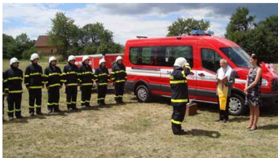
„Žehnání“ nového vozidla DA-L1Z Ford Transit.