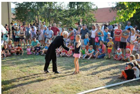
V loňském programu soutěže nechybělo kouzelnické představení.

tradicí, že nejlepší borce odmění hodový rychtář s rychtářkou, a jinak tomu bude letos. Soutěžit mohou již nejmenší děti (předškoláci) a všichni, kdo jsou školou povinní, kteří budou rozděleni do kategorií podle věku. Farní zahrada, kde se soutěž „Bíteš hledá borce“ koná, se letos otevře v sobotu 9. září od 14.30 hodin.