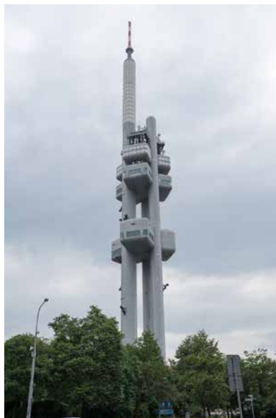
Žižkovská televizní věž.

Možná si někdo řekne, to je toho, pořád ta Kolpingova rodina, ale tak to není. Posuzujeme-li tato pravidelná mezinárodní setkávání v kontextu doby, zjistíme, že význam takových drobných kontaktů pro mírový vývoj v Evropě je nedoceněný. Ve světě, který je k prasknutí přesycen zbraněmi, v Evropě, jejíž kultura je ohrožena nekontrolovanou migrací a neustálými teroristickými útoky, je přece velice prospěšné, setkávají-li se takto