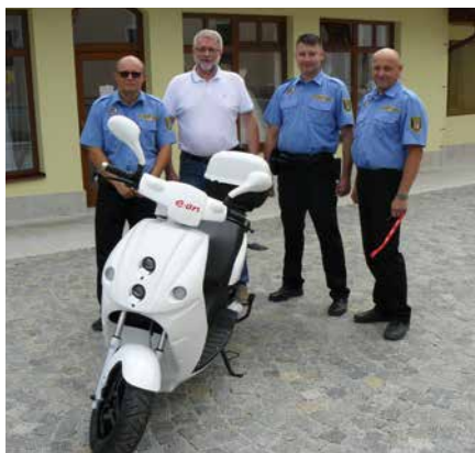
Zapůjčený elektroskútr se strážníky Městské policie.