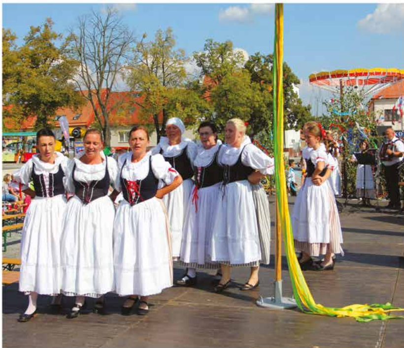
Folklorní soubor z Okřížek na Třebíčsku, 2016