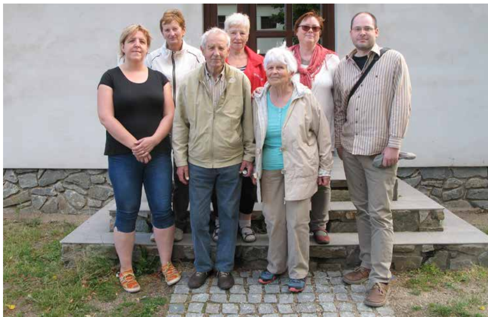
Členové Muzejního spolku před bývalou rychtou ve Břežce.