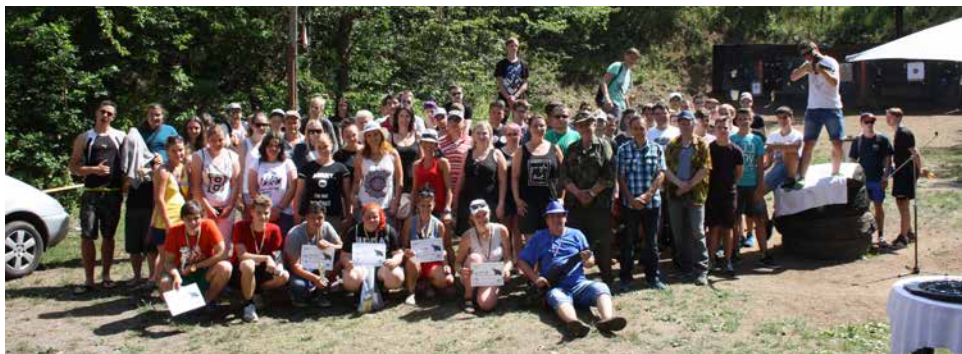
Společné foto soutěžících.