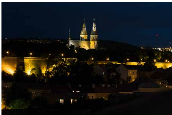
Noční Vyšehrad.

dím město veliké, jehož sláva hvězd se dotýká...“ Co však doloženo je, že v 1. polovině 10. století zde byl založen hrad, jako druhé sídlo Přemyslovců, a že zde kolem roku 990 byla mincovna, ve které si česká knížata nechala razit denáry s nápisem „VISEGRAD“. Kolem roku 1070 si sem přeložil svoji rezidenci první český král Vratislav II. Z roku 1085 pochází tzv. „Vyšehradský kodex“ - korunovační evangeliář tohoto prvního českého krále, který obsahuje jedny z nejstarších románských knižních maleb. Po takto stručně uvedené historii jsme hostům uvedli ještě několik dalších informací, spojených s tímto místem: