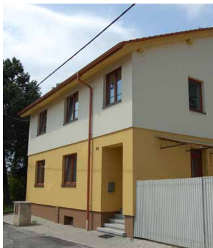
Současný stav domu č. 155.

Seriál o domech a jejich majitelích na náměstí, v ulicích i na předměstích Velké Bíteše zabývající se dobou (již) před polovinou 20. století. Nyní ulice KOZÍ, čp. 155: