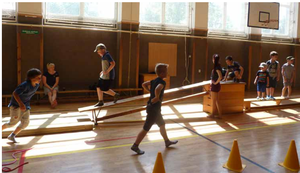
Dětský den ve sportovní hale TJ Spartak.

Čtvrteční ráno 1. června nás probouzelo sluníčkem, které nás provázelo po celý den při oslavách dne dětí. Ve spolupráci s Informačním centrem a Klubem kultury Města Velké Bíteše byl pro děti připraven den plný zábavy, her a soutěží. U Kulturního domu si mohly prohlédnout vojenskou a hasičskou techniku. Probíhala zde i ukázka bojového umění, výcvik psů. Záchranáři děti seznámili se svou profesí. Děti zajímala i ukázka vozidel Policie ČR z Dálničního oddělení Domašov. Dlouhou frontu si vystály u malování na obličej zvířecích a pohádkových postav. Sportovní hala TJ byla od rána připravena děti přivítat, aby si zaskočily na trampolíně a skákacím hradu. Vyzkoušely si různá náradí, kde si dokázaly svoji šikovnost. Florbalových holí se chopila i děvčata.