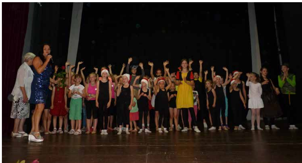
Společné foto účinkujících.