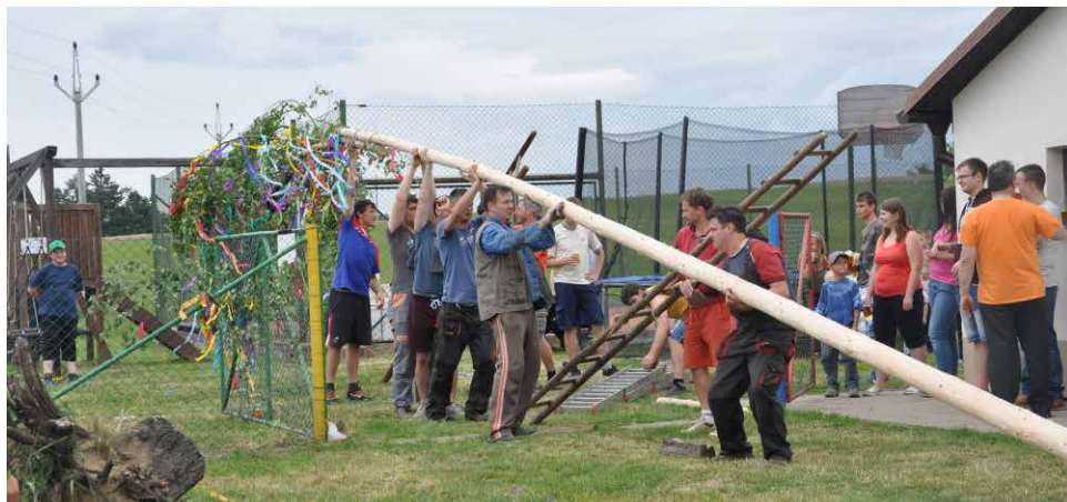
Stavění máje 2015.