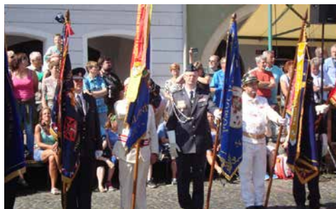
Ze slavnostní přehlídky SDH.