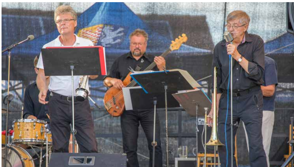
Vystoupení kapely „Retroband“.