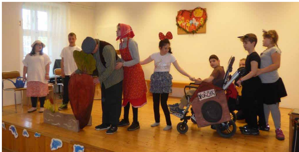
Pohádka O veliké řepě.

Vzpomenete si, který důležitý svátek většina z nás slavila druhou květnovou nedělí? Ano, byl to Den matek, který se slaví na počest maminek téměř po celém světě. U nás se slaví od roku 1923, má už tedy dlouholetou tradici. V tento den děti obdarovávají své maminky kytičkami či drobnými dárky, často vlastnoručně vyrobenými. Děti ze Základní školy Tišnovská 116 si i letos připravily poděkování maminkám za jejich obětavost, péči a lásku mimo jiné i formou besídky.