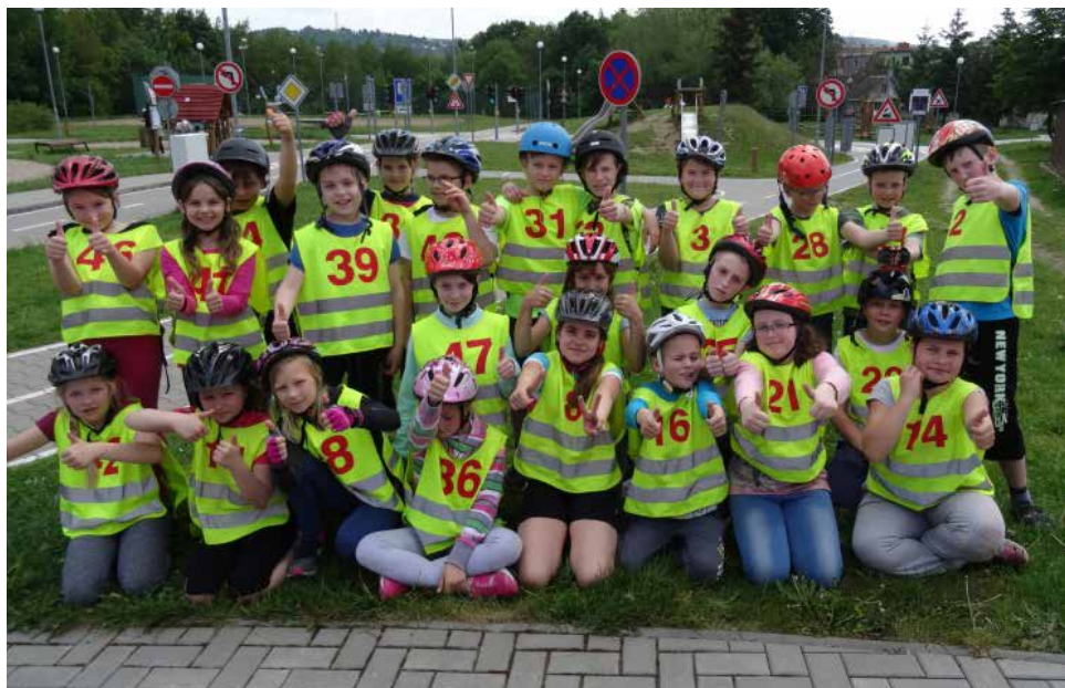
„Dopravní výchova“ je důležitá.

V pátek 19. května se uskutečnila tradiční exkurze do Prahy. Sedmáci a několik žáků z pátých tříd navštívili spoustu krásných míst, třeba Vyšehrad, sledovali střídání stráží na Pražském hradě, viděli šatičky Pražského Jezulátka a podivili se, že uprostřed hlavního města najdeme tak kouzelné klidné místo, jako je Kampa. Po zasluženém rozchodu na Václavském náměstí se ještě stihli svézt metrem. Ušli jsme asi 17 kilo-