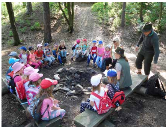
„Povídání“ u ohniště.

Díky projektu podpořenému Krajem Vysočina – Fond Vysočiny „Příroda je náš kamarád, společně ji chceme poznávat“