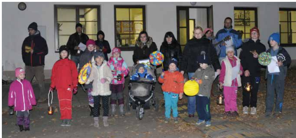
Uspávání světýlek.