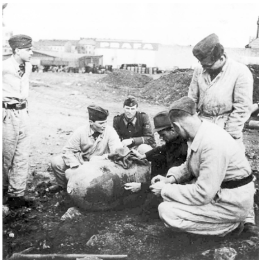
Čeští studenti jako příslušníci Luftschtuzu při likvidaci nevybuchlé bomby po náletu.

klasického gymnázia. Byla to nuceně nasazená děvčata ročníku „čtyřřadvacet“, která jsme museli naučit kreslit detailní výrobní výkresy jednotlivých částí přípravků, navržených staršími konstruktéry. Jejich otcové byli většinou zaměstnanci ČKD nebo v této firmě – známé jako „rodinná fabrika“, pracoval některý jejich příbuzný či známý. Přes nelehké a pochmurné období protektorátu byly naše vzájemné vztahy velice přátelské až kamarádké.