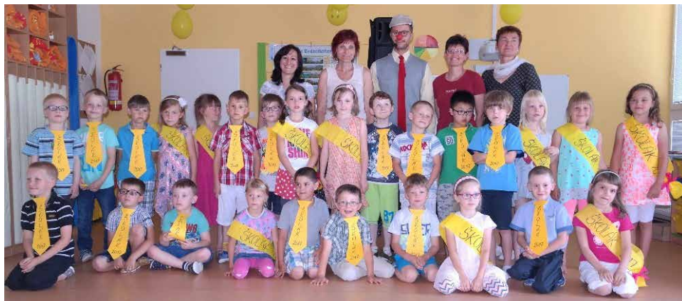
„Pasování“ na školáky.

užili veselé a zábavné odpoledne s klaunem, který nakonec děti pasoval do stavu školáků. Ve čtvrtek 22. 6. proběhlo slavnostní stužkování na radnici, kde se s dětmi rozloučili paní učitelky a také zástupci města. Děti dostaly stužky, drobné dárky a portfolio se svými školkovými pracemi. A nám, paním učitelkám, nezbylo nic jiného, než popřát: