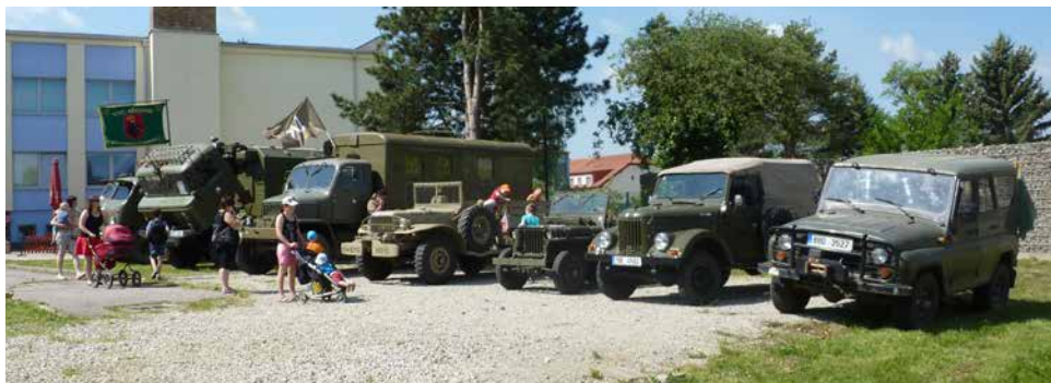
Přehlídka „veteránů“.

V letošním roce byl k vidění letištní speciál vojenských hasičů, LKHA 32 Mercedes Benz Actros 3354 6×6, automobilový žebřík AZ 30 Mercedes Benz Atego z požární stanice Velké Meziříčí. Místní profesionálové se představili s CAS K 27 Tatra 815 4x4 a dobrovolní hasiči s CAS 20 MAN TGM 18.330 4x4 BB a OA-L1 Renault Trafic. Armáda České republiky se představila s nákladním automobilem Tatra 810. Vojáci malým divákům předvedli svou výzbroj, atraktivní ukázky bojového umění MUSADO a ukázkou služební kynologie. Členové jednotky Sboru dobrovolných hasičů Velké Bíteše předvedli společně s odtahovou a havarijní službou ASSIST 24 s.r.o. ukázkou vyproštění zraněné osoby z havarovaného vozidla a likvidaci následků dopravní nehody. Jako každoročně se děti mohly seznámit s prací zdravotnických záchranářů Zdravotnické záchranné služby Kraje Vysočina z posádky rychlé zdravotnické pomoci Velká Bíteš.