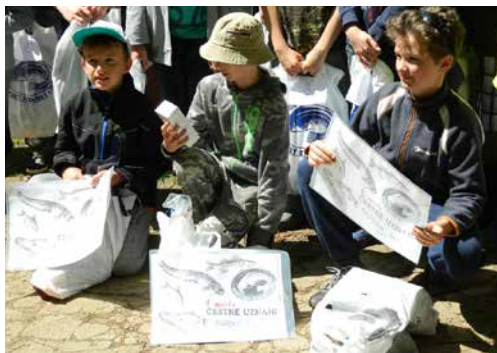
Vítězné soutěže „Zlatá udice“.