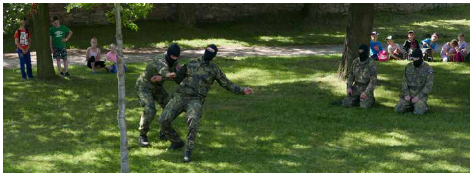
Ukázka bojového umění.

Odpoledne pokračoval біtešský dětský den v režii TJ Spartak ve sportovní hale.