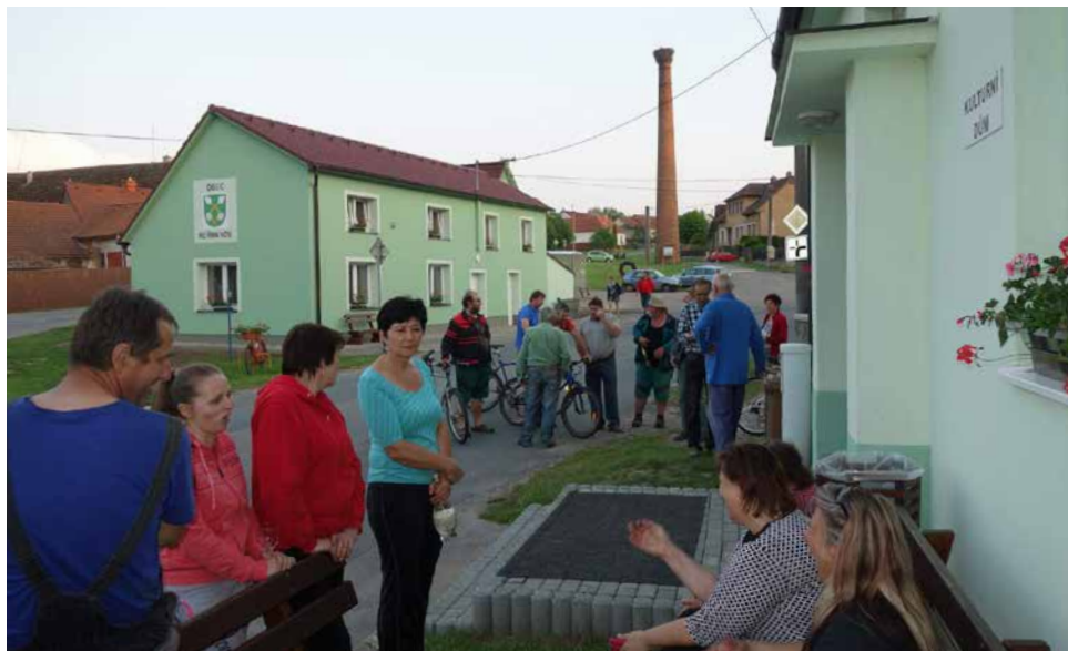
Heřmanovská náves. | Foto: Archiv obce

jsme si to zřízením komunitní školy Heřmánek . Skladba frekventantů je velice pestrá, od tříletých dětí až po naše vrstevníky. Chodí na počítače, na angličtinu, děti na malování, zpívání, mají tam také taneční obor, hru na klavír, na flétnu, na kytaru – prostě se tam střídá asi 70 lidí. Na platy lektorů se vybírá školné a obec dotuje provoz. Celé prázdniny provozujeme již třetím rokem „minitábor“, kde se vystřídá kolem 50 dětí z širokého okolí. Ta „mrňata“ chodí i zpívat do sborečku a velice je to baví. Potom zpívají maminkám k svátku, při rozsvícení vánočního stromu atp. Zpívali na „Vesnici roku“ a budou zpívat panu prezidentovi (to je zatím tajemství).