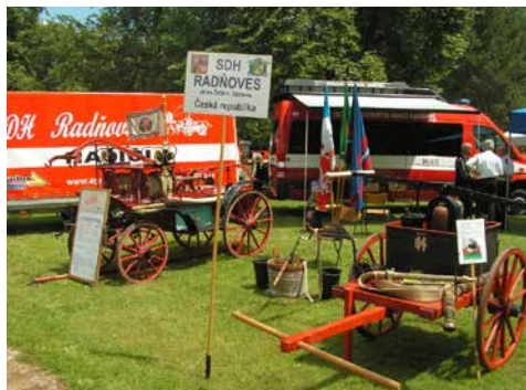
Přehlídka techniky SDH Radňoves.