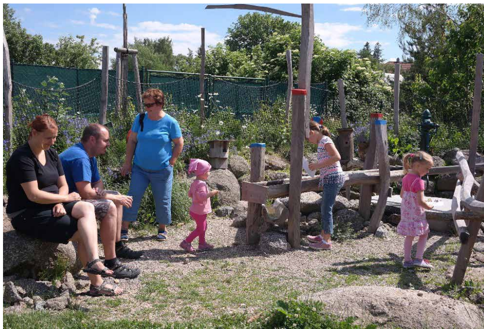
„Otevřená zahrada“ v MŠ Lánice.

Po splněných úkolech a po hrách na přírodní zahradě se šly děti i s rodiči občerstvit bezinkovou šťávou s ledem a mátou a perníčkem. Všichni měli možnost ochutnat pam-