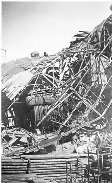
Trosky ČKD.

děla. Rychle jsme běželi do protiletadlových krytů, kterými byly zpravidla sklepy ve víceposchodových domech. Rozsah škod jsme viděli až následující den, v pondělí. Polovina našeho libeňského závodu, ve které se vyráběla obrněná vozidla, byla úplně zničená. Druhá část, kde se vyráběly letecké motory, zůstala bez vážnějšího poškození. Spadla tam sice velká pětitonová bomba, ale nevybuchla. Ta by byla schopna zničit celou továrnu, včetně administrativní budovy. Na druhé straně Českomoravské ulice byla zasažena rafinerie ropy. Její kouř zakryl celou leteckou továrnu, a proto k dalšímu bombardování nedošlo.