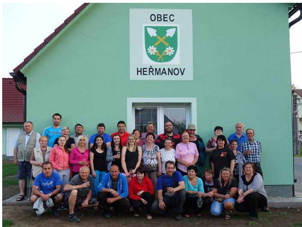
„Heřmanovští“ před svou klubovnou.

Zlatá cihla tu jsme získali v roce 2014 za příkladně opravenou faru v rámci programu Obnova venkova, to je takový bonbónek v soutěži.