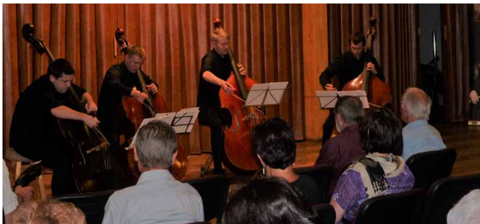
VELISS BASS QUARTET.

To, že kontrabasové kvarteto může znít v takovém příjemném a barevném souzvuku, mnohé překvapilo, zejména nás laiky. Podobné názory bylo možné slyšet i o přestávce. K úspěchu koncertu, pořádaného Informačním centrem a Klubem kultury za podpory