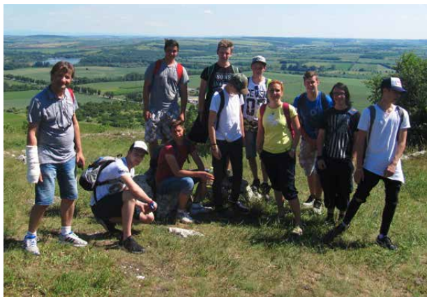
Společné foto.

známili s tím, jak se hlídaly hranice za první republiky a hlavně v době totalitního režimu. Žáci zde viděli místnost četnické stanice z doby 1. republiky i kancelář celnice za totality. Prohlédli jsme si vývoj uniforem četníků a posléze pohraničnicků naší republiky i zbytky opevnění hranic. Některé uniformy si studenti mohli také vyzkoušet. V „minikinosaře“ nám promítli film