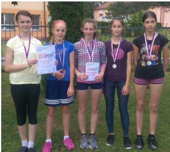
Atletický čtyřboj a 2. místo.