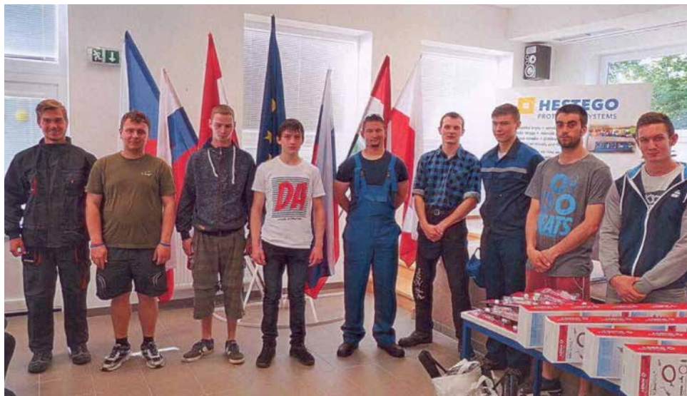
Společné foto. | Foto: Archiv SOŠ

Poté se všichni soutěžící obráběči odebrali na svá pracoviště a začalo se pilně pracovat. Soutěž probíhala v souladu s pravidly Cechu Kovo. Po jejím ukončení a vyhodnocení výsledků obdrželi všichni soutěžící diplomy, medaile a drobné ceny, pro vítěze byly připraveny poháry a hodnotné ceny.