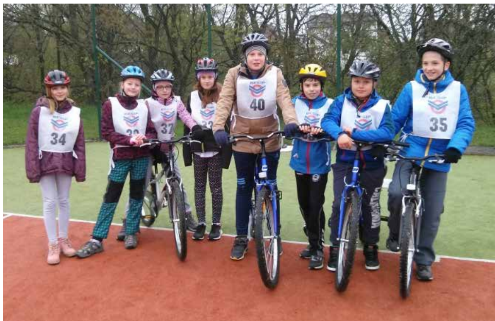
Z dopravní soutěže mladých cyklistů.

V letošním školním roce se poprvé uskutečnil zápis do prvního ročníku v jiném, pozdějším termínu. U nás proběhl 27. dubna. První pobyt ve škole jako tradičně dě-