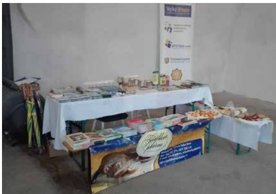
Stánek Informačního centra a Klubu kultury na akci.

Zahájení festivalu začalo v ranních hodinách. Na festivalu se předvedlo několik workshopů, soutěží a program doprovázela hudba. Zábava byla určená i dětem, pro nejmenší účastníky byl bohatý program, například hrané divadlo, keramická dílna, malování na obličej a závěrem opékání špekáčků. Akce vyložene lákala hesly: Ochutnej desítky pokrmů, vína od našich vinařů, piva z malých pivovarů, to vše a nejen to se konalo v tento den.