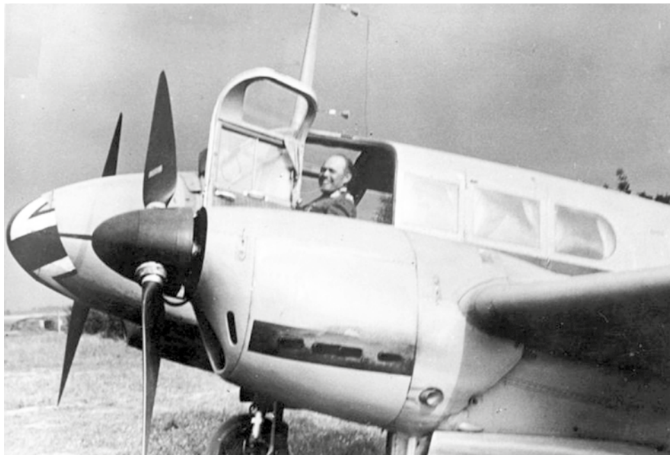
Dvoumotorové německé letadlo Siebel vyráběné v II. světové válce v Karlíně.