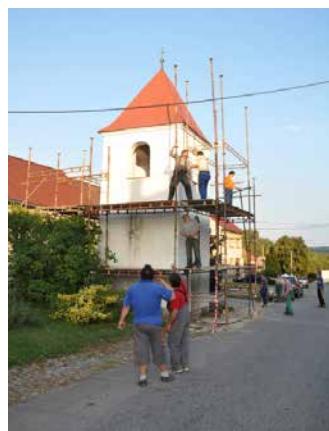
Oprava zvoničky.