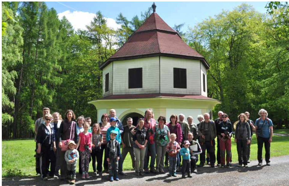
Účastníci u letohrádku ve východní části obory.

V sobotu 13. května jsme podnikli výpravu do Náměšťské obory. Výcházka se uskutečnila v rámci projektu Proměny krajiny Bíteška a při příležitosti Vítání ptačího zpěvu. Průvodci nám v Náměšťské (správněji Kralické) oboře byli místní ornitologové, lesníci a entomolog, kteří svými komentáři zpestřili příjemnou procházku krásným jarním lesem s mohutnými prastarými duby, buky, kaštany nebo jasany. Obora je ve správě Lesů ČR, s. p. - Lesní správa Náměšť nad Oslavou. Současně je evropsky významnou lokalitou výskytu tesaříka obrovského, kovaříka fialového a páchníka hnědého - xylofágních a saprofytických druhů brouků. V doupných stromech zde hnízdí několik druhů ptáků včetně holuba doupňáka a datla černého - ptáka roku 2017. Díky intenzivní pastvě (chovu daňků a muflonů) zde nacházíme prostředí, které se z našeho okolí vytratilo před několika stovkami let - řídké světlé listnaté lesy. Všech 35 účastníků si odneslo nevšední zážitek z pozorování či poslechu bezmála 20 druhů ptáků.