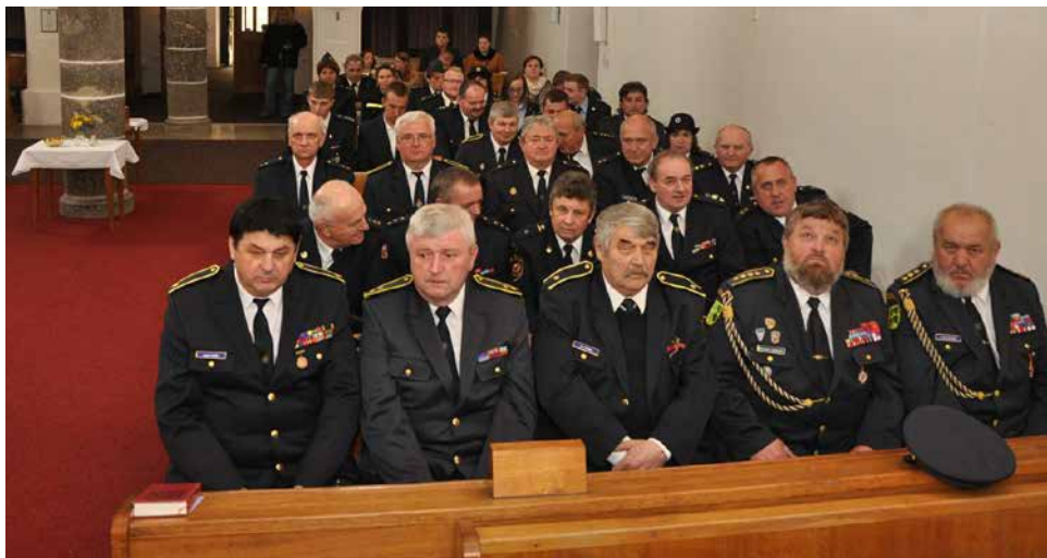
Mše svatá k patronu hasičů a města Velké Bíteše sv. Floriánu za živé a zemřelé hasiče v kostele sv. Jana Křtitele.