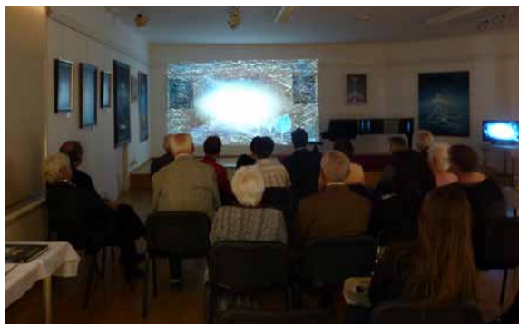
Videoprojekce na závěr vernisáže.