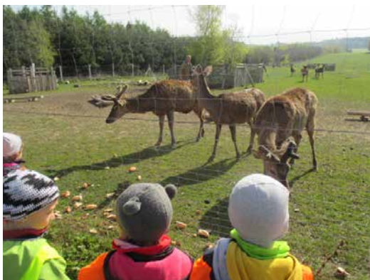
Z návštěvy Eko Farmy.

Nakonec nás čekalo krmení oveček a čerstvě narozených jehňátek. Děti si mohly jehňátka pohladit a nakrmit je z láhve s dudlíkem. Na závěr nám pan majitel ukázal zemědělskou techniku, která měla zejména u chlapců velký úspěch. Výlet se nám moc líbil a všichni jsme si ho užili.