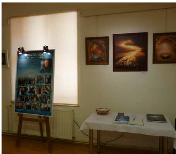
Z výstavy. | Foto: Silvie Kotačková

poskytuje pohyb světla a jeho reflexe na krystalických minerálech.