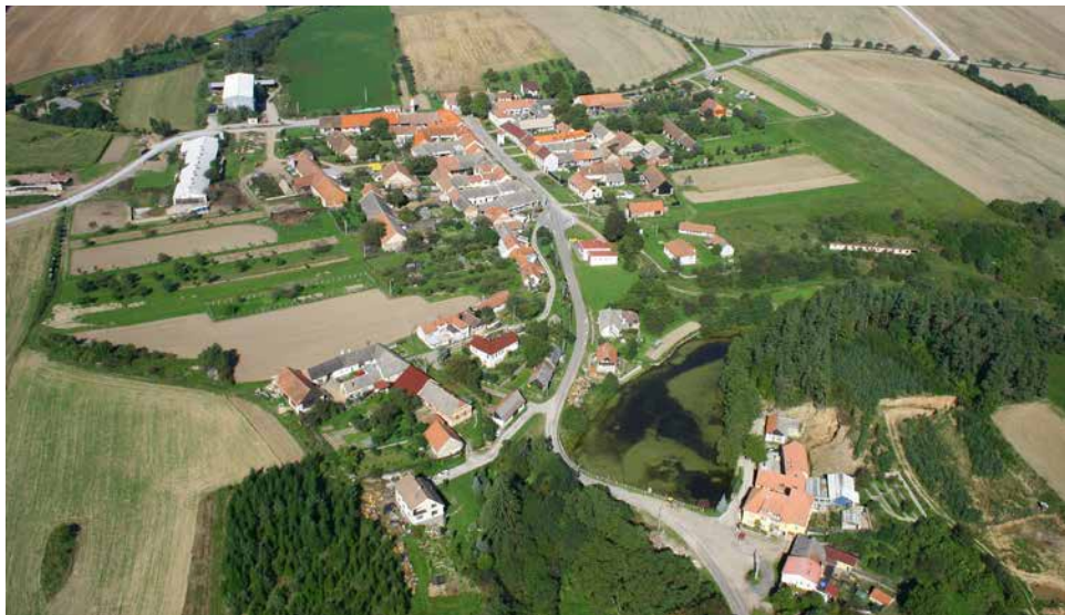
Březka – letecký snímek.