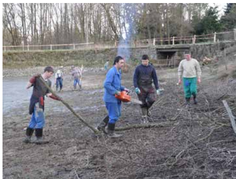
Čištění rybníka.

„Byly vypracovány projekty a město zažádalo o dotaci. Revitalizace by měla zahrnovat odbahnění, opravu hráze, opravu výpusti a přetokového kanálu. Zatím se hledá firma, která by to zrealizovala. S біtešskými rybáři jsme se dohodli, že vybagrování proběhne kvůli slovení na podzim, v co nejzazším termínu“.