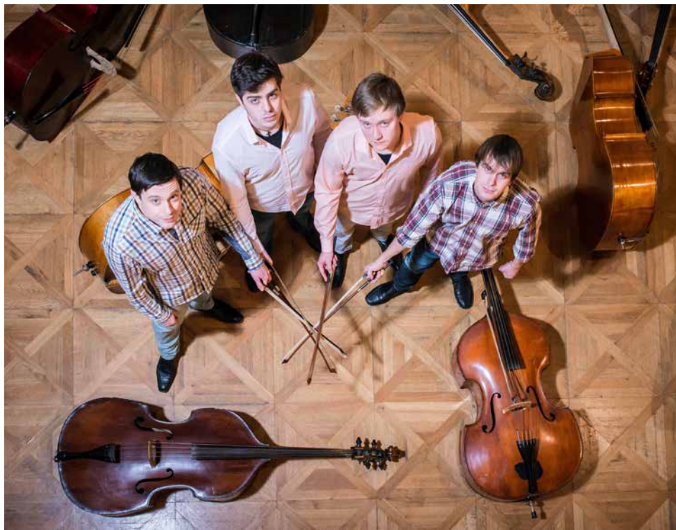
Kontrabasové kvarteto Veliss quartet. | Foto: Archiv kvarteta

Nebojte se, nejde o žádné negativní hodnocení, jen konstatování, že v pátek 23. června nám zahrají čtyři výteční mladí kontrabasisté. Můžeme se těšit na netradiční úpravy klasických skladeb i filmových melodií, dokonce zazní i Metallica a Rammstein.