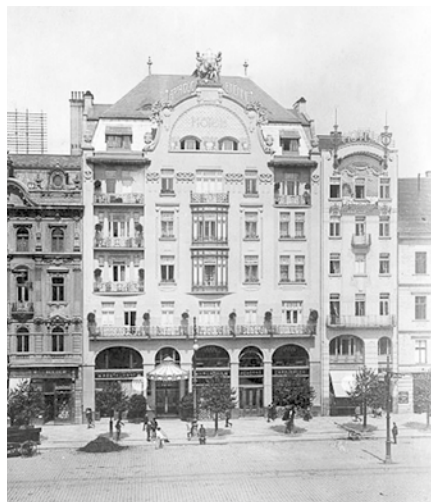
Secesní hotel Šroubek na Václavském náměstí.