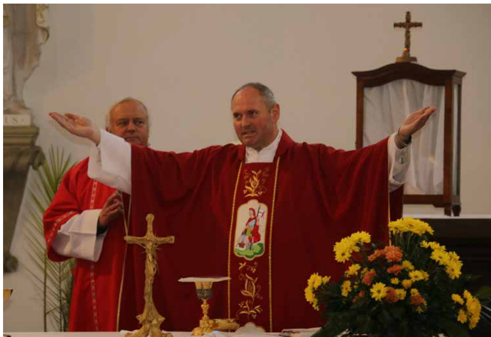
Mše svatá.