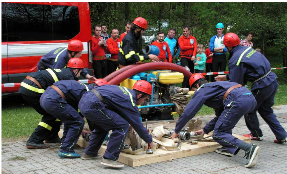
Z okrskové soutěže.