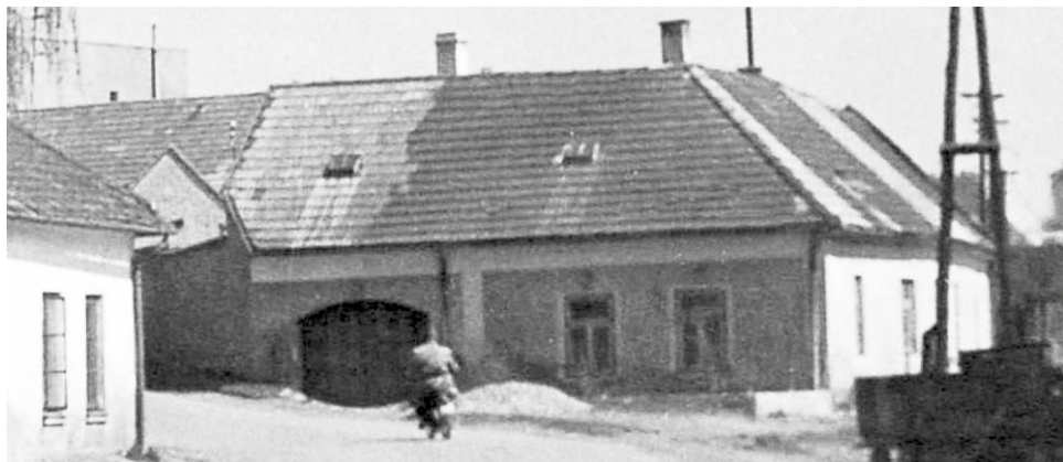
Bývalý dům čp. 154 při pohledu z ulice Pod Hradbami do ulice Kozí v roce 1969.

Seiál o domech a jejich majitelích na náměstí, v ulicích i na předměstích Velké Bíteše zabývající se dobou (již) před polovinou 20. století. Nyní ulice KOZÍ, zaniklý dům čp. 154: