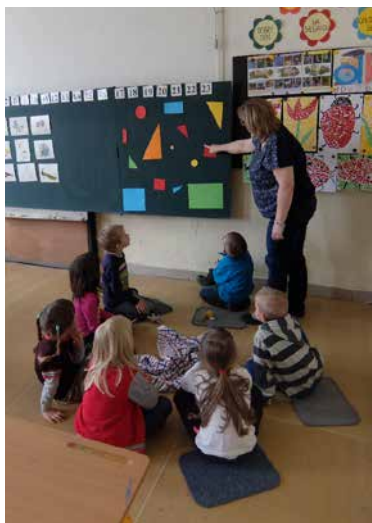
Děti na návštěvě v ZŠ.