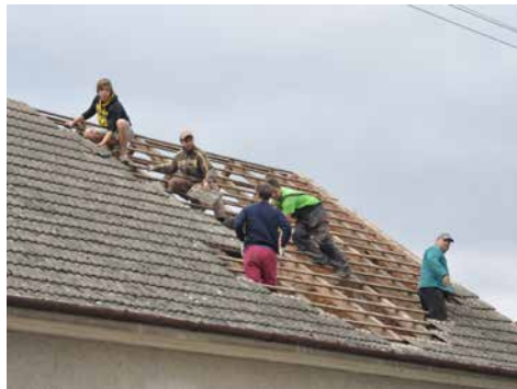
Oprava kulturního domu.

Na doporučení občanů bylo OV rozhodnuto, využít část nového „osadního rozpočtu“ k opravě střechy na kulturním domě.