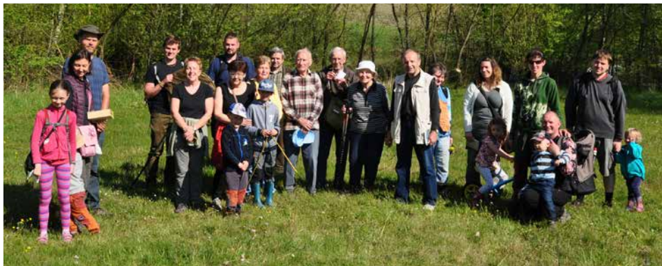
Na podmáčené louce u Heřmanova.

Poutavé vyprávění pokračovalo i v neděli 14. května na exkurzi , kde na 25 zájemců o botaniku navštívilo podmáčené louky v okolí Heřmanova a Kadolce. Zdejší „vlajkovým druhem“ je prstnatec májový, orchidej s fialovými květy a charakteristickým tečkováním listů. Pozorovány byly na třech lokalitách desítky jedinců této chráněné rostliny patřící mezi ohrožené druhy. Dalším zástupcem z chráněných rostlin byl všivec lesní patřící mezi druhy silně ohrožené. Druhová pestrost navštívených luk byla vysoká. Bezmála 40 druhů rostlin na relativně malé ploše všechny překvapilo. K dalším zde vyskytujícím se rostli-