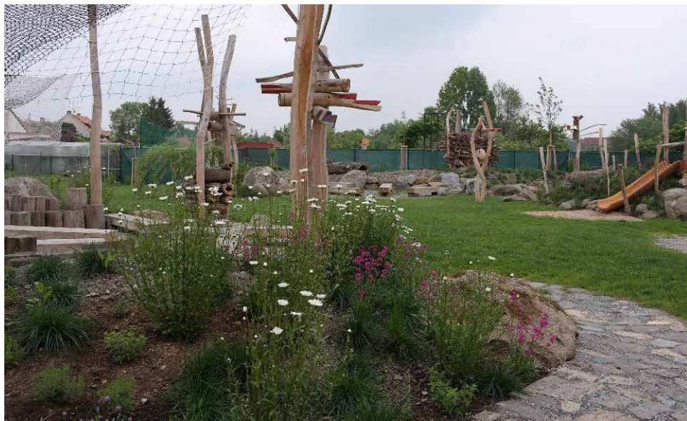
Přírodní zahrada v MŠ Lánice.

Akce je pořádána v rámci celoevropské akce „ Víkend otevřených zahrad “, do které se letos zapojí na tisíce zahrad, na Vysočině pak bude veřejnosti zpřístupněno asi 30 zahrad. Bližší informace zájemci naleznou na www.vikendotevrenychzahrad.cz .