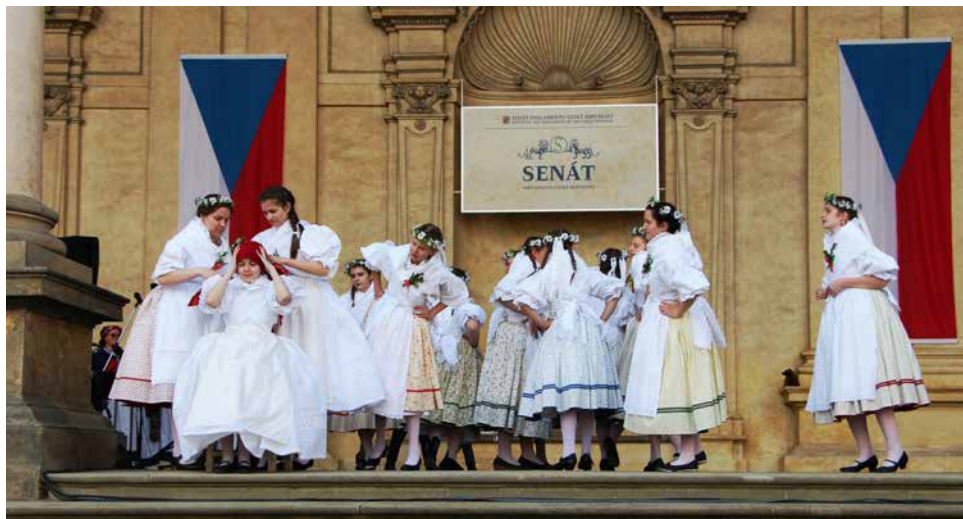
Výjev ze svatebního pásma při čepení nevěsty.

regionu. Než začalo velké strojení do krojů, přijali účastníci zájezdu od hostitele pozvání na oběd a následovala komentovaná prohlídka historických prostor paláce včetně sálu, kde senátoři zasedají k jednání.