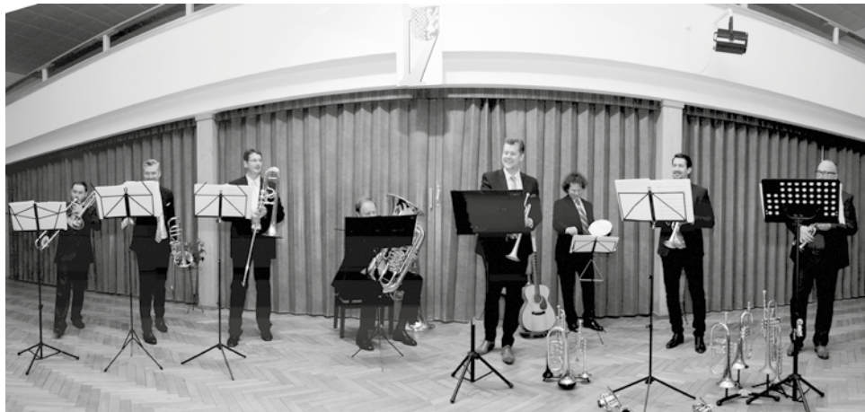
„Czech Brass“ v KD.

Jak si jistě věrný čtenář pamatuje z pozvánky v minulém Zpravodaji, v květnu jsme na mimořádném koncertu BHP uvítali vynikající soubor žesťů - Czech Brass. No, nebude se