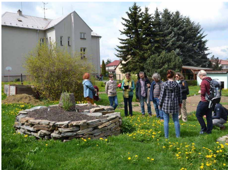
Zahraniční návštěva na ukázkové zahradě.