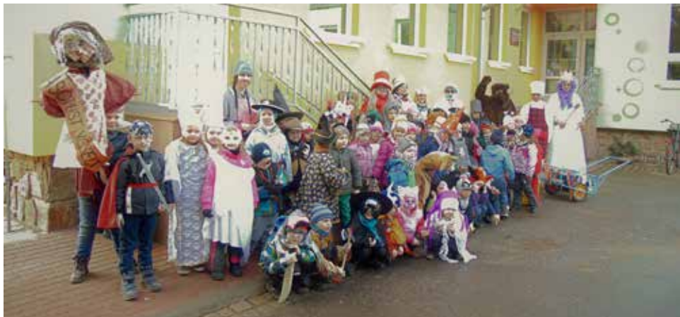
Společná fotografie z Masopustu.

Masopustní obchůzka městem se letos konala poslední únorový den. Živá dechová kapela, průvod masek městem, medvěd, masopustní suplika, voňavé koblížky a teplý čaj – zkrátka masopust jak má být.