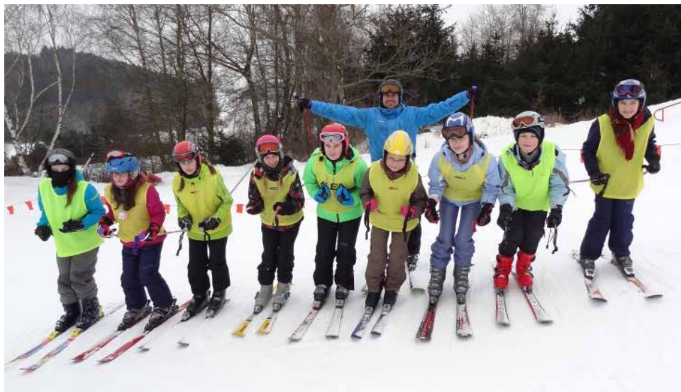
Z lyžařského výcviku.

Letošní zima přála zimním sportům. Vydal se také lyžařský výcvikový kurz žáků 7. ročníků probíhající za ideálních sněhových podmínek. Jedna z instruktorek lyžování, paní učitelka N. Malcová, konstatovala, že lyžařský týden proběhl velmi příjemně a bez zranění, což je jistě pozitivní sdělení. Padesát devět žáků se proměnilo ve více či méně zdatné lyžaře a postupně všichni zvládli záludnosti prudšího svahu na Fajtově kopci.