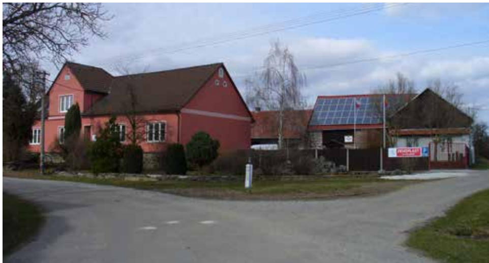
Křižovatka nových bezprašných cest.

Jiří Křikava zakončuje tuto část rozhovoru: