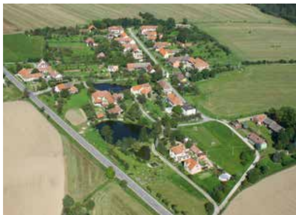
Bezděkov – letecký snímek.

Nachází se 4 km západně od Velké Bíteše, na mírně vlnité, poměrně vysoko položené planině, v nadmořské výšce 529 m, těsně u bývalé říšské, později státní, nyní silnice č.II/602 a nedaleko dálnice D1. Tvoří ji charakteristická podlouhlá náves, rovnoběžná s touto silnicí a žije v ní 62 stálých obyvatel.