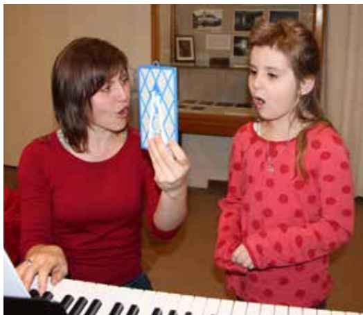
Lektorka a žákyně - snímek z průběhu kurzu.