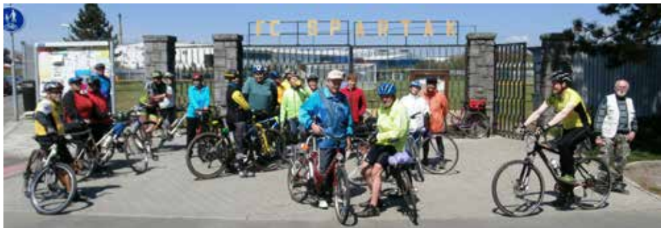
Z výletů na kole.