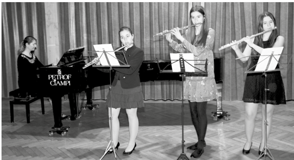
„Předskokanky“ koncertu.