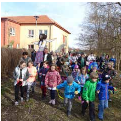
„Rozloučení se se zimou“.

Kolektiv zaměstnanců MŠ Lánice a MŠ Masarykovo náměstí