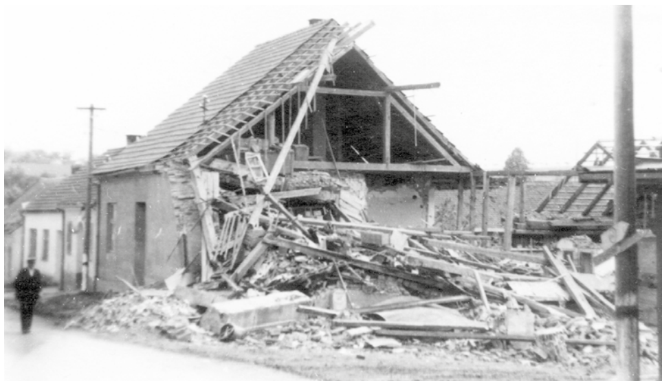
Rohový dům čp. 152, v současnosti zaniklý, po válečných událostech v květnu 1945.