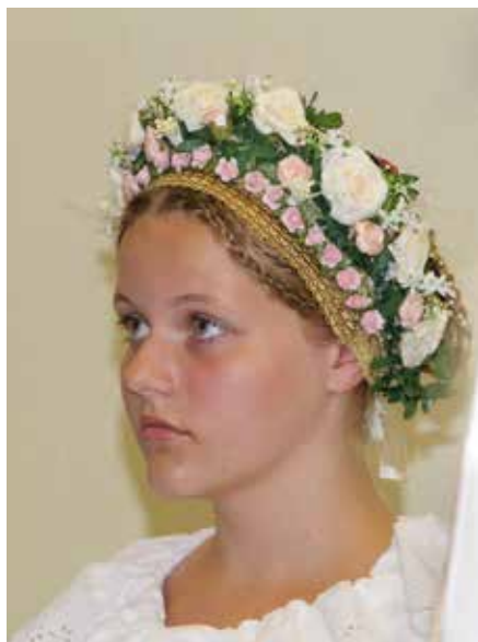
Bítešanka při rekonstrukci úboru hlavy nevěsty.

Věříme, že výstava zaujme návštěvnickou veřejnost, poskytne nejen poučení, ale bude i pro mnohou dívku či ženu zdrojem inspirace. Vernisáž se koná v pátek 28. dubna 2017 v 17.00 hodin. Výstava bude přístupná do konce měsíce září 2017, a to úterý – pátek 8.00 – 12.00, 14.00 – 16.00 hodin . Mimo otevírací dobu možnost shlédnutí výstavy po telefonické domluvě. Tel. č. 566 789 380, 731 852 112. Více informací najdete na webu muzeumbites.cz .