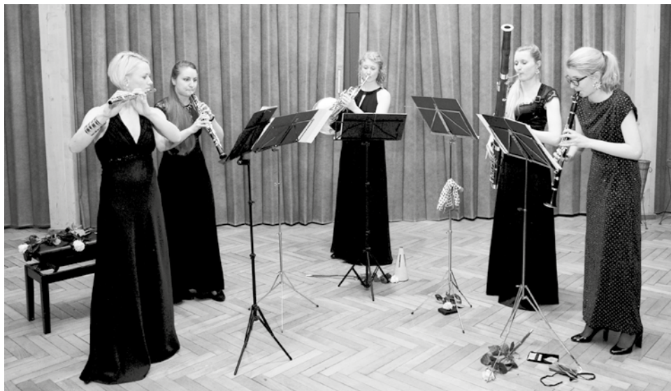
„Kalabis Quintet“ v sále kulturního domu.

V předválečném období psaná skladba židovského autora Pavla Haase, bratra známého herce Huga, jakoby už avizovala blížící se hrůzy. Stíněnost z ní přímo číší, a to i díky častým disonantním souzvukům, zvláště pak zvětšené kvartě, kterou ve středověku příznačně označovali „diabolus in musica“. Haasovi „d'áblíci“ byli tak intenzivní, že je na koncertě divoce prožívalo i jedno miminko v bříšku své maminky.