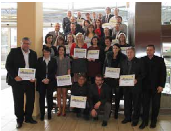
Společné foto oceněných.

Na slavnostním ceremoniálu dne 8. 3. 2017 byly vyhlášeny výsledky krajského kola Kraje Vysočina. Předávání cen se zúčastnili přední představitelé kraje, pan hejtman MUDr. Jiří Běhounek ocenil narůstající počet přihlášených měst a obcí a především úroveň jejich webových stránek. K oceně-