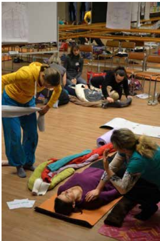
Z praktického kurzu Bazální stimulace.

V nástavbovém kurzu jsme se seznámily blíže se stimulací optickou, auditivní, orální, olfaktorickou a taktilně haptickou. Zrak nám samozřejmě umožňuje vnímání okolního prostředí, usnadňuje nám schopnost učit se a v neposlední řadě souvisí i s orientací a pocitem jistoty. Je tedy důležité klientům poskytovat dostatek zrakových vjemů a lidem se zrakovým postižením nabízet různé podněty, aby zrak mohli podle svých schopností využívat. Nabízí se využívání klasických pomůcek, jako jsou brýle, lupy apod., ale také různé jednoduché obrázky přiměřených velikostí, používání kontrastních barev, fotografie, které klient zná, a další. Auditivní stimulace podporuje lepší rozeznávání jednotlivých zvuků, sluch je považován za jeden ze základních komunikačních kanálů. Sluch můžeme podpořit poslechem hudby, zpěvu, ale někdy postačí jen vyprávění si s blízkou osobou. Slovo ústa nejspíše