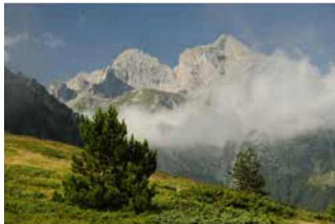
„Hory v srdci Balkánu“.

Hory na konci Evropy, hory mého srdce, věčný zdroj inspirace a místo pohodových toulek stále ještě neobjevenými kouty Starého kontinentu. Poutavé vyprávění o dvou nezapomenutelných cestách na Balkán, emotivní fotografie a autentická hudba v nové multimediální projekci, na to vše vás srdečně zve Roman Janusz a Městská knihovna Velká Bíteš ve čtvrtek 8. prosince v 17.00 hodin .