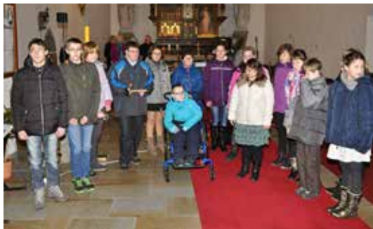
Vystoupení žáků ZŠ Tišnovská.

Vedle různých variací betlémů pana Kejdy, kde nebude určitě chybět ani betlém českých osobností, budete mít možnost obdivovat náměšťský betlém pana Vrby a pohyblivý betlém pana Maška. Naposledy zmíněný pohyblivý betlém bude zapůjčen pro výstavu do úterý 27. prosince včetně. Poté bude nahrazen betlémem statickým rovněž z dílny autora.