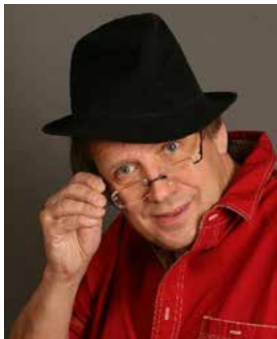
Josef Alois Náhlovský.