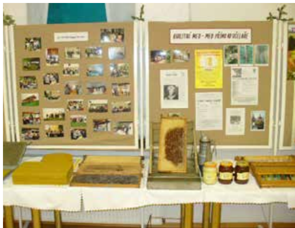
Z loňské výstavy.

včelstev již mezi jednotlivými obcemi je požadavek opravdu nezbytný, svědčí např. nálezy moru včelího plodu v letošním roce v blízkosti obvodu naší organizace (v obcích Horní Libochovná a Kundratice).