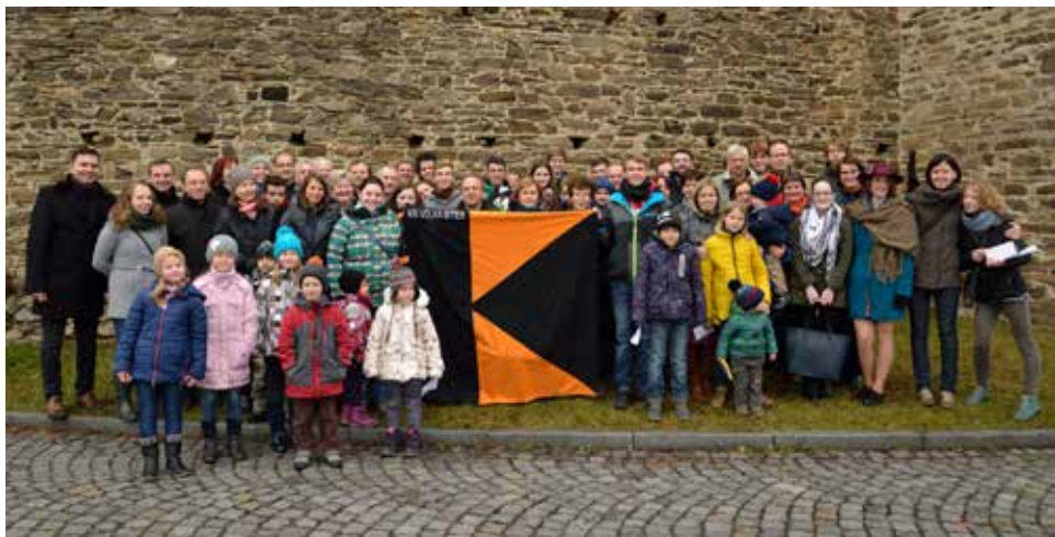
Společné foto při loučení.

mova bez zámku. Němečtí přátelé hodnotili jeho vybavení jako supermoderní a velmi ocenili, jak Domov bez zámku spolupracuje s městem a začleňuje se do života Velké Bíteše.