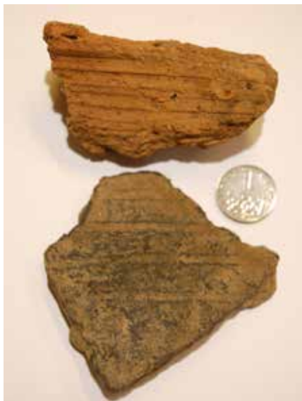
Vzorek mazanice a tuhové keramiky z Hrádku Rohy.

štiny, je označováno opevněné sídlo vystavěné na uměle nasypáném návrší tvaru komolého kužele obklopeného příkopem. Čtvercový příkop hrádku Rohy měří na vnější straně 30 x 30 m, hluboký je 1,4 až 1,8 m. Návrší v jádře příkopu má plochu asi 80 m 2 a převyšuje okolní terén o 2 m. Na návrší bylo objeveno menší množství zlomků tuhové keramiky, do červena vypálené mazanice s otisky dřeva, uhlíků a jeden zkorodovaný starý hřebík. Nalezenou keramiku lze datovat do druhé třetiny 13. století, případně i do přelomu 13. a 14. století. Tyto artefakty mohou být dokladem buď starší sídlištní struktury předcházející budování hrádku, nebo provizorní dřevěné stavby související s činností při kopání příkopu a budování návrší. Dále bylo zjištěno, že kamenné balvany, které jsou tvořeny krystalickými břidlicemi-migmatity, se vyskytují pouze uvnitř příkopu a nepokračují mimo něj ani plošně ani do podloží. Kameny, z nichž některé váží okolo 400 kg a jejichž celkový objem činí přibližně 40 m 3 , byly po vykopání příkopu dopraveny na místo z rozsutých skalek ve východním podhůří Svaté hory. Pravděpodobně se měly stát surovinou pro kamenické zpracování, ke kterému nedošlo. Je zjevné, že hrádek Rohy je torzem, při jeho budování byly provedeny pouze zemní práce, výstavba se omezila na lehkou dřevěnou konstrukci, později spálenou, osídlenou pouze dočasně.