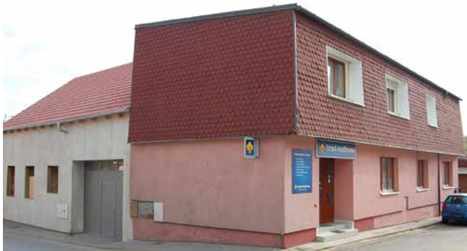
Domy čp. 147 a 148 v současnosti.

Gruntovní knihy vypovídají, že r. 1619 Šimek Típal prodal dům za 200 moravských zlatých Jiříku Noskovi , který zároveň přikoupil „ slepice čtyry, kohouta, měřiči žita, telátko, sousek pro obilí, dvě stolice, štok, s rolí na Rejtoku dvoje hony za dva díly šíří a druhej kus v Zástavách “. Asi r. 1624 získal dům „na rohu“ Šebek Lánů , který jej v roce 1626 přenechal v těžce ceně Jiříkovi Tesaři . A „ nicméně co jest Šebek prodatel gruntu na něm totiž 50 zlatých vyplatil, ty jest Jiříkovi Tesaři z lásky daroval a jako připrodal “.