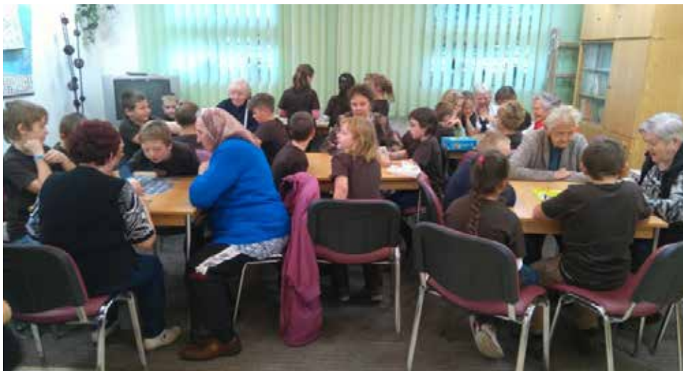
„Zazpíváme seniorům“.

M. Velebová, jedna z třídních učitelek sedmého ročníku, nás seznámila s projektem Den stromů. Jako obvykle žáci pracovali v tematických dílničkách a druhý den si v hodinové prezentaci předvedli výsledky svého celodenního snažení. Sedmáci si zaslouží pochvalu, jejich výkony byly tentokrát dobře připravené, vtipné a poučné – zkrátka takové, jaké mají být.