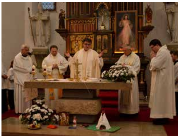
Slavnostní mše svatá.