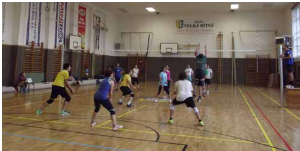
Z turnaje.

V sobotu 5. 11. 2016 se konal již 9. ročník podzimního turnaje ve volejbalu. Pod vysokou sítí se sešlo jen 8 družstev, na poslední chvíli se kvůli onemocnění hráčů odhlásilo družstvo Appola, další dojelo jen se 5 hráči. Některé týmy již patří k „inventáři“, další 3 byly zcela nové.