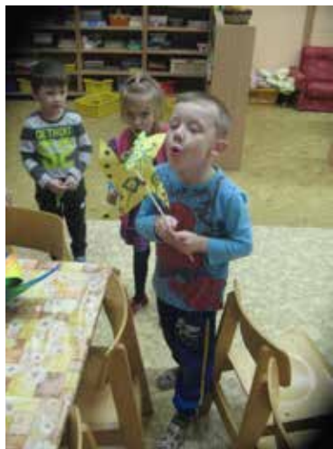
„Rozfoukáme větrníky“.

Celá Evropa si 21. listopadu připomíná cystickou fibrózu, vzácné, geneticky podmíněné a nevyléčitelné onemocnění, které postihuje především dýchací a trávicí ústrojí a radikálně zkracuje nemocným život. V České republice žije cca 600 nemocných, medián jejich dožití je 38 let. Nemocným cystickou fibrózou se někdy říká slané děti, protože mají až pětkrát slanější pot.