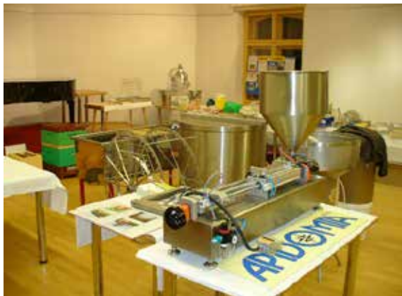
Z loňské výstavy.

Včelařství je jedním z nejstarších oborů lidské činnosti, který člověku přinášel v každé době značný prospěch. S vývojem lidské společnosti se měnilo i hodnocení jednotlivých složek užitečnosti včel. Například s výrobou cukru klesl význam medu jako základního sladidla, s rozvojem petrochemie se přestal používat včelí vosk ke svícení, s rozšířením koncentrace ploch zemědělských hmyzosubných rostlin naopak vzrostl význam včely jako opylovatele, postupně došly ocenění i ostatní včelí produkty a vzrostl význam včelařství ve využívání volného času člověka a v ochraně životního prostředí. Nejdůležitější užitek z chovu včel je jejich opylovací činnost, která se odhaduje na 80 – 90 % z jejich celkového užitku pro člověka. Je to dáno i tím, že včely jako jediný hmyz přežívají zimní období ve velkých společenstvích (zpravidla 10 000 – 20 000 jedinců) a hned v jarních měsících jsou schopny zabezpečit opylení cizosprašných rostlin. Ke včelím produktům pak kromě medu řadíme vosk, pyl, propolis, včelí jed a mateří kašičku.