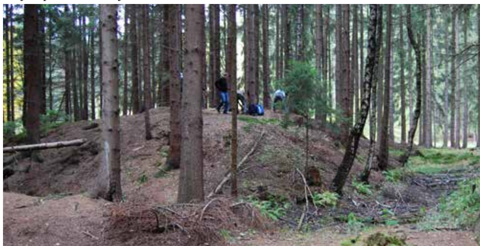
Výzkum na Hrádku Rohy 16. 10. 2016.