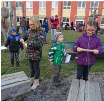
„Zamykání zahrady“.