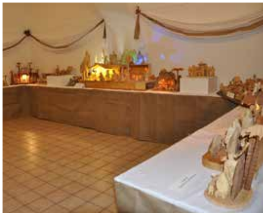
Z loňské výstavy.

Začátek vánoční výstavy betlémů, umístěné v malém výstavním sálu muzea, případně na středu 21. prosince a otevřená pro veřejnost bude do pátku 30. prosince. Obvyklá otvírací doba úterý až pátek 8.00 – 12.00 a 14.00 – 17.00 bude doplněna o mimořádnou, a to ve svátky vánoční mimo Štědrý den, tj. 25. a 26. prosince v čase 13.00 – 18.00 hodin. Ve čtvrtek 22. prosince pak bude muzeum přístupno pouze do 12 hodin. Více informací o výstavě a otvírací době naleznete na webu www.muzeumbites.cz .