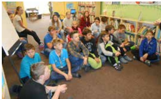
V knihovně.