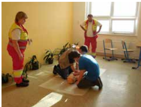
Praktická instruktáž ze školení.

Nejdříve se studenti dozvěděli velmi důležité informace týkající se komunikace s operátory ZZS a ověřili si znalost důležitých telefonních čísel. Následně získali přehled o profesionální práci záchranářů a možnostech laické první pomoci. V rámci semináře byla provedena praktická instruktáž, při níž si každý ze studentů výše zmíněných tříd mohl vyzkoušet resuscitaci (masáž srdce, vdechy) na maketě dospělého člověka a kojence.