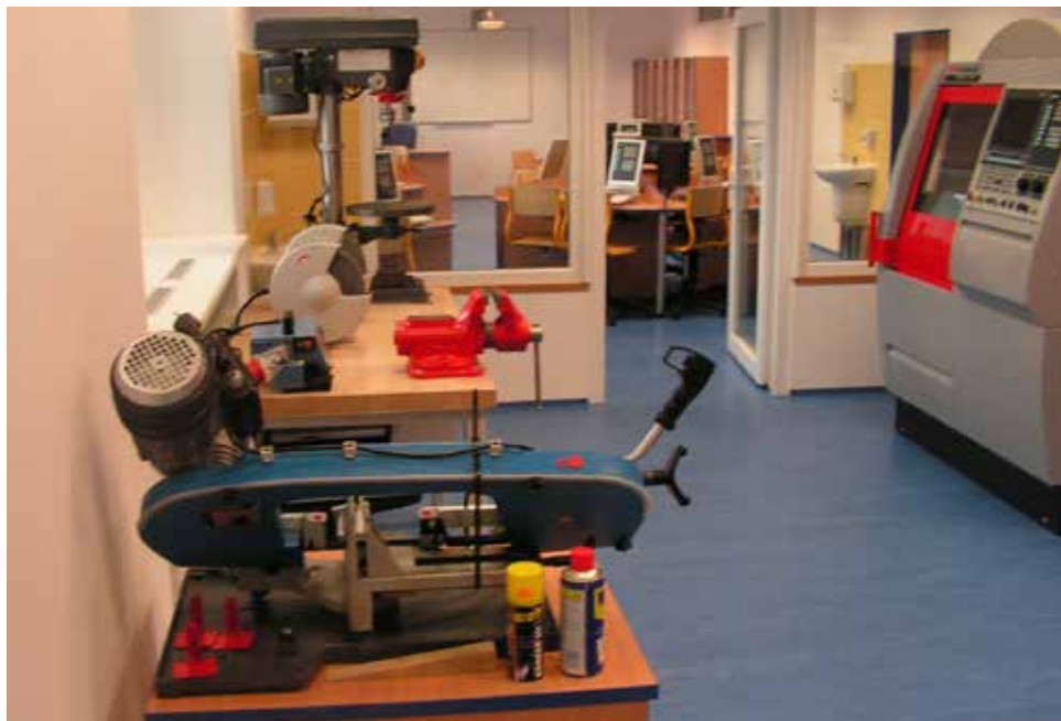
Výukové centrum oboru Mechanik seřizovač.

Slévač je jednoletý obor vzdělání zakončený státní závěrečnou zkouškou. Úspěšní absolventi získávají výuční list. Studium je organizováno jako zkrácené, je určeno pro uchazeče, kteří již mají výuční list nebo maturitu a mají zájem o rozšíření kvalifikace v dalším oboru. Studium je zaměřeno na vzdělávání v odborných předmětech a v odborném výcviku, všeobecně vzdělávací předměty žáci neabsolvují.