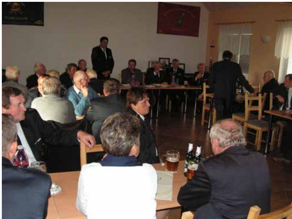
Ze setkání zasloužilých funkcionářů.