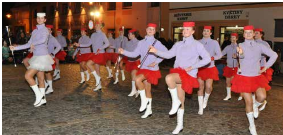
Vystoupení „Pusinek“. | Foto: Otto Hasoň

I letos Mateřské centrum Bítešáček ve spolupráci s Kolpingovou rodinou pořádalo tradiční Svatomartinský světýlkový průvod.