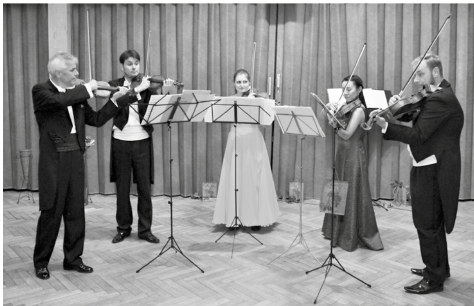
„Pod vládou smyčců“.

V koncertu G dur pro čtyři housle G. P. Telemanna se nám konečně představili všichni houslisté pohromadě a výsledkem byl bohatý zvuk a dokonalá souhra. Tři tria pro troje housle B. Bartóka jsou psána ve stylu neoklasicismu a druhá věta svojí výstavbou částečně připomíná barokní styl. Zato v rychlé třetí větě byly jasně slyšet prvky maďarského folklóru. První polovina koncertu byla zakončena cyklem Drobnosti op. 75a A. Dvořáka v úpravě pro dvoje housle a violu.